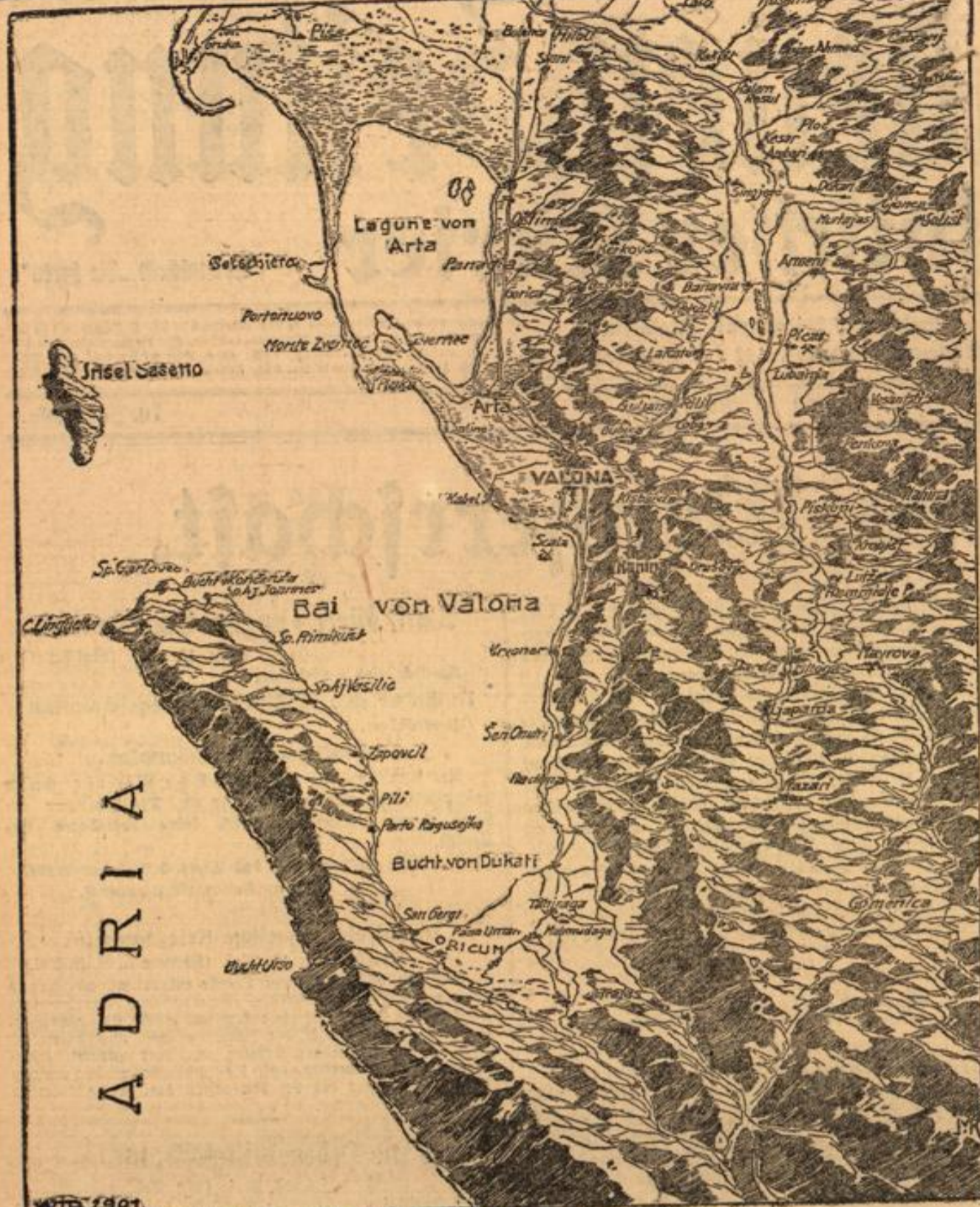
Reliefkarte von Valona u. Umgebung

führt und erklärt, die Gemeinden hätten dafür zu sorgen, daß die vorhandenen Vorräte richtig verteilt würden. Der Staat müsse dabei helfen. Die kleinen Produzenten dürfen auch nicht so ausgebeutet werden, daß Holland unterhalb des Selbstkostenpreises ernährt würde. Im Gegenteil müßten die Produzenten ermutigt und die Preise unter Führung der Behörden von Genossenschaften festgesetzt werden. Andererseits müßte über für die minderbemittelten Volksklassen durch die Gemeinden Lebensmittel zu geringem Preise als der Selbstkostenpreis geliefert werden.