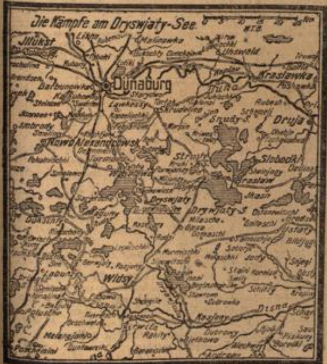
Die Kämpfe am Dryswiaty-See.

London, 21. März. (Nichtamt. Wolff-Tele.) Das Kriegsamte meldet: Vier deutsche Marineflugzeuge haben gestern Ost Kent überflogen. Das erste Paar erschien über Dover in einer Höhe von 5000 bis