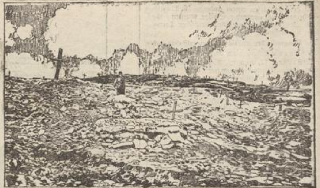
Blick auf ein Schlachtfeld an der Jsonzofront

Pflichtfeuerwehr-Uebung. Am Montag, den 21. August d. J., abends 8 Uhr, findet eine Uebung der Pflichtfeuerwehr statt, zu der alle Pflichtfeuerwehrleute zu erscheinen haben. Zusammenkunft am Geräteschuppen im Hospitalhof, Limburg, den 16. August 1916. 4614 Die Polizei-Verwaltung.