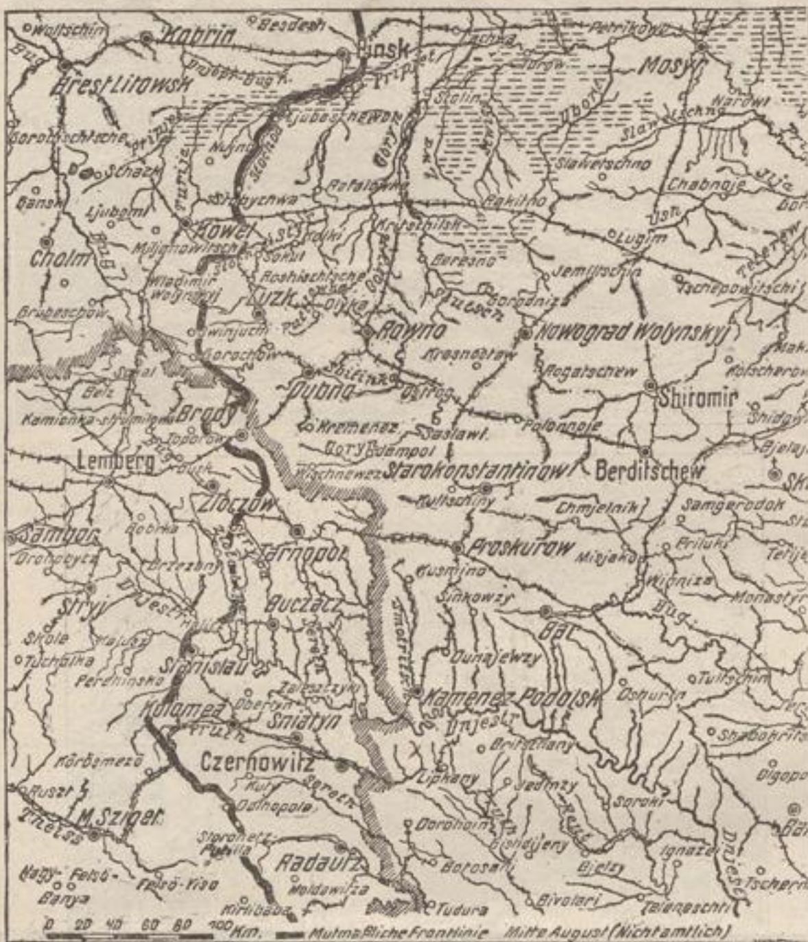
Zur Lage in Wolhynien und Galizien

Der vierte Sohn des Kaisers — Dr. Prinz August Wilhelm von Preußen — war nach einander den Oberkommandos der 2. und 4. Armee und schließlich der Heeresgruppe von Maden anvertraut und hat sich teils bei diesen Oberkommandos selbst, teils bei den ihnen unterstellten Divisionsverwaltungen und Wirtschaftsdirektionen betätigt. Am 20. November 1914 hat der Prinz, wie