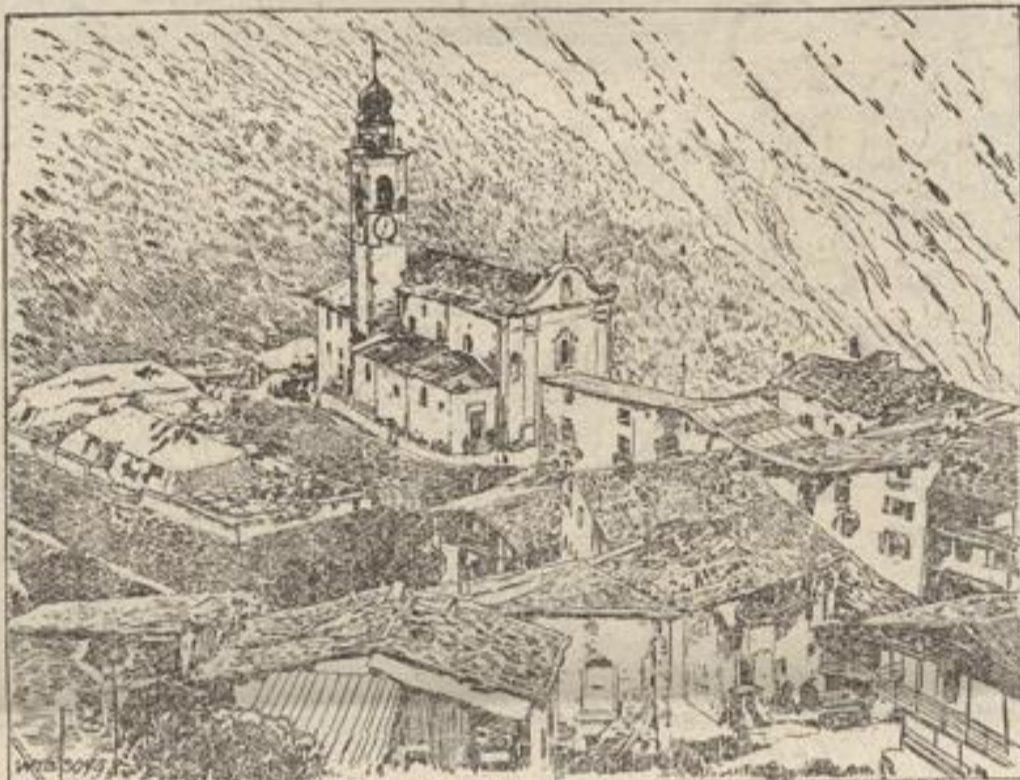
Aus den von den Österreichern besetzten italienischen Gebieten. Blick auf Piazza.

Blütenlese: jeder Deutsche, der sie liest, weiß, wo-mann er ist! Eine Erläuterung ist überflüssig!