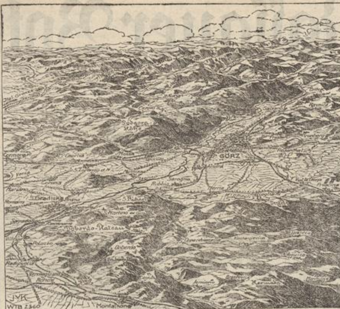
Reliefkarte zu den Kämpfen um Görz.