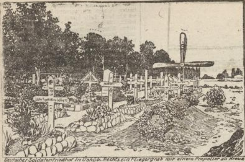
Deutscher Soldatenfriedhof in Uskub. Rechts ein Fliegergrab mit einem Propeller an Kreuz.