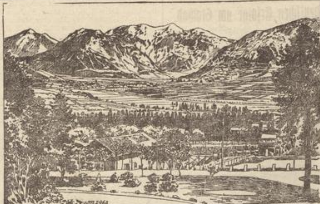
Dorf Rundschein im Brentatal mit der Cirna de dacia, wo die österreich-ungarischen Truppen die italienische Front durchbrachen.

Admiral v. Koester ging sodann zu Punkt 2 und führte aus: Unierer Feinde sei die Beherrschung Deutschlands vom Handelsverkehr voll gestillt. Es fehle an einer ausreichend starken Auslandsflotte, an genügend stark ausgebauten Stützpunkten und an einem Bundesgenossen an den ausgedehnten Küsten der Ozeane. Unsere wirtschaftliche Stellung