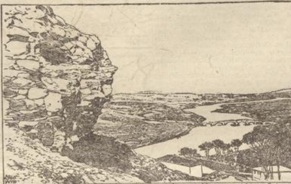
Gebirgslandschaft am Felsenpass bei Dermihissar bei Serres, während d. Bulgaren kürzlich besetzten.

bedinge eine Weltmacht-Politik, daher wäre auch eine starke Flotte auf und unter dem Wasser nötig. Wenn das durch den engen Vorkommenssinn mit Österreich-Ungarn und dem Balkan unbedingte Interesse- und Wirtschaftsgebiet auch eine bedeutende Kraft darstellt, so werden wir trotzdem, sagt Herr v. Koester, überseeische Kolonial- und Wirtschaftspolitik nicht entbehren können, wenn anders wir unserer Industrie die notwendige Selbständigkeit wahren wollen.