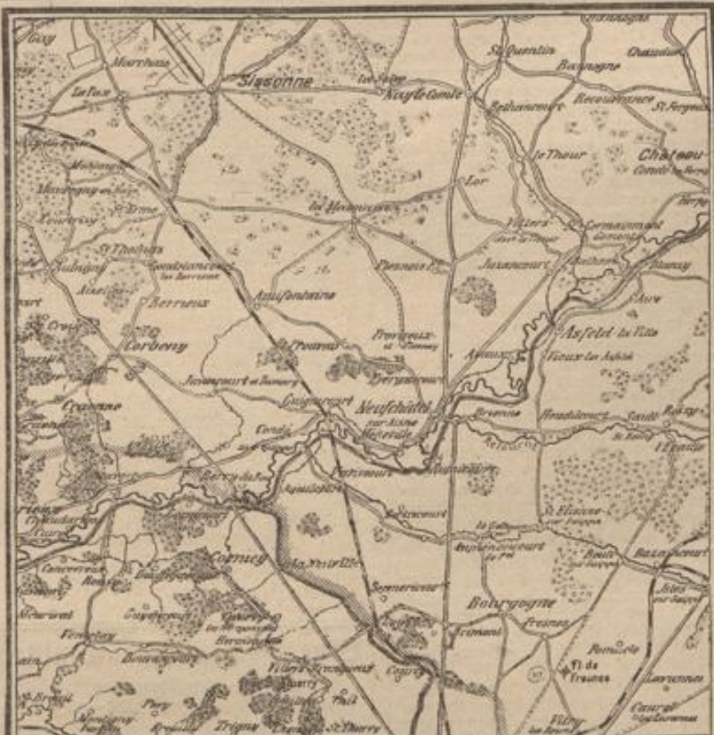
Die Front im Westen. h) Berry au Bac