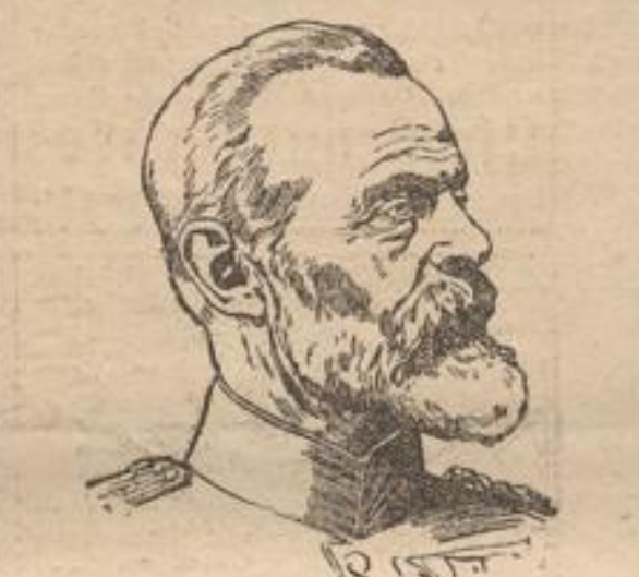
Prinz Leopold von Bayern, der Eroberer von Warschau. Zum 70. Geburtstag des Prinzen Leopold von Bayern. 9. Februar.

Einer unsterblichen ruhmreichen fählichen Heerführer, die unsern Volke in unvergleichlicher Weise draußen im Felde vor den Feinden voranleiteten, Generalleutnant Prinz Leopold von Bayern, vollendet an diesem Mittwoch seinen 70. Geburtstag. Neben seinem Neffen, dem Kronprinzen Rupprecht, dem Sieger in der großen Schlacht bei Metz, der im Westen eine Armee befehligt, ist Prinz Leopold, der Eroberer von Warschau, der vornehmliche Träger des Waffenerfolgs der Bayern in diesem Weltkriege.