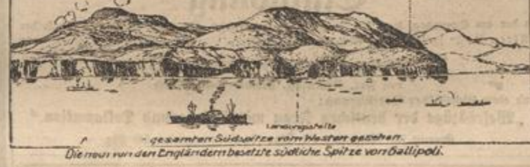
Die neu von den Engländern besetzte südliche Spitze von Gallipoli.

getroffenen u. Waisen bereits nach vielen Hunderttausenden zählt, u. es noch nicht einmal annähernd festgestellt werden kann, wie hoch dieselbe sich am Ende des Krieges belaufen mag, dann begreift man das Streben aller Kreise, der Nationalistischen Vereinigung neue Gelder zuzuführen. Und so ist die Spende „Deutscher Frauendank“ ihrem Wesen nach eine Ergänzung der Nationalistischen. Hierin liegt gleichfalls der zweite Zweck dieser Kriegspende. Ein Teil ihres Ergebnisses soll für die Invalidenfürsorge verwendet werden. Die an der Sammlung beteiligten großen Frauenverbände sollen über die Verwendung der Mittel dauernd zu entscheiden haben. Die Landes- und Ortsausstöße sind nicht nur Zustimmen für die Sammelthätigkeit, sondern sie bleiben auch bei der Verteilung der Unterstreichungen mit tätig. Der Hauptvorstand, welcher die Gewinne entgegennimmt, hat jene Vorschläge gutzuheißen zu hören und sie mit den notwendigen Ermittlungen zu beauftragen.