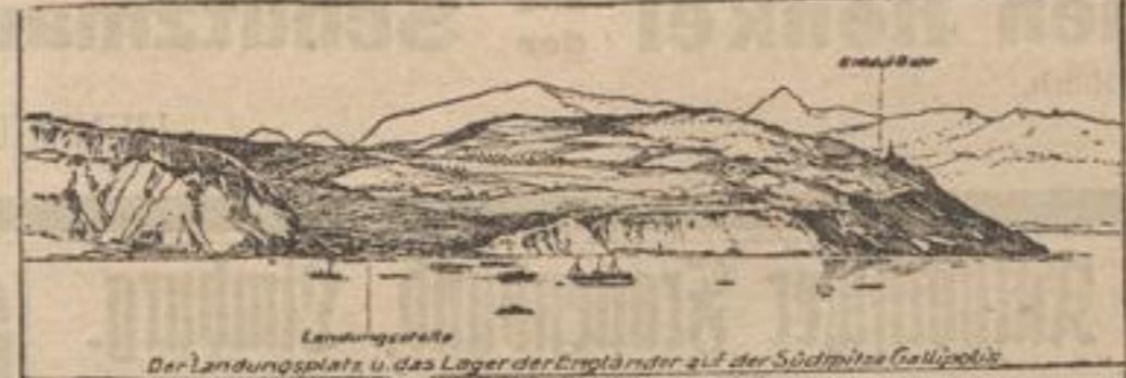
Der Landungsplatz u. das Lager der Engländer auf der Südspitze Gallipoli