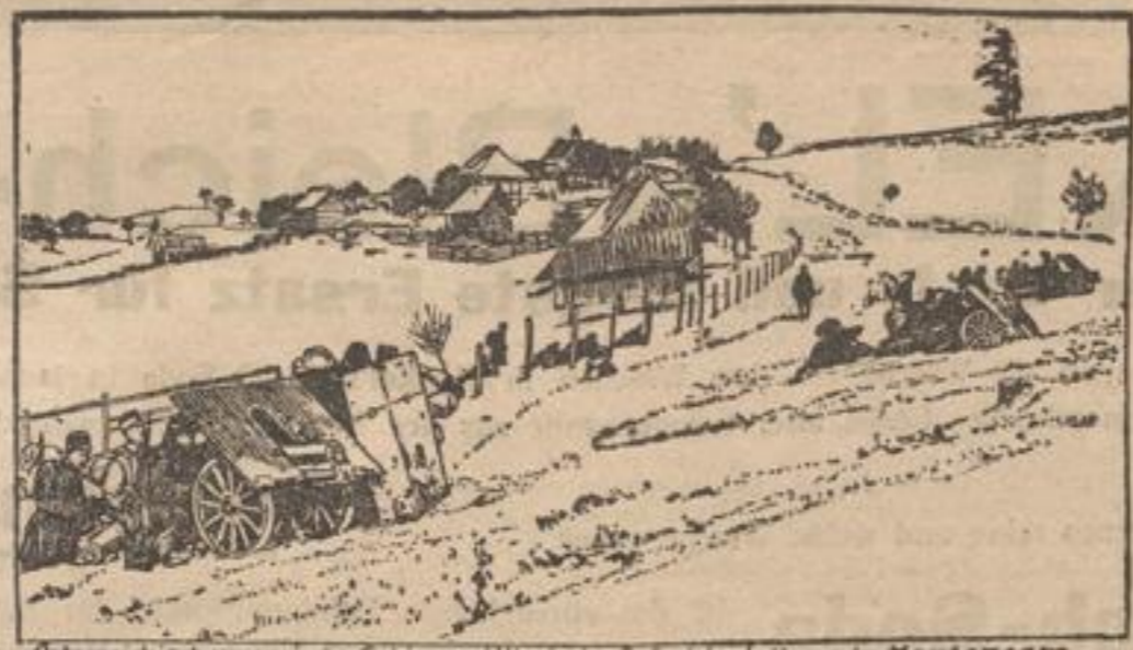
Osterr.-ungarische Gebirgsartillerie in Geländestellung in Montenegro

Sicherlich tragen wir unsere Dankeschuld gegenüber jenen Helden, welche sich opferten für ihr geliebtes Vaterland und für einen jeden aus uns, an, besten dadurch ab, indem wir für ihre Hinterbliebenen, für Weib und Kind, sorgen. Das Reich mit seinem Reiterheer ist natürlich der Hauptteil der Hinterbliebenenfürsorge. Da aber die Reiterei sich nicht nach der bürgerlichen Lebensweise richtet, ist es ohne weiteres klar, daß die staatliche Hinterbliebenenfürsorge nicht in jedem Falle völlig ausreichend sein kann. Sie bedarf in den weitaus meisten Fällen der privaten Ergänzung. Die bekannteste und größte Privatinitiative Deutschlands für die Fürsorge der Hinterbliebenenfürsorge ist die Nationalistische Vereinigung. In sie floß auch das Ergebnis der Silber- und Goldsammlung des letzten Jahres. Wenn man sich erinnert, daß die Zahl unserer Kri-