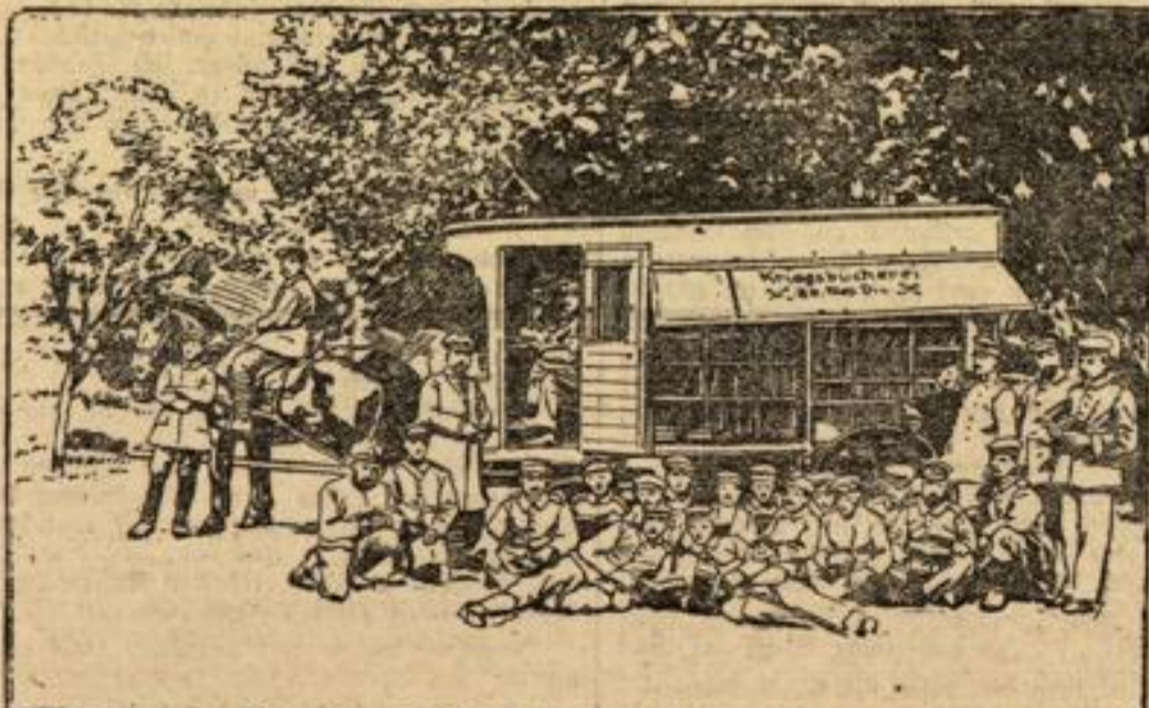
Deutsche Kriegsbücherei auf dem westlichen Kriegsschauplatz.

Man muß es den Feldgrauen lassen: sie sind ein findiges Volk. Davon zeugt unser heutiges Bild. Es stellt das Neueste der Feldentdeckungen dar. Ein Soldat, nach der Bedeutung des damals verschlossenen Wagens befragt, meinte, das ist ein „Speisewagen“. Ihm schwebte der Speisetransportwagen seiner Industrieh Heimat vor, und ganz daneben hat er nicht geraten. Vor ihm stand ein „Speisewagen für Geist und Gemüt“ — die erste fahrbare Feldkriegsbücherei der 12. Division im Westen. Der Beweis ist erbracht, daß es möglich ist, auch den Truppen an der Front die große Wohltat einer anspruchsvollen Bücherei zu erwirken.