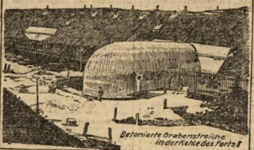
Befestigte Grabenstreife in der Kehle des Forts 8