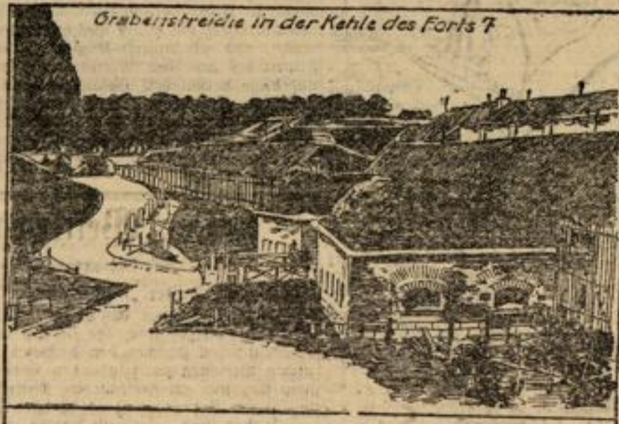
Grabenstreife in der Kehle des Forts 7