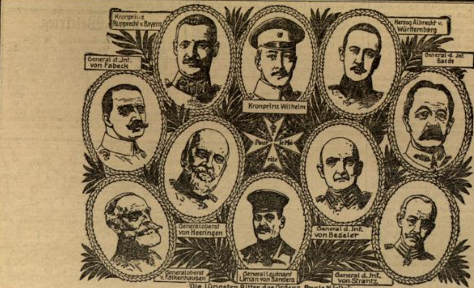
Die 10 größten Ritter des Ordens „Pour le Mérite“.