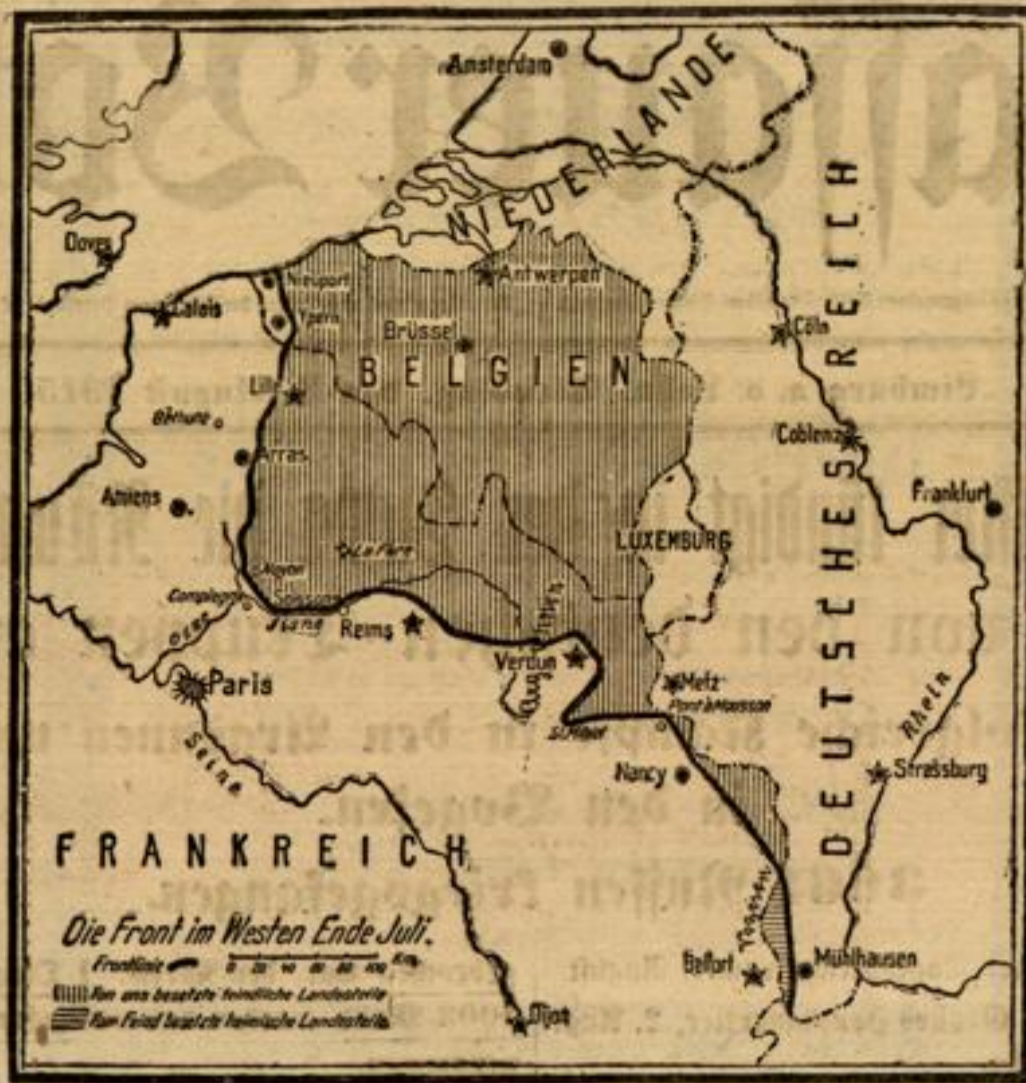
Die Front im Westen Ende Juli.

So hat der Juli, der 12. Kriegsmonat, unter guten Aussichten für die Bundesgenossen geschlossen. Bei der üblich gewordenen Monatsabrechnung stellt sich heraus, daß wir den Russen auf dem östlichen Kriegsschauplatz im Monat Juli 221 861 Gefangene, 57 Geschütze und 432 Maschinengewehre abgenommen haben. Seit Beginn der großen Offensive am 1. Mai betrug die Siegesbeute der Verbündeten im Osten an Gefangenen rund 743 000 Mann. Das ist wohl gemerkt nur die Einbuße der Russen an Gefangenen. Zu dieser enormen Summe kommen natürlich noch die außerordentlich starken blutigen Verluste der Russen an Toten und Verwundeten. Es leuchtet wohl ein, daß ein solch überreichlicher Werdlaß in nur 3 Monaten allgemach auch über die riesigen Kräfte des russischen Varen geht und er nachher abankünftig auf seinen Hinterbeinen zitterig zu werden. Noch härtere Prüfungen aber stehen dem Jwan Jwanowitsch in den nächsten 4 Wochen noch bevor. Die Aufgabe der so lange Jahre verteidigten Weichsellinie durch den Großfürsten, welche von den russischen Blättern als heilsamer Entschluß zur Erhaltung einer schlagfertigen Feldarmee, in allen möglichen Tonarten angepöndelt wird, dürfte der Anfang vom Ende sein. Was der J I I von Warschau militärisch und politisch zu bedeuten hat, weiß auch der dünnste Ruschik im russ. Reich zu würdigen. Der eiserne Ring um die Weichselfestung Zwangorod zieht sich immer enger zusammen; noch steht der russ. Befehlshaber von Zwangorod eine Eisenbahnlinie zur Flucht zur