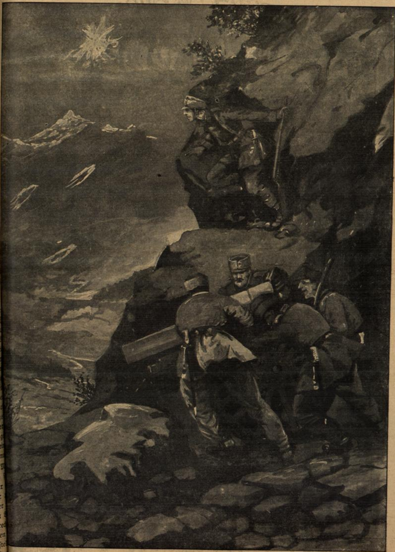
Österreicher bringen ein schweres Geschütz an der italienischen Grenze in Stellung.