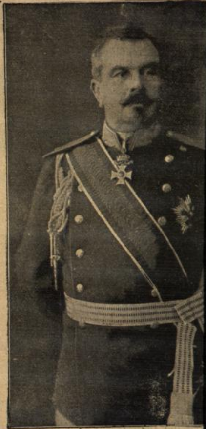
General Fillschew, der frühere bulgarische Kriegsminister bedeutendsten Heerführer Bul