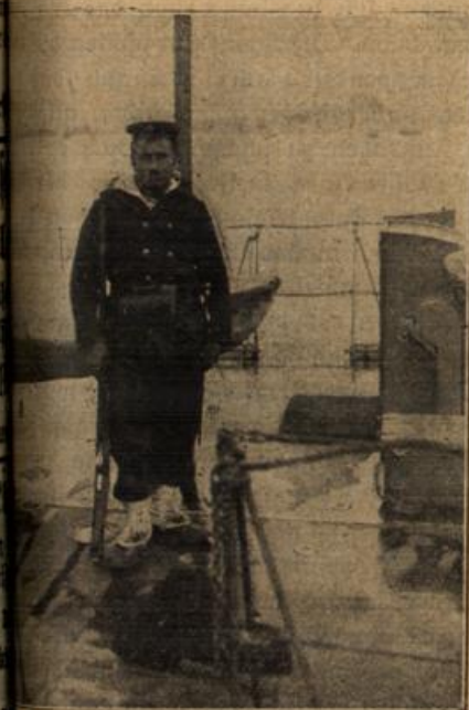
Mobilmachung in Griechenland. Man auf einem griechischen Torpedoboot.