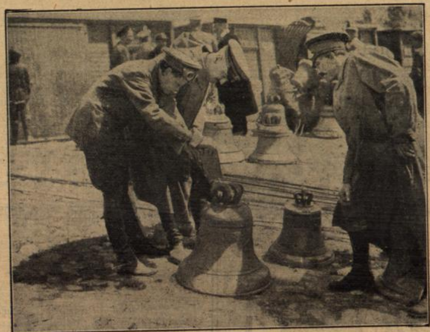
Wenn die Russen ihre großen Städte räumen, sind sie eifrig bemüht kein Material zurück zu lassen, das den Feinden irgendwie nützlich sein könnte. Besonders alles Metall wird fortgeschafft, selbst Kirchenglocken, wie wir in unserem Bilde sehen.