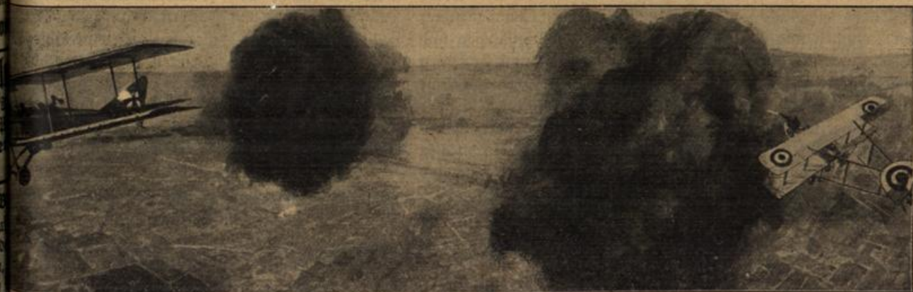
Ein Zweikampf in den Lüften zwischen einem deutschen und einem feindlichen Flugzeug an der Westfront.

Bulgarische Infanterie. Wie man sieht, erfreut sich die bulgarische Infanterie einer schmucken Ausrüstung, die zugleich den Vorzug großer Feldtauglichkeit besitzt.