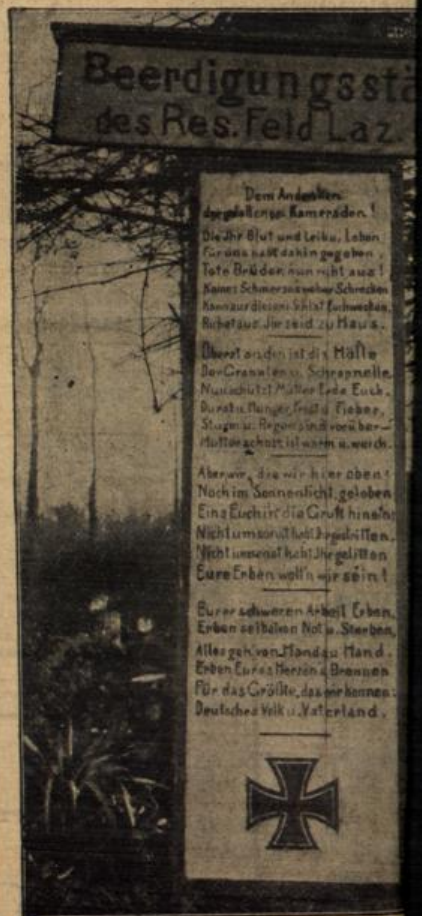
Grabdenkmal in Nordfr Eine Gedenktafel an der Beerdigung Lazarett Nr. 66 im Walde vo