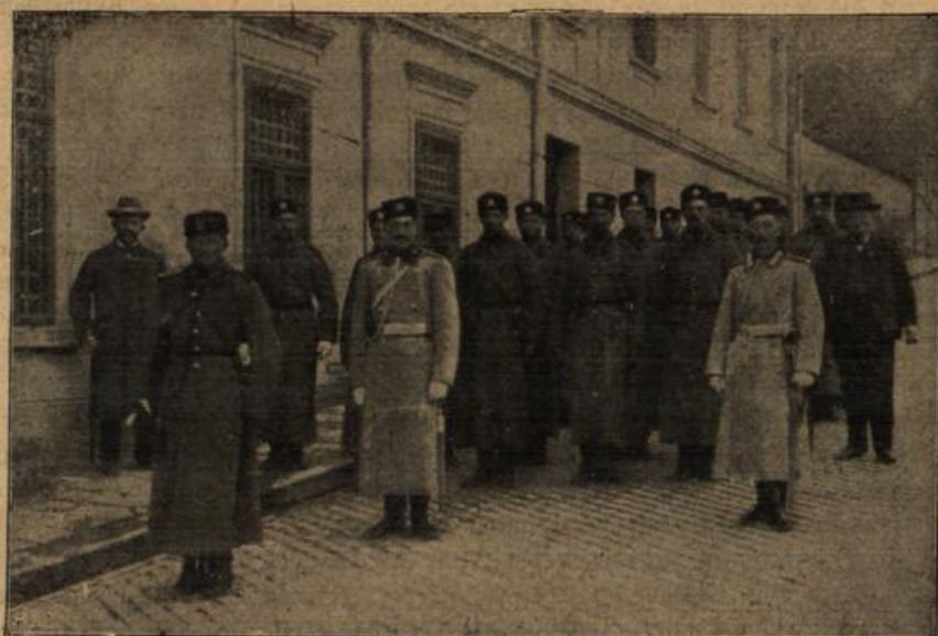
Zur Mobilmachung Bulgariens.

Bulgarische Infanterie. Wie man sieht, erfreut sich die bulgarische Infanterie einer schmucken Ausrüstung, die zugleich den Vorzug großer Feldtauglichkeit besitzt.