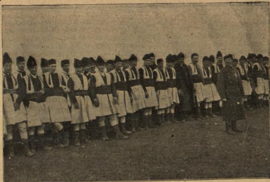
Mazedonische Truppen im bulgarischen Heere.