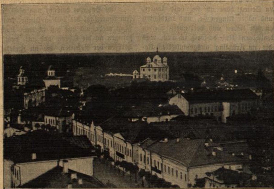
Smolensk, der voraussichtliche Sitz des russischen Hauptquartiers.

„Der teilweisen Zurücknahme der ersten einzelnen Stellen der Front kommt nicht nur in der Gesamtausdehnung der 500-Kilometer-Stellung keine entscheidende Bedeutung zu, sondern sie zeigt die Elastizität unserer Linien, die das wirksamste Mittel