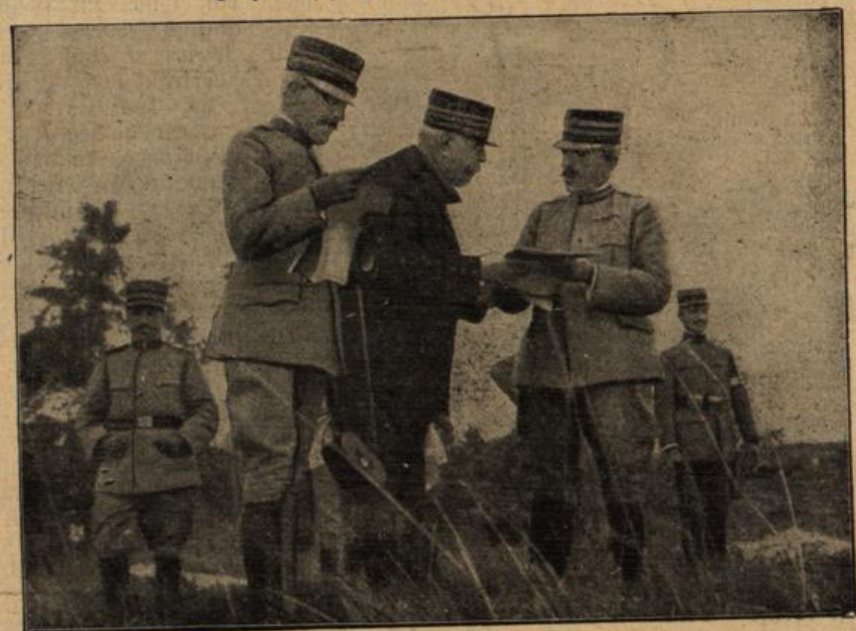
General Joffre an der italienischen Front. Wir zeigen hier General Joffre im Gespräch mit dem italienischen Generalstabchef.