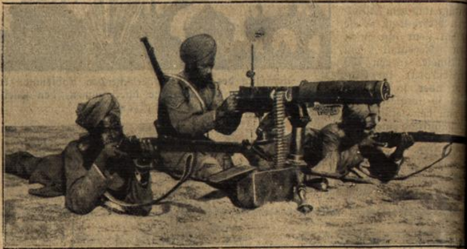
Eine indische Maschinengewehr-Abteilung in den Kämpfen am Suezkanal. In der Hauptsache kämpfen am Suezkanal auf Seite der Engländer kanadische und australische Truppen. Die indischen sind zum größten Teil nach Frankreich abgeschoben worden, da sie sich weigern, gegen ihre mohammedanischen Genossen zu kämpfen. Unser Bild zeigt noch eine indische Abteilung in Ägypten.