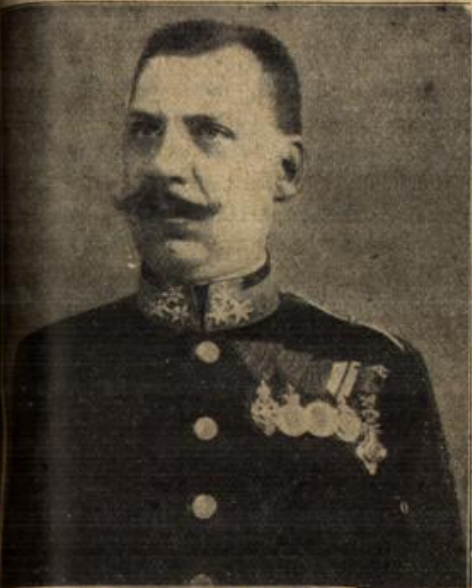
Kommandeur der Motor-Batterien, ... vom Kaiser und König Franz Josef empfangen. ... über die erfolgreiche Arbeit der in Belgien ... tätigen Batterien ausführlich Bericht erstatten.

herangezogenen. An Menschenmaterial scheint es den Russen jedenfalls nicht zu fehlen, da sie immer neue Leute auf den Kampfplatz senden können, um die entstandenen Verluste wieder auszugleichen. Es wird aber übereinstimmend gemeldet, daß die Güte der Truppen immer mehr abnimmt. Nur dadurch ist es auch zu erklären, daß sämtliche feindlichen Angriffe, trotz großer zahlenmäßiger Überlegenheit, von den Verbündeten stets unter schweren Ver-