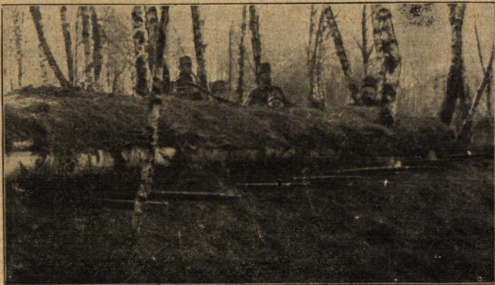
Eine Schützengruppe österreichisch-ungarischer Infanterie in Russisch-Polen in einem Birkengehölz versteckt.