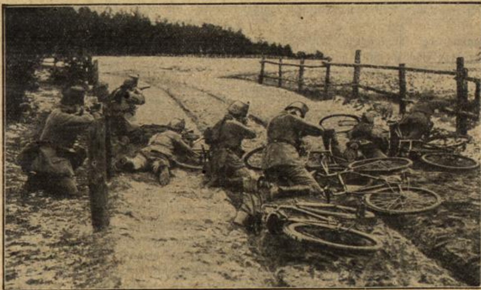
Eine Radsahlerpatrouille in Verteidigungsstellung. Wir sehen eine deutliche Räderabteilung, die auf ihren Rädern eine Patrouillenfahrt unternommen hat und wie sie, trotz der Angriffe, in Verteidigungsstellung den Gegner bekämpft.

... durch die Ve- ... aus dem ... österreichischen ... behauptet ... Kriegspresse- ... mit ... vertritt ... Die Russen ... danach noch ... versucht, ... Vorgehen der ... Verbündeten über ... Gebirge auf- ... alten und ihre ... verfüg- ... Kräfte dort ... gezogen. Die ... herange- ... Verjää- ... sind offen- ... bedeutender ... beträchtlicher ... alle bisher