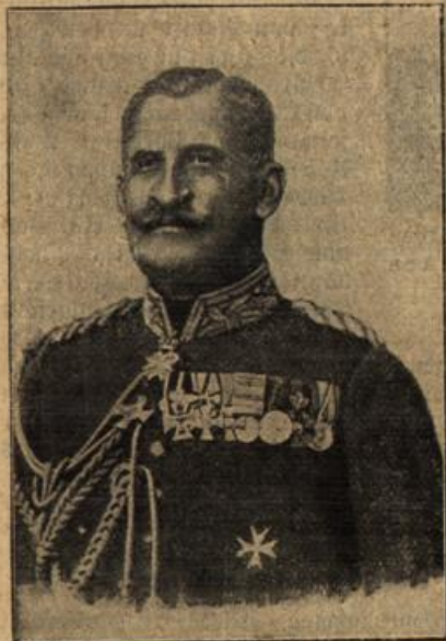
General von Linington, der Führer der deutsch-österreichisch-ungarischen Karpäthen-Armee.