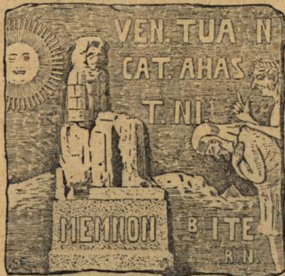
„Wenn du an Kata hast, nimm eben ein Bittern.“