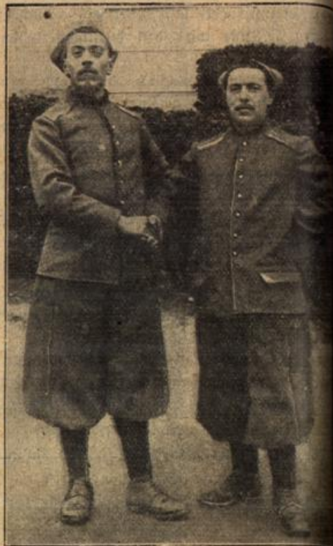
Die neue französische Zouavenuniform.

forderte seine besten Juristen auf, Gegenteil zu verteidigen. Der Schluß, daß Holland sich erschöpfte und reichsten Kolonien verlor. Holland wundert die englische Regierung, kann aber das Gefühl des Mißtrauens