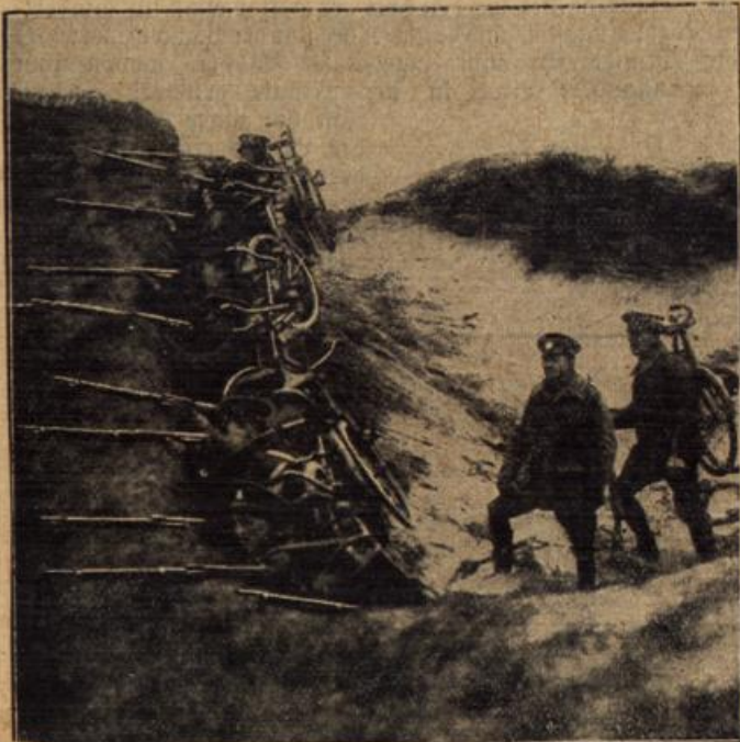
Eine englische Radfahrertruppe in den Dünen bei Dünkirchen.