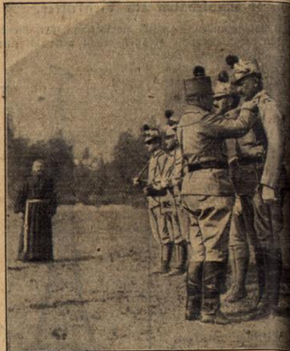
Die Dekorierung eines Tiroler Landesschützen durch Vorgesetzten; im Hintergrunde ein Feldpater.