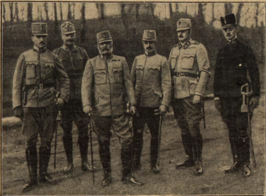
Der Führer der österreichisch-ungarischen Streitkräfte, Erzherzog Friedrich und sein Staff.

... durch die Ve- ... aus dem ... österreichischen ... behauptet ... Kriegspresse- ... mit ... vertritt ... Die Russen ... danach noch ... versucht, ... Vorgehen der ... Verbündeten über ... Gebirge auf- ... alten und ihre ... verfüg- ... Kräfte dort ... gezogen. Die ... herange- ... Verjää- ... sind offen- ... bedeutender ... beträchtlicher ... alle bisher