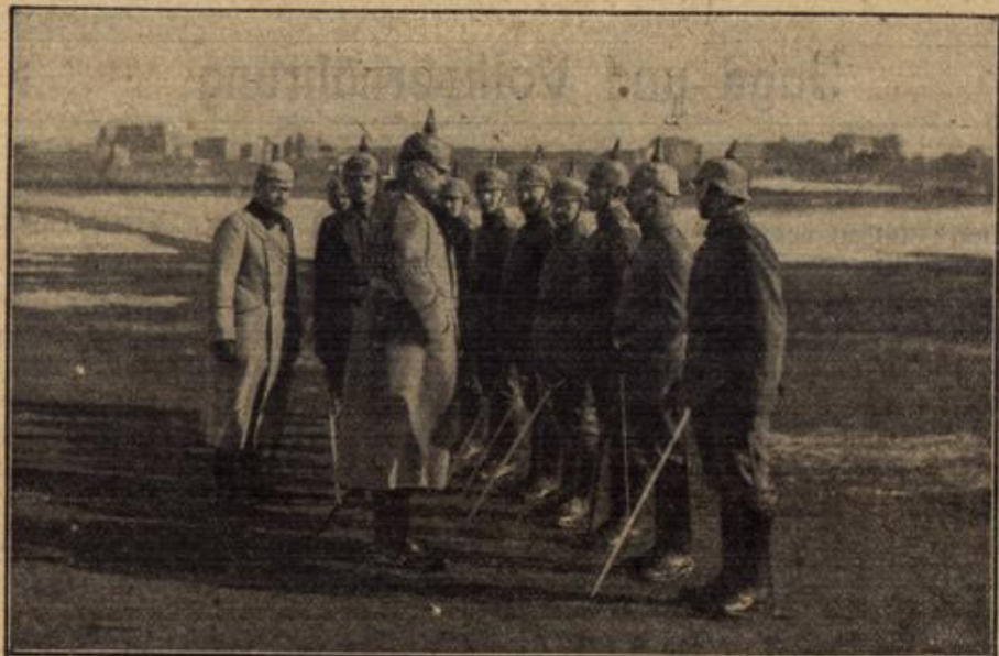
Feldmarschall v. Hindenburg begrüßt die Offiziere des Ersatzbataillons seines Regiments Nr. 147. Wie bekannt, hat S. M. der Kaiser dem Führer unserer Truppen im Osten in Anerkennung seiner Verdienste, das Infanterie-Regiment Nr. 147 verliehen, und wir sehen hier, wie der Feldmarschall kurz nach der feierlichen Übernahme des Regiments und nach abgenommener Parade über das Ersatzbataillon, die Offiziere mit freundlichen Worten begrüßt und in seiner echt deutschen, schlichten Weise sich nach dem Namen, Zivilberuf und Heimat eines jeden Offiziers erkundigt.