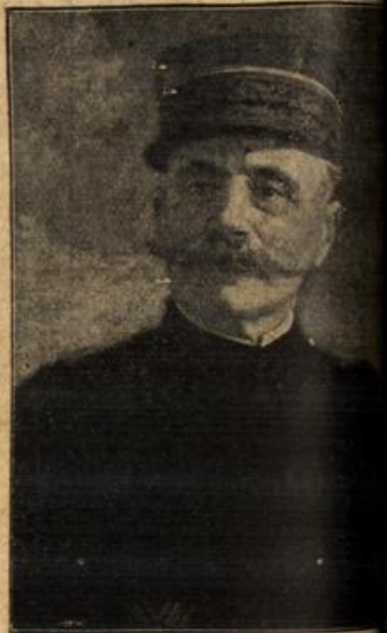
General Foch, der Führer der französischen Nord-Armee.