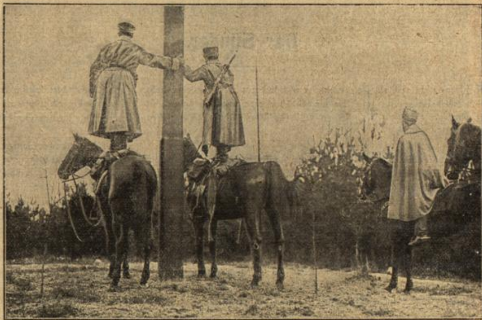
Ghusaren auf Beobachtungsposten.

gegen England nicht unterdrücken. Auftreten Churchills in Antwerpen, das die Holländer viel Genaueres wie die Engländer, ist auch ein weshalb Holland kein Zutrauen zu land hat. Deutschland war bis