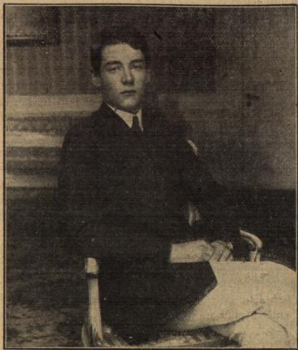
Der jetzige Fürst Otto von Bismarck, der Enkel des Reichskanzlers, der zurzeit im Felde steht, ist geboren am 22. September 1897 als Sohn des Fürsten Herbert von Bismarck.

In den Gewässern der Dardanellen ist es den Verbündeten bis jetzt sehr schlimm ergangen. Eine ganze Anzahl Schiffe ist gesunken oder schwer beschädigt, zahlreiche Mannschaften getötet und verwundet, und erreicht wurde — nichts!