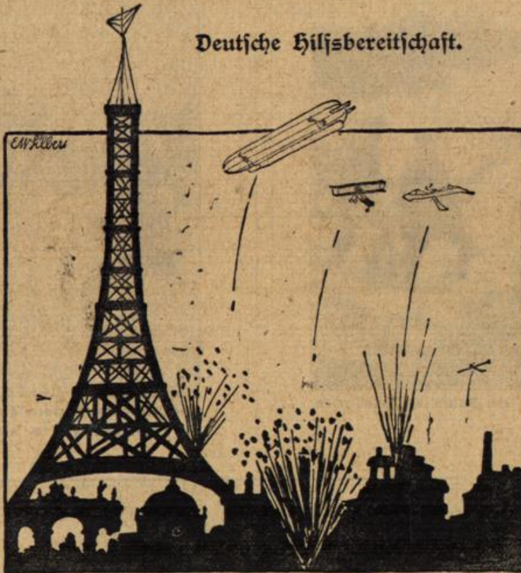
Anlässlich des in Paris herrschenden Kohlenmangels haben es die deutschen Luftfahrzeuge übernommen, den Parisern von Zeit zu Zeit gründlich einzuheizen.