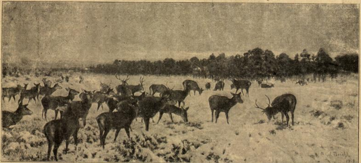
Hochwild im Schnee. Nach einem Gemälde von Alfred Graf v. Brühl.

lich kühle Natur, während der munteren Anna stets das Fort über die Zunge hüpfte. Und damit hatte sie heute der geliebten Freundin so wehe getan! Sie konnte es sich selbst nicht verzeihen! — Aber niemals hatte sie sich auch in die Lage der kinderlosen Frau so