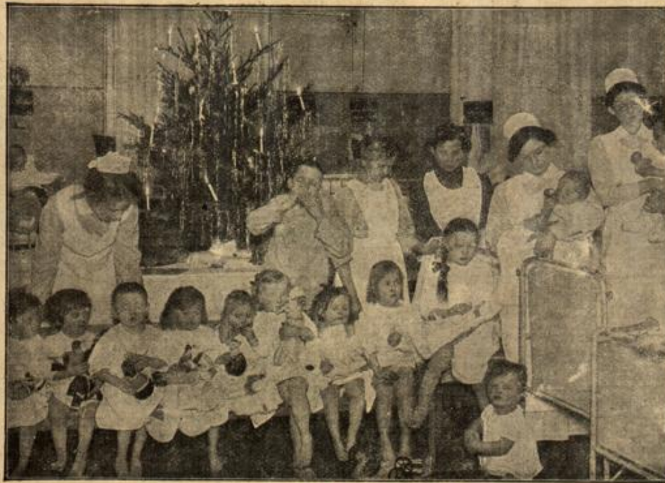
Weihnachten im Kinderkrankenhaus.

Anna war gerade damit beschäftigt gewesen, den Christbaum mit vergoldeten Nüssen, rotbädigen Äpfeln und leichtem