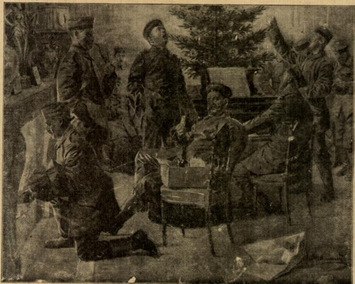
Stille Nacht, heilige Nacht! Gezeichnet von R. Webenmeyer.

"Und über unsern Baum wird sich heute kein Einziges freuen! — Aber morgen soll er für Annas Kinder wieder brennen." Und sie dachte an die kleine Irngard, Annas jüngstes Töchterlein; es war ihr besonderer Liebling, und sie dachte plötzlich, wenn Anna ihr die Irngard gäbe, daß sie sie lieben würde, so zärtlich, wie ihr leibliches Kind! Wer wald ein wunderlicher Einfall, — Anna würde sich ja um alles in der Welt von einem ihrer Kinder nicht trennen. Wenn sich nun aber ein anderes Kind fände, ein kleines, verlassenes Kind? — sie wußte mit einem Male, daß sie auch ein solches mit Liebe an ihr Herz nehmen könnte, ja, sie hatte in diesem Augenblick ein schmerzliches Sehnen nach so einem armen, hilflosen, kleinen Wesen! Wie sagte doch Anna? "Ihr könntet so gut eins ernähren!" Wie ein Vorwurf trat es an Hildegard heran, daß sie es nicht schon längst getan. Sie seufzte schwer. Ihre Gedanken verirrtten sich auf die Nachtseite des Lebens, wo Not und Tod weilen, wo sich hilfselehende kleine Armdchen ausstrecken. —