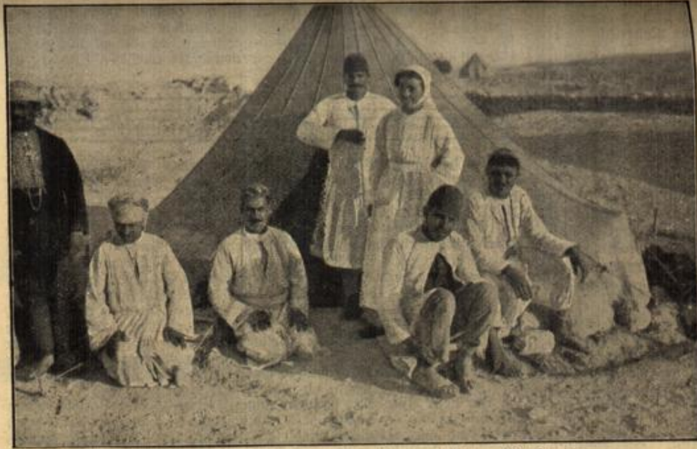
Eine deutsche Krankenschwester in der Wüste. (Mit Text.)