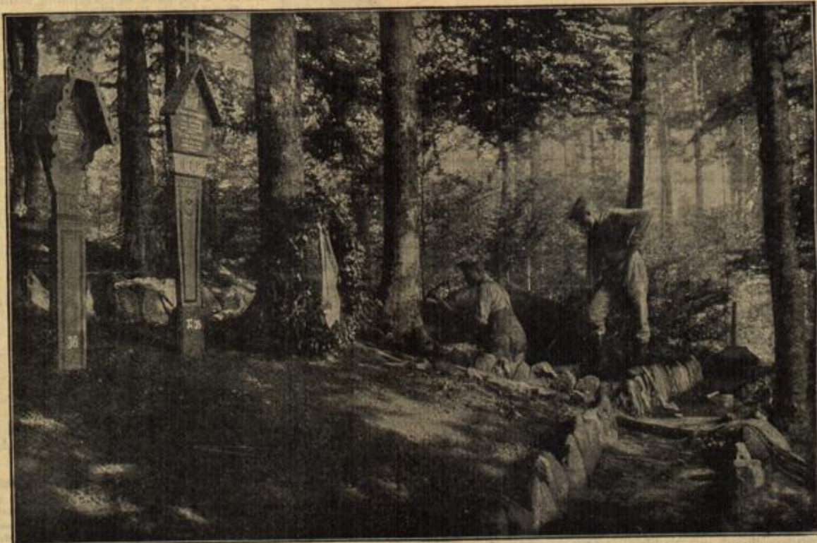
Waldfriedhof in den Vogesen, 1000 Meter vor der feindlichen Front.

„Dies ist der schönste Weg im ganzen Park. Wenn ich von hier auf den Teich blicke, in den weißen Nebel, so meine ich immer, Elfen müßten dort unten erscheinen ... mit