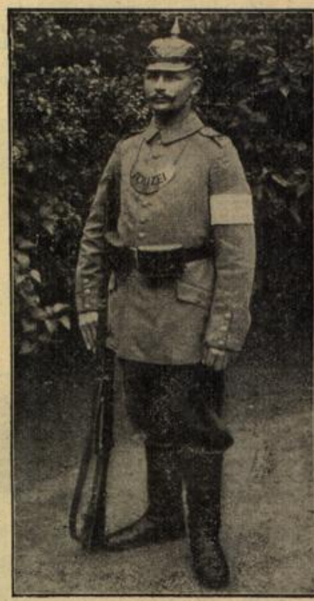
Deutscher Militärpolizist in Brüssel. (Mit Text.)

"Nun?" "Ladellos, Bubi! Wirklich! Ich gratuliere."