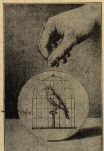
Der Vogel im Käfig während der Scheibendrehung.

und Mittelfinger ausgeführten Schwung in eine rasche, drehende Bewegung versetzen, so daß sie auf einem Punkt ihrer schmalen Kante steht und sich dabei dreht. Gewiß hat jeder von uns schon einmal mit einem Geldstück die gleiche Bewegung ausgeführt. Blickt man nun gegen die