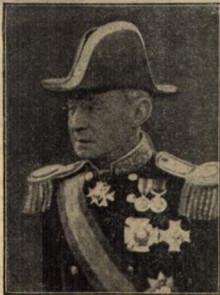
Henry B. Jackson, der neue Chef der britischen Admiralität.

Keine fehlte in dem großen Kreis, denn es galt zu beraten, ob dieses Jahr ein Liebhabertheater oder aber ein Bazar vom Verein der wohlthätigen Frauen arrangiert werden sollte.