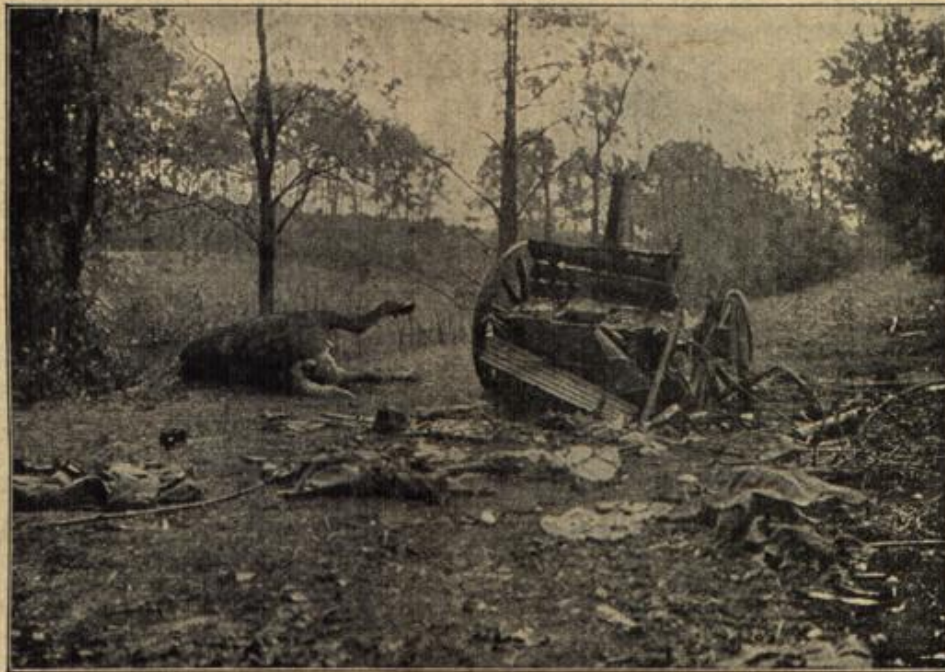
Nach der Eroberung von Przemyśl: Die Überreste einer russischen Proße, die von einer großkalibrigen Granate getroffen wurde.