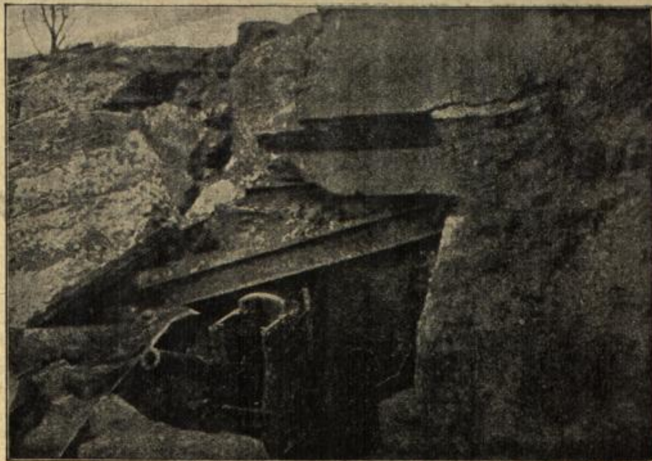
Ein von den Bayern erstürmtes Nordfort von Przemysl. (Mit Text.)