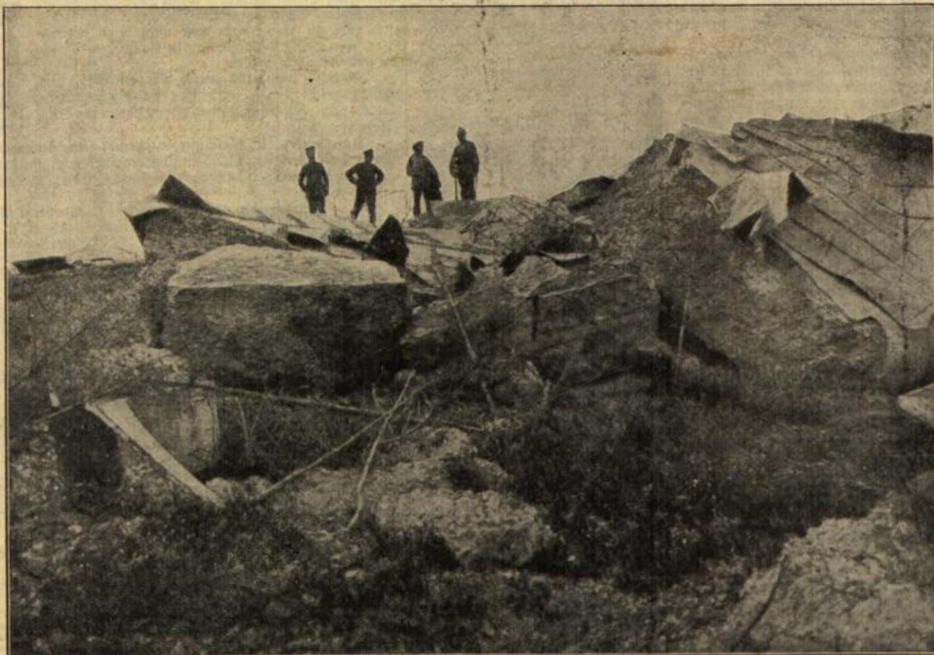
Fort XI von Przemysl nach der Beschickung durch schwere Artillerie. (Mit Text.)

„Ach, was Sie sagen — — so — so!“ ertönte es in der Runde.