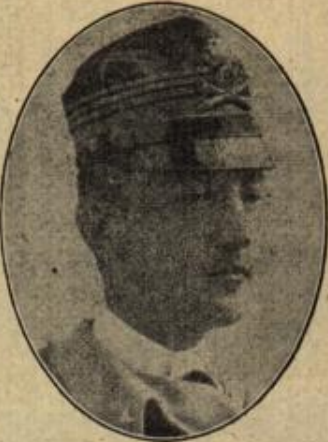
Prinz Emanuele Filiberto, Herzog von Roßa, ein Vetter des Königs Viktor Emanuel, übernahm das Kommando einer italienischen Armee.

Wese dem Neuhinzugekommenen, der sich den hergebrachten Vergnügungen entzieht, als da sind der Regelaabend, der Frühshoppen im „goldenen Baum“ für die Herren, die Kaffeefränzchen, die Teerabende für die Damen und endlich ihre Familienfeste, zu welchen sie sich gegenseitig ihr Glas und Porzellan ausborgern, und wo man stets denselben Wein trinkt, der im großen bezogen und dann in Flaschen verteilt wird. Der neue Rentmeister war einer, der seinen Weg allein ging. Sie hatten ihre Pflichtbesuche gemacht bei allen, ohne Unterschied, um keinen zurückzusetzen. Die an sie ergehenden Einladungen dagegen hatten sie konsequent abgelehnt. Sie wollten erst einmal austreten, nachdem sie ihr Schifflein