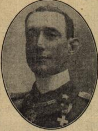
Prinz Luigi, Herzog der Abruzzen, Bruder des Herzogs von Roßa, erhielt eine hohe Kommandostelle in der italienischen Marine.