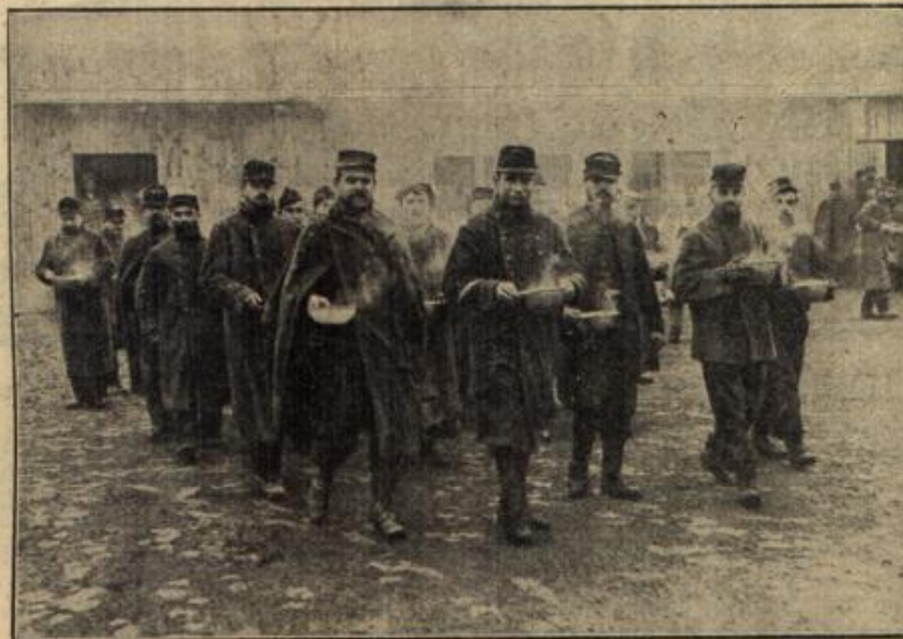
Eisenholen im Jossener Gefangenenlager. (Mit Text.)

„Jambo, ich will einen Morgenritt unternehmen. Meine Gattin schläft noch, in einer halben Stunde bin ich zurück.“