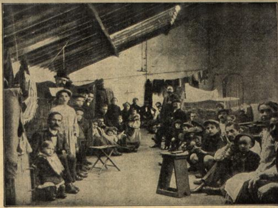
Das deutsch-österreichische Zivilgefangenenlager in Perigueux, Frankreich. (Mit Text.)

Bereits das Gemach verlassen. May lächelte. Aus Deutschland, Gott sei Dank, ihrem Gatten ist nichts zugekommen, und May's Züge verklärten sich, der starre Ausdruck ist verschwunden.