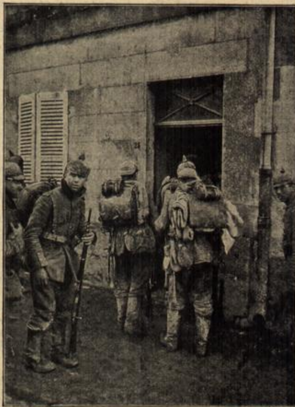
Rückkehr aus den Schützengräben an der Mäne. (Mit Text.)

„Nun Eveline, gefällt es dir nicht, du bist so schweigsam?“ „Vater, Vater“, sagte sie nur. „Ich kann nicht Worte finden“