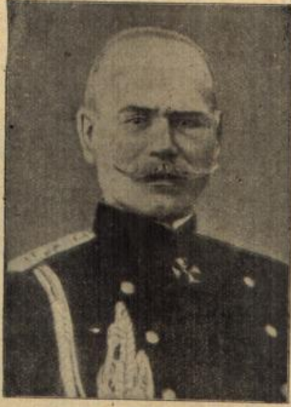
General Aleksejew, der neue russische Generalfeldmarschall unter dem Zaren

„Bitte!“ — Sie hastete schon an ihm vorüber, ehe er, wie beabsichtigt, ihre Hand ergreifen konnte. Draußen spiegelten sich schon wieder die bunten Lichter in dem schwarzen Wasser des Hasenbeckens: ein paar Sterne flackerten durch das Gewölk und