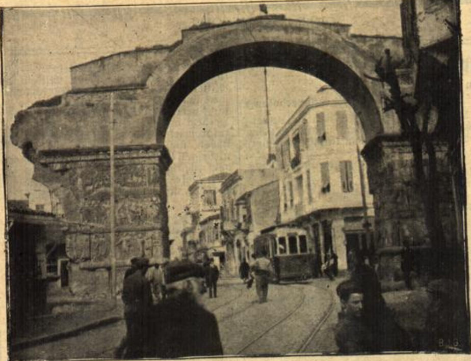
Straßenbild aus Saloniki.

Herbert blickte auf sein Weib. Wie stolz, wie unnahbar sie vor ihm steht. Wie kalt und fremd, die samtnen brau- nen Augen blicken, die ihm noch vor kurzem in warmer, verheißungs- voller Liebe geleuchtet! Sein Stolz, sein männ- liches Ehrgefühl häumt sich gegen Mariannes Vorschlag auf, aber er zwingt es nieder. Sie allein ist ja die Be- leidigte, sie allein hat ein Recht, die Sühne zu bestimmen. Er preßt die Zähne so heftig in die Unterlippe, daß ein war- mer roter Tropfen her- vorquillt.