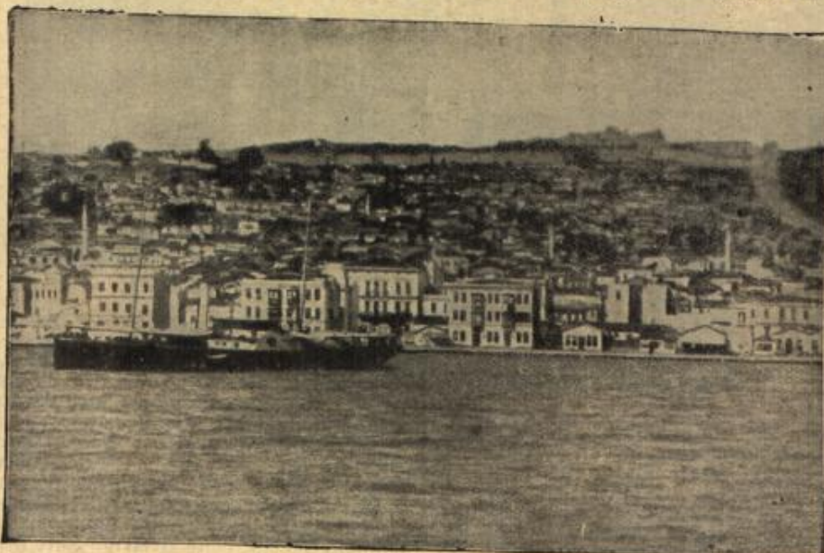
Der Hafen von Saloniki.

„Ich brauche dein Mitleid nicht, Herbert. Die Schuld, die dir aufgebürdet, kann durch nichts ausgelöscht werden. In meinem heiligsten und edelsten Gefühlen hast du mich beleidigt, hast das Vertrauen, das ich dir willenlos gegeben, schändlich mißbraucht. Eine Kluft gähnt zwischen uns, so tief und groß; — sie wird sich niemals überbrücken lassen. Wir werden nebeneinander leben