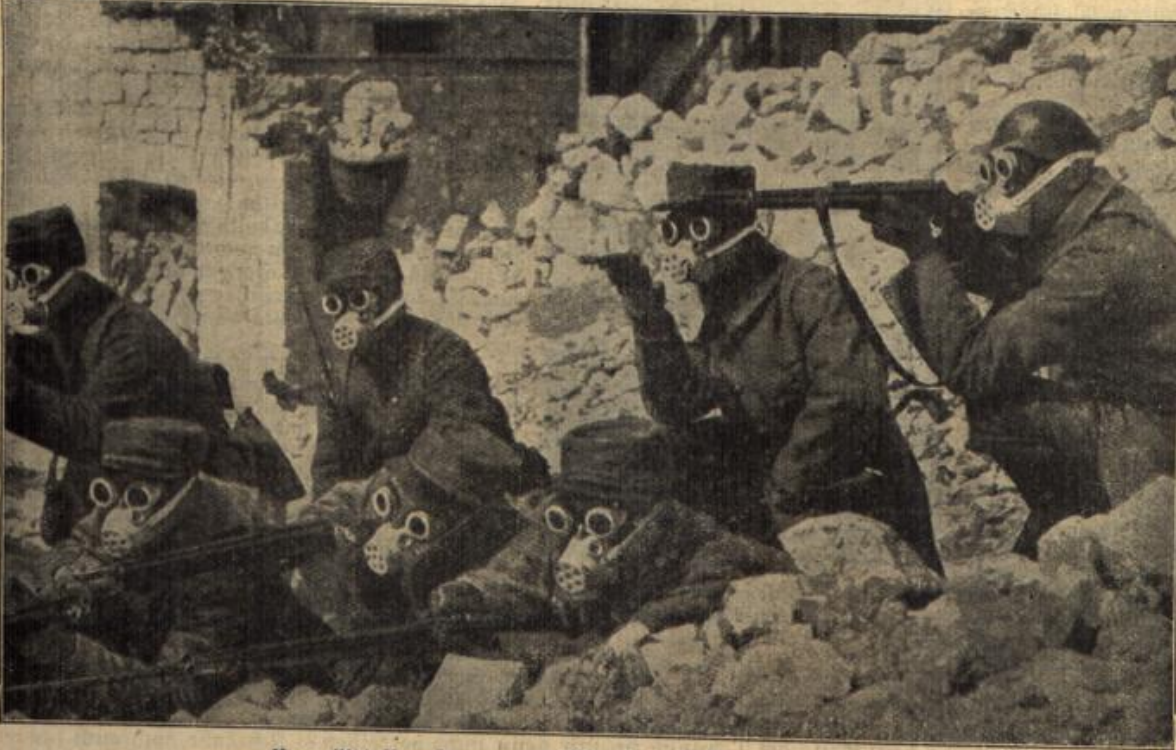
Neue Metallmasken gegen giftige Gase im französischen Heere.

Auflösung des Räfels in voriger Nummer. Grille.