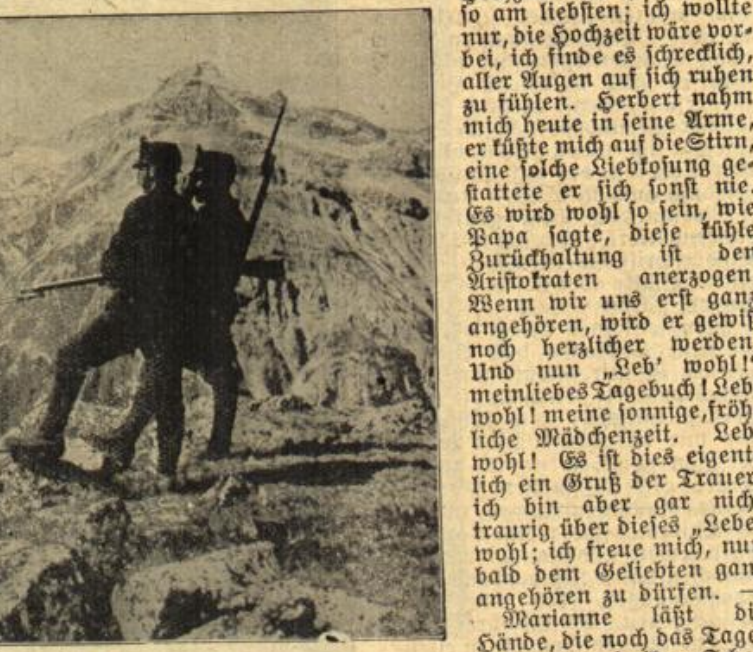
Schweizer Grenzwacht. Beobachtungspost an der Südgrenze.

Manianne läßt die Hände, die noch das Tagebuch halten, in ihren Schoß sinken, ein weiches, wehmütiges Licht schimmert in ihren Augen. Aber langsam nehmen ihre Züge einen harten, strengen Ausdruck an, die goldenen Funken, verschwinden aus den braunen Augensternen, düster werden sie, fast schwarz. Zum Wille der Mutter blickt sie empor, das über ihrem Schreibtisch hängt. Auch diese edle Dulderin hat still und klaglos gelitten, freilich auf ganz andere Art. Sie litt um die verlassene Heimat, um der Liebe willen, die ihr ihr Herz verschlossen hatten. Auch sie hatte in dem Gatten nicht das Ideal gefunden, das sie gesucht, seine Liebe, seine Treue aber hatte ihr unabwendbar gehört.