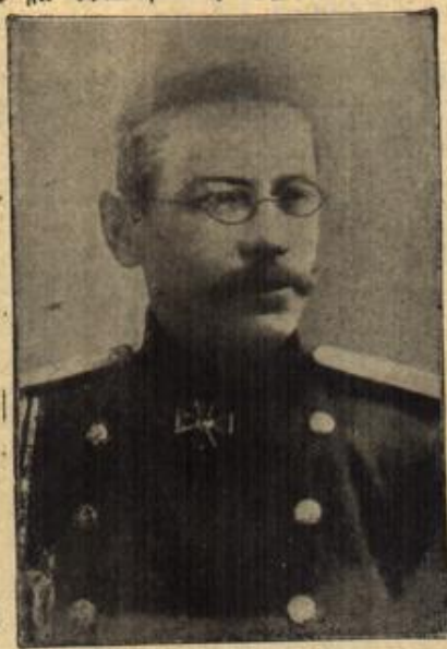
General Rukh, der wiederberufene Oberbefehlshaber der russischen Nord-Armeen.

Das junge Mädchen senkte auf und strich sich eine widerpenstige Haarlocke aus der Stirn. Was ging sie schließlich Gerd Paetow und sein ferneres Schicksal an? Hatte er sich damals darum gekümmert, was aus ihr wurde? Ihre Frauen zogen sich zusammen; aber als im nächsten Augenblick die kleine Toni aus der Küche kam und sich wie schuchselnd an sie schmiegte, konnte sie schon wieder lächeln und fand ein freundliches Wort für Gerd