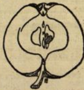
Casseler Reinette (verkleinert).

Die „Casseler Reinette“ hat eine breitrunde, nach dem Kelch sich verjüngende Form, einen langblättrigen, fast geschlossenen Kelch in tiefer Höhle. Der holzige, lange Stiel sitzt in rostfarbiger Senkung. Die reife Frucht ist gelb, sonnenseitig rot gestreift in abgelesenen Linien, dazwischen sind feine Punkte verstreut. Die Sorte ist zeitig tragbar und liefert reichliche Erträge als Hochstamm gezogen. Die Reife beginnt im Februar und hält sich die Frucht bis in den Juni. Sie ist des würzigen edlen Geschmacks wegen dann sehr gesucht und wird gut bezahlt.