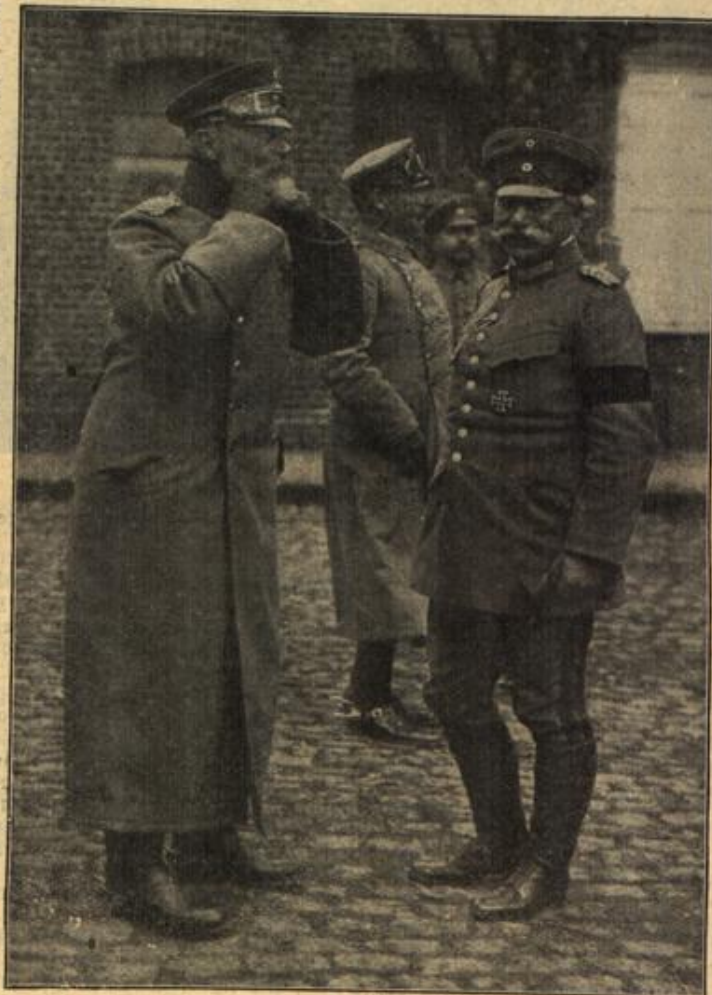
Generalfeldmarschall Prinz Leopold von Bayern, der Croisettes von Warschau.

Sie dachte nicht daran, ihm diese Fürsorge zu danken.