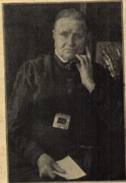
Die letzte Marktedererin.

Am Oster Sonntag wohnten wir dem vom Franziskanerbischof Meic gelebrierten Hochamte bei. Aus nah und fern waren die katholischen Herzegowiner und winerinnen im Sonntagsstaat herbeigeekilt. Keine Tracht in Deutschlands Gauen kann sich mit dieser Pracht messen. Die herzegowinische Bevölkerung ist ein kräftiger, hochgewachsener Menschenschlag, ihre Frauen und Mädchen sind auch im Gesichte von allen Frauen Dalmatiens und Montenegros, die wir sahen, die schönsten. Weiß ist der Grundton ihrer Kleidung. Sie tragen weite weiße Hosen, weiße Mäntel, über den Schoß hängt eine Art Soutane herab. Frische Gretchentüren umrahmen so manchen hübschen Kopf, der mit vergoldeten Spangen geschmückt ist, an denen Münzen und Medaillons baumeln. Vom Kopf bis zu den Hüften herab rüdwärts herab hängt ein langwallender, bläulich weiß schimmernder Schleier. Wie eine Art Brünne wirken die gold- und silberdurchsetzten Wiederstände an beiden Seiten der Brust. Dazu kommen noch Kreuzhänge, Medaillen auf der Brust, zwei- und dreifach ineinanderhängende Ohrringe, Blüten und Blumen in den Haaren, auf der Brust, an der Taille. Die Männer haben ihren roten Fez auf dem Kopfe, blaue Pumphosen, weiße Ärmel, graue oder schwarze halbgeöffnete Kittel. Diese Männer- und Frauentrachten denke man sich vom hellsten Sonnenschein übergossen auf dem Kirchplatz oder enganeinander kniend in der Kirche. Ihre Haltung während des Hochamtes war andachtsvoll.