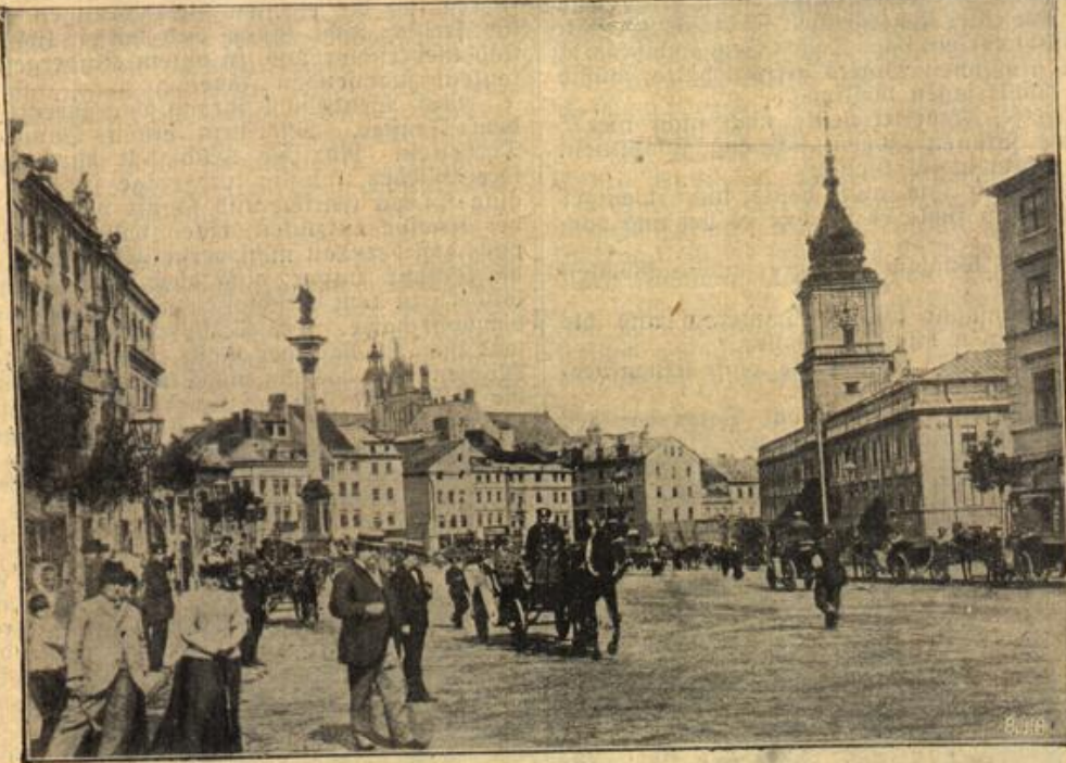
Zur Einnahme Warschans.

„Ach, laß mich doch, immer verdirbst du mir die Freude.“