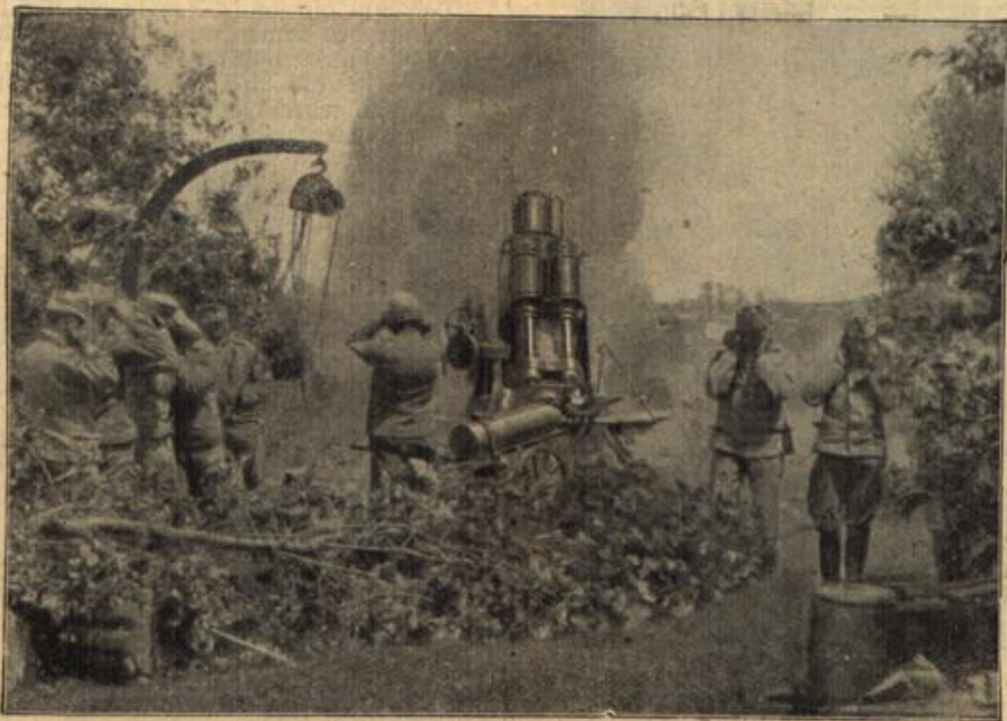
Die Artillerie unserer Verbündeten. Oesterreichische 30,5 Mörser im Feuer

Nachdruck aus dem Inhalt dieses Blattes verboten. (Gesetz vom 19. Juni 1901.) Verantwortl. Redakteur: E. Kellen, Bredeneß (Mühlr.). Gedruckt u. herausgegeben von Fredebeul & Koenen, Ess'n (Mühlr.).