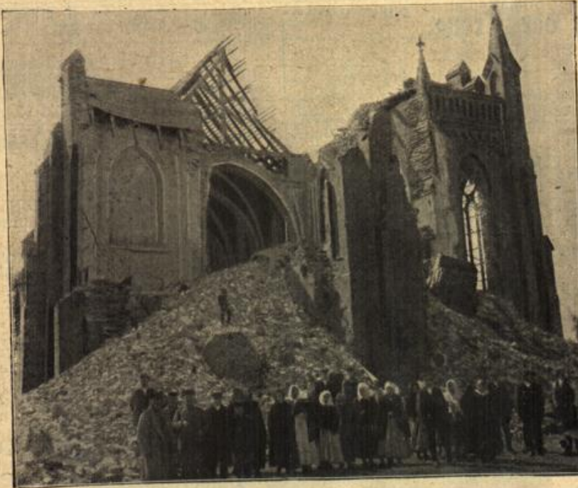
Das Vernichtungswerk des Krieges. Die Kirche von Rurowice in Russisch-Polen nach der Beschießung des Ortes.

Er sah weiter, wie dünn und abgetragen ihr Kleid, war. Ein großer Jammer packte ihn da an. Ihre feinen schlanken Finger