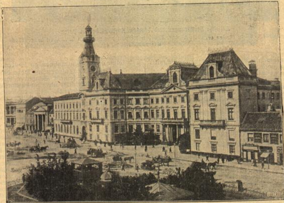
Das Rathaus von Warschau im Mittelpunkte der Stadt.

Strassenbild von Warschau (rechts das königl. Schloß)