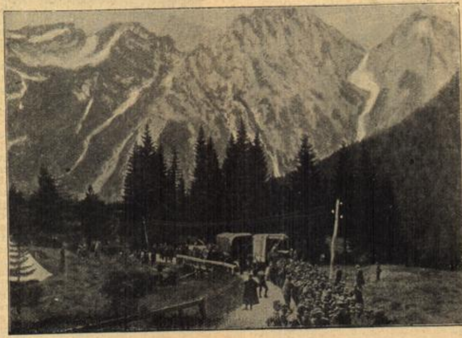
Zu den Kämpfen in Tirol. Italiensche Trainkolonne in den Dolomiten.

Erschrocken hätte der Posten beinahe sein Gewehr fallen lassen, aber er faßte sich schnell, erinnerte sich seiner Soldatenpflicht und drückte den Sohn in den linken und das Gewehr in den rechten Arm und konnte vor Freude nicht reden.