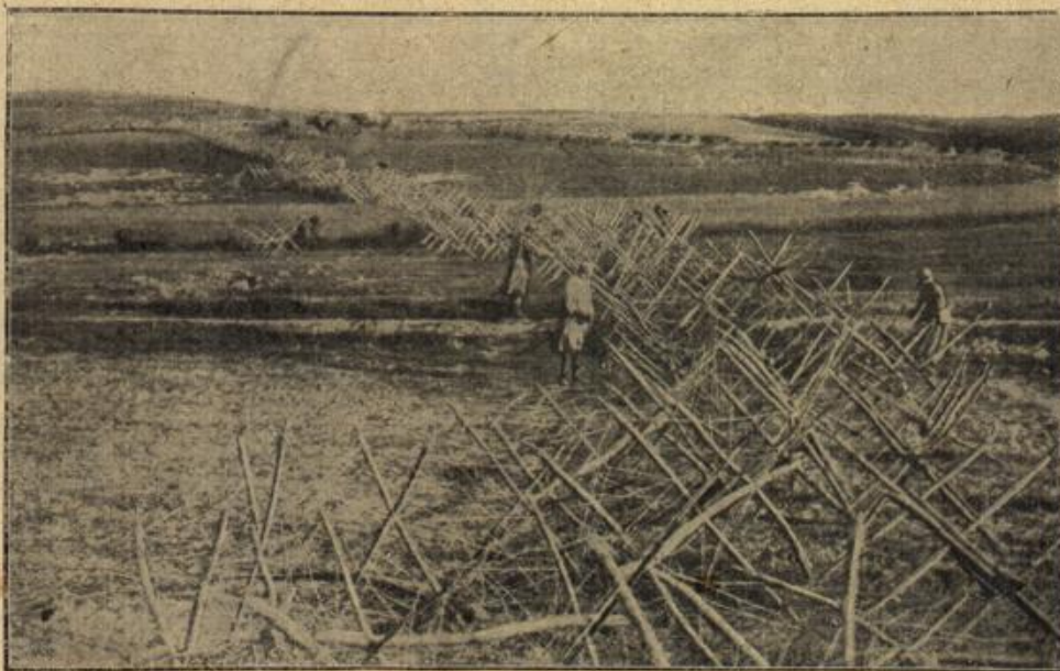
Russische Drahtverhaue in Galizien,

„Herr Kandidat“, rief Streumeier fast hitzig, „was hätte mein Zorn mit diesem äußerst interessanten Fall zu tun, und was hat die Wissenschaft im Allgemeinen mit allen Gefühlen der Welt! Sagen Sie ohne Umschweife, was zu sagen ist!“