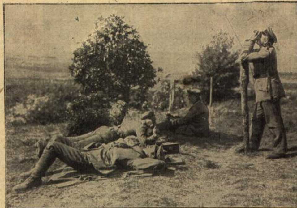
Fliegerbeobachtungsposten bei den d. uischnen Stellungen vor Verdun. Dieser Posten hat die Aufgabe, die Wirkung der Beschützung französischer Flugzeuge festzustellen und mittels eines transportablen Feldtelephons an die Batterie weiterzugeben.

Streumeier sank völlig sprach- und kraftlos auf seinen Sitz. „Ja, ja, Sie haben recht“, seufzte er nach einer Weile der Sammlung, „es ist nicht leicht mitunter, eine geschickte Antwort zu geben auf ein dumme Frage. Kommen Sie mit in die Gaststube, Schnibbe, ich muß etwas Stärkendes haben.“