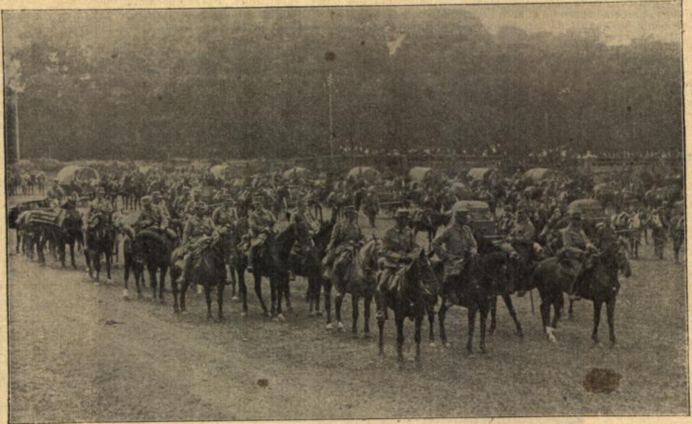
Gebirgsartillerie vor dem Ausbruch.