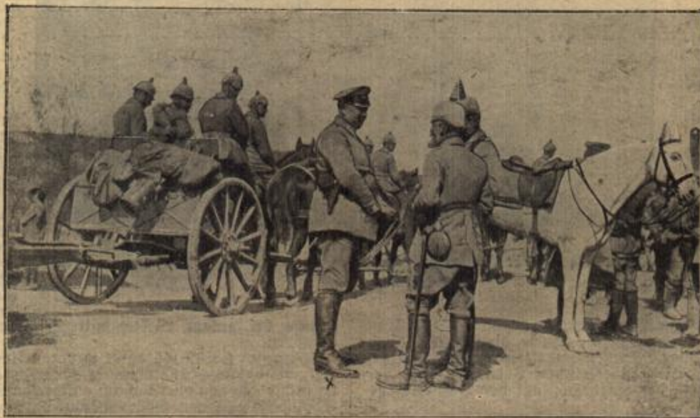
Prinz Eitel Friedrich von Preußen auf dem östlichen Kriegsschauplatz.