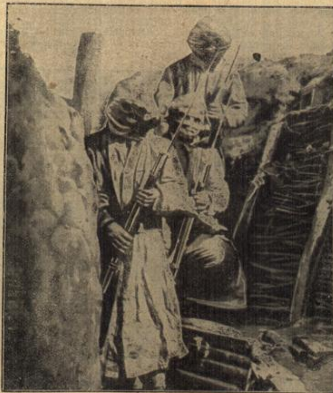
Franszösische Truppen mit den neuen Schutzmasken bei Kämpfen mit Gasbomben.

„Gut, also auf Ihren ausdrücklichen Wunsch werde ich's unterlassen. Halten Sie es denn durch? Lassen Sie keinem merken, wie es tut. Auf Wiedersehen, Viberstein!“