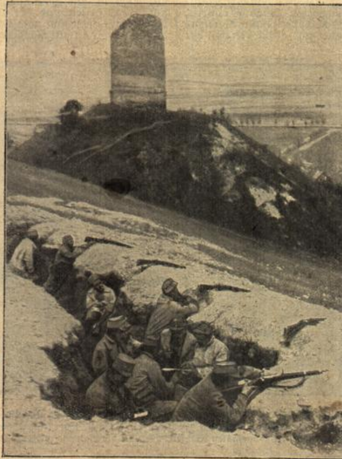
Österreichisch-ungarische Infanterie in Dedung

deutung zu; seine Hörbarkeit beeinflusst Feldherrn und Unterführer in ihren Schlüssen und Entschlüssen — allein seine Wahrnehmbarkeit kann durch Einflüsse geographischer und meteorologischer Natur bis zur völligen Unterdrückung unterbunden werden, obwohl oft nur verhältnismäßig geringe Entfernungen (bis zu dreißig, vierzig Kilometer) in Betracht kommen; demnach ist mit Bestimmtheit auf das Hörbarwerden des Geschützfeuers an allen Orten und zu jeder Zeit nicht zu rechnen.“ Es sind also recht wichtige Beobachtungen, zu denen der Mörserdonner von Antwerpen Anlaß ge-