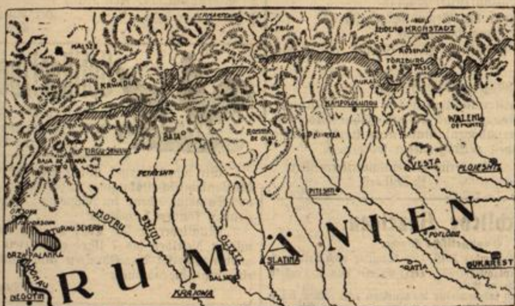
Die österreichisch-rumänische Grenze

Bad. Ein stärkendes Bad erhält man, wenn man dem Wasser Ammoniak zusetzt, und zwar für je einen Liter Wasser etwa 30 Gramm Ammoniak. Dieser Zusatz belebt und kräftigt den ermatteten Körper außerordentlich und macht die Haut dazu noch weiß, geschmeidig und zudem noch geruchlos.