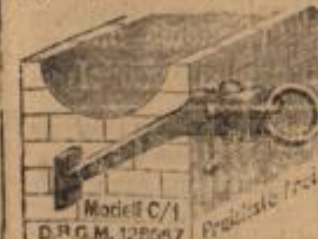
Modell C/1 D.P.G.M. 128097

Erkennt: Dienstag, Sonntag und Samstag Abonnementpreis vierteljährlich 1 Mk. inkl. Bringerlohn Durch die Post sagen vierteljährlich 1 Mk. inkl. Bef geld.