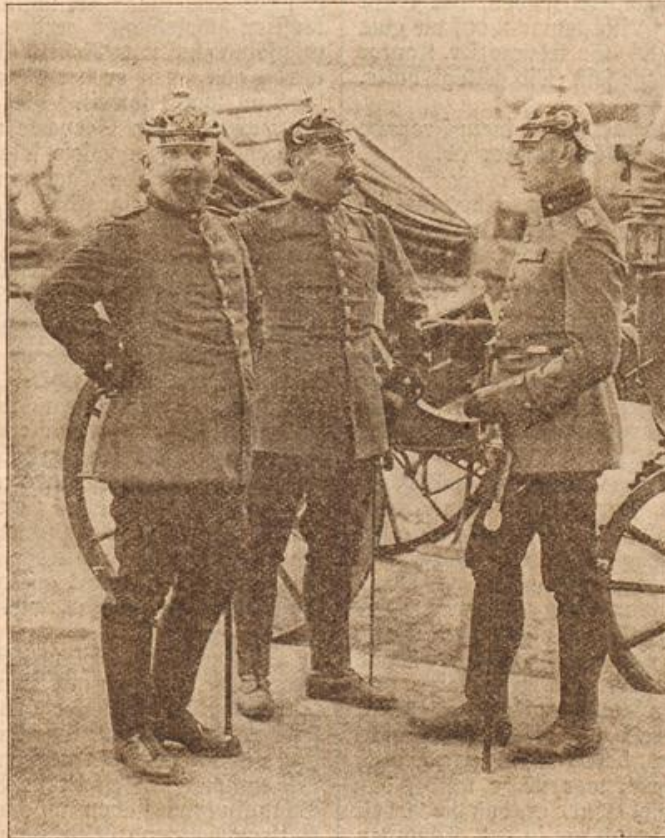
Die deutsche Feldpost: Höhere Postbeamte in Felduniform.

als er den so schwer bepackten jungen Mann herankommen sah. „Na, wie geht's denn nun, mein Jungchen? Hast du auch immer gut zu tun?“ fragte Tantchen besorgt, als der Wagen sich endlich schwerfällig fortbewegte.