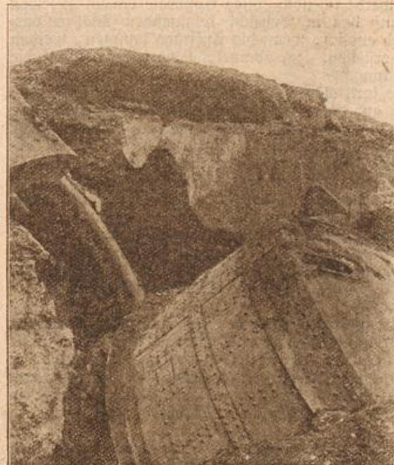
Die Wirkung der deutschen Belagerungsgeschütze an den Forts von Lüttich. (Mit Text.)