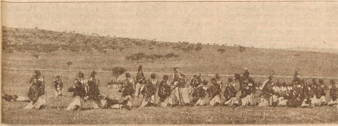
Aus dem französischen Heer: Algerische Tirailleure (Zurtos). (Mit Text.)

„Gott, man quält sich eben redlich,“ meinte er etwas kleinlaut, „leicht gemacht wird es einem nicht, das kannst du glauben.“