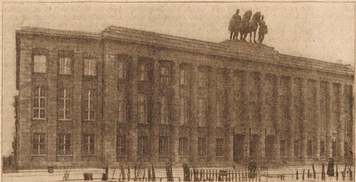
Das deutsche Gesandtschaftsgebäude in Petersburg. (Mit Text.)