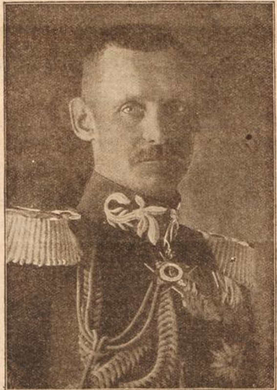
Generaloberst und Generalinspekteur Kronprinz Rupprecht von Bayern.

Aber da kam er schön an. „Was, jetzt willst du fort? Jetzt mich allein lassen? Nein, das dulde ich nicht!“ rief sie.