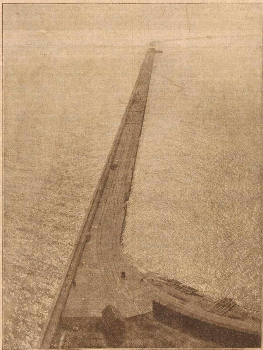
Der Ariegehasen von Dover, einer der Hauptstützpunkte der englischen Flotte. (Mit Text.)

Eines Tages fehlte der Schlüssel zum Nähtisch. Die Köchin hatte Nadel und Faden gebraucht. Endlich nach langem Suchen wurde er im Hofe gefunden, über und über vom Mist bedeckt und unbrauchbar. Er mußte an dieser Stelle mindestens zwei Wochen liegen.