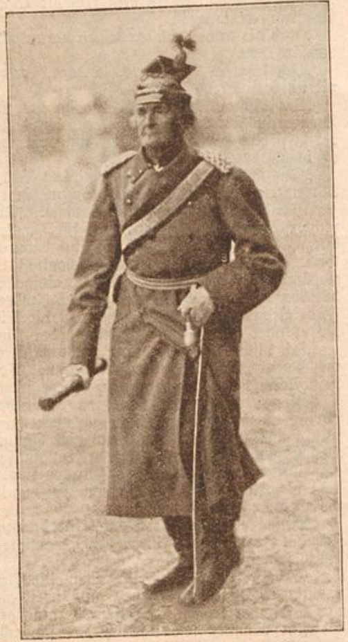
Generalfeldmarschall Graf von Häseler. (Mit Text.)