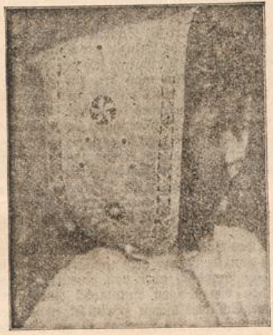
Kinderhäubchen mit Weißstickerei.

Häubchen links überwiegt die Plattstickerei, bei dem anderen die Verzierung mit „Sols“, die übrigens auch durch Häfel-, Strid- oder Klöppelmotive ersetzt werden können. Farbige Seidenband, das durch schmalen Klöppeleinsatz oder in den Stoff gearbeitete Stege geleitet wird, pußt die Häubchen noch besonders nett aus und ermöglicht es, sich mit jedem Kleidchen passend zusammenzustimmen.