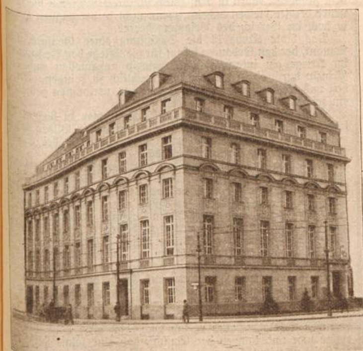
Das Vereinshaus deutscher Ingenieure in Berlin. (Mit Text.)

händen ihrer Friseurin zubringt; wäre diese Stunde nicht besser angebracht, wenn sie sich ihren Kindern widmete?"