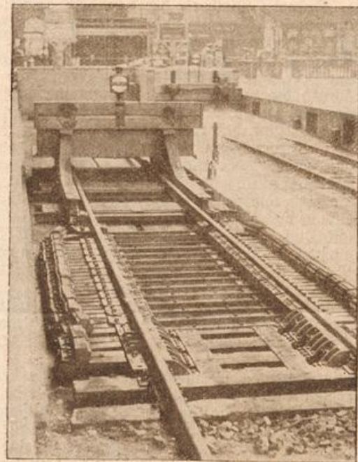
Ein neuer Bremspressblock mit Schlepprost auf dem Sietliner Bahnhof in Berlin.