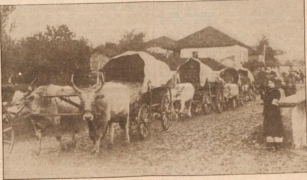
Serbische Proviantkolonne auf dem Marsch. (Mit Text.)

Am Ende des Jagdzugs ritten zwei junge Leute, die sich zusammengefunden hatten — ganz unmerklich und ohne Abicht, schien es den andern. Es war Irngard, des Burgherrn junge, schöne Tochter, und der Herr Diether von Melsheim, der mit seinem langen blonden Haar und in seinem rot und grün geteilten Gewande recht schmunzelnd ausah; an der Seite trug er Schwert und Dolch, auf dem Rücken die Armbrust. Aus seinen Augen lachte die Freude, Freude über den schönen Sonntag, über den frohen Ritt und ganz besonders über die junge Maid, die zu seiner Rechten ritt und mit der er freundliche Blicke und gefällige Reden wechselte.