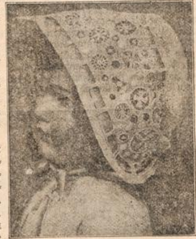
Kinderhäubchen mit Weißstickerei und „Sol“-verzierung.

über einem Kissen oder auf der Ornamentenspindel in unzähligen Variationen herzustellen sind, ist augenblicklich sehr beliebt und stets von reicher und aparter Wirkung. Die einfache Form der Häubchen, die ein schnelles Waschen und bequemes Plätten ermöglicht, ist aus den Abbildungen deutlich zu ersehen, ebenso das Muster für den Stickereischmud. Bei dem