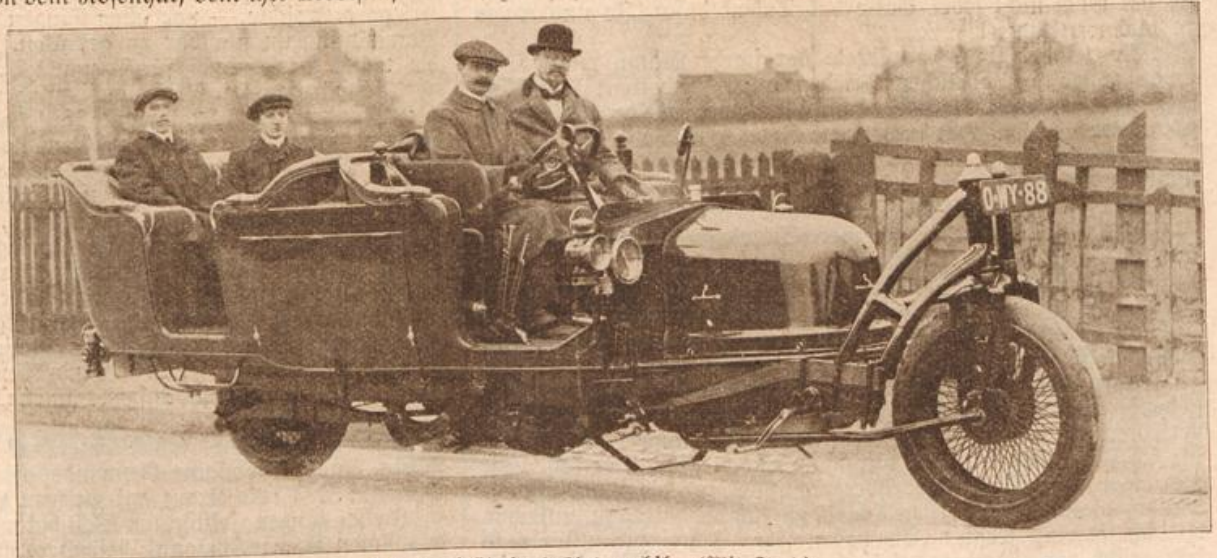
Ein zweirädriges Automobil. (Mit Text.)

legen sich die Kinder in ihre Spieledecken bis zur Nachtmahlzeit.“