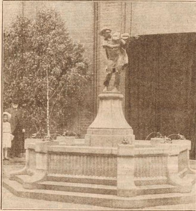
Der Fließabrunnen in Thorn. (Mit Text.)

„Leider!“ sagte Frau Baldow; „ich finde bei meinen Schwiegertöchtern kein Eingehen auf meine Wünsche und möchte ihnen doch so gern mit meiner Lebenserfahrung nützen! Eben war ich im Begriffe, deiner Frau zu schreiben, aber wie immer ich die Worte gewählt hätte, sie würde eine Beleidigung herausgeföhlt haben, und so unterließ ich es.“