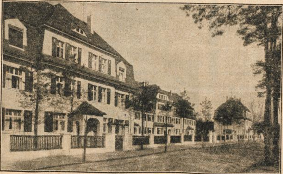
Die neuen Eisenbahnbeamtenhäuser in Coswig in Sachsen. (Mit Text.)

„Sieh da, wie gut Sie Bescheid wissen in dergleichen!“ Er lächelte, halb spöttisch, halb belustigt. „Paßt es Ihnen, wenn ich