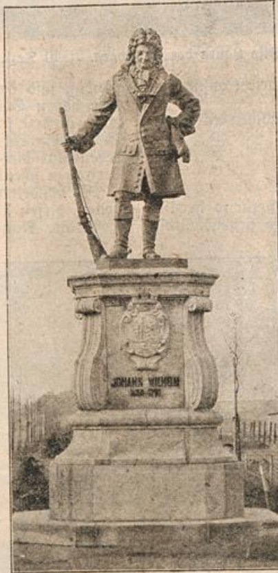
Das Johann-Wilhelm-Denkmal in Mül-heim am Rhein. (Mit Text.)

„Was meinst du zu Onkel Delbrück?“ begann die Jüngere schüchtern.