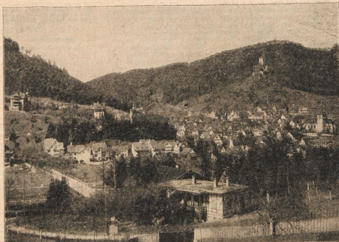
Liebenzell im württembergischen Schwarzwald. (Mit Text.)