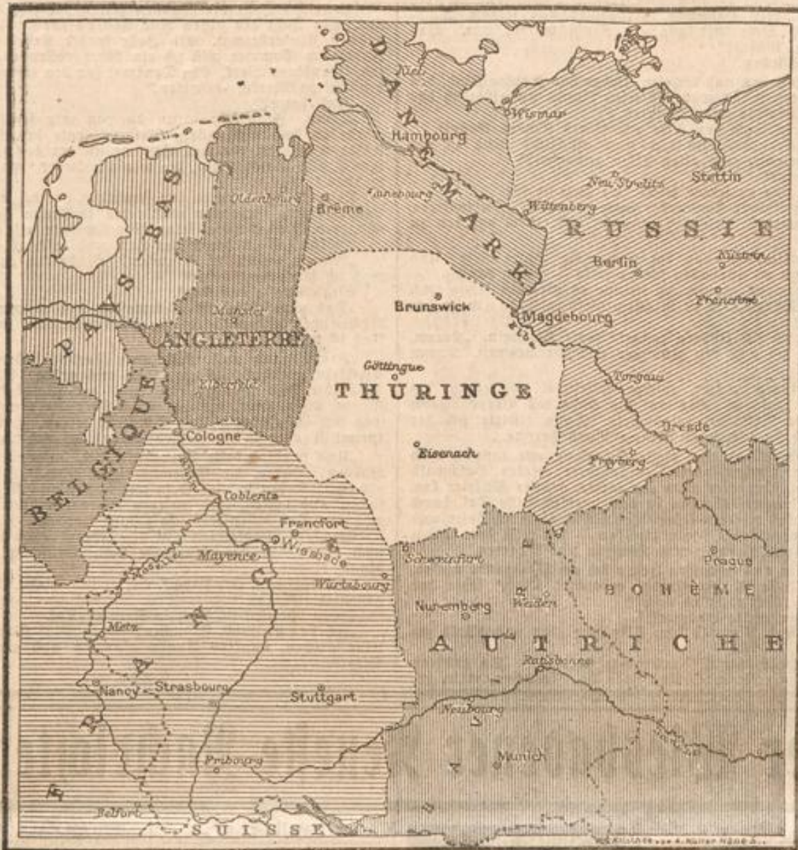
PUBLICATIONS ARTISTIQUES 6, Rue Gible-Coeur, 6-PARIS.

ten, daß der Gegner nicht sofort kampfunfähig werde. Vorher schon hatten englische Truppen in Indien die Spitze ihrer Mantelgeschosse abgefeilt, damit das Blei gutage trat. Die furchtbare Wirkung veranlaßte die Engländer, das gräßliche Geschos gleich fabrikmäßig herzustellen. Im Burenkriege haben die Engländer die Dum-Dum-Geschosse, deren entsetzliche Wirkung an dem abgebildeten Burenshädel zu erkennen ist, ebenfalls benutzt. Die hier wiedergegebenen Abbildungen sind nach photographischen Aufnahmen angefertigt, die der Große Generalstab von den den Gefangenen abgenommenen und sonst erbeuteten Geschossen hat anfertigen lassen. Es befindet sich dabei auch ein noch verschärftes Paket von 1914. Die Ausrede der Franzosen, daß es sich um uralte Versuchskartnadel handle, die vielleicht unabsichtlich aus einer Kumpelkammer in die Hände von Soldaten gefallen seien, sind damit als frecher Schwindel erwiesen.