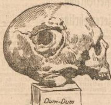
Schusswirkung des gewöhnlichen Militärgewehres und des englischen Dum-Dum-Geschosses.

Nach einer photographischen Aufnahme aus dem Burenkrieg.