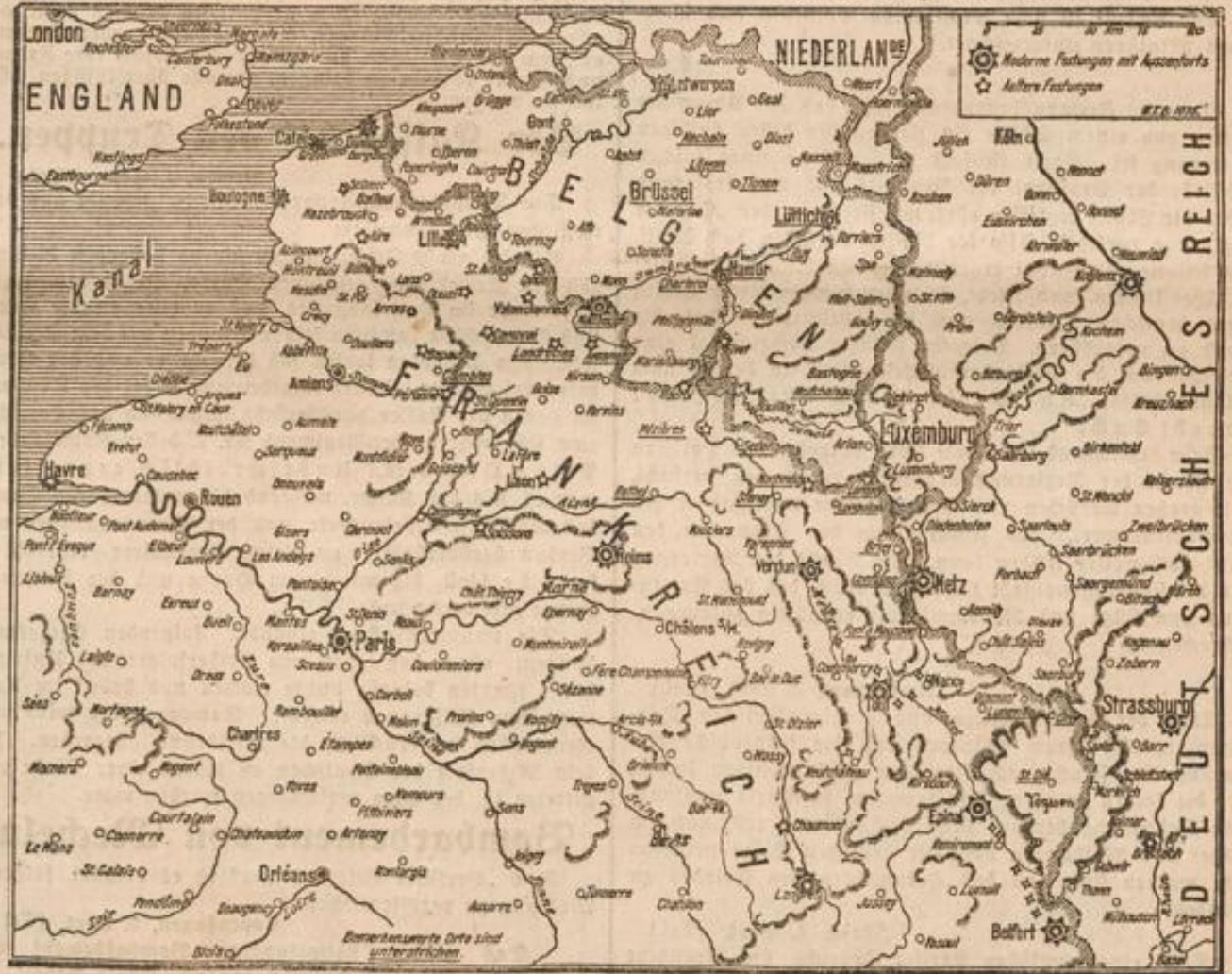
Schauplatz der neuen Kämpfe im nordöstlichen Frankreich.