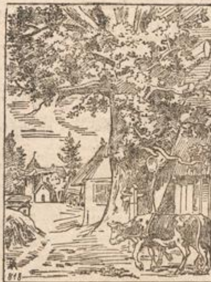
Wo ist das Bäuerlein?