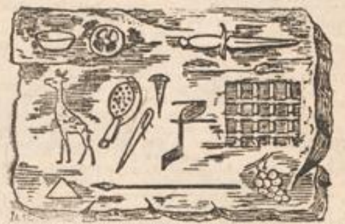
(Von jedem Bild gibt der Anfangsbuchstabe. Die Vokale sind zu ergänzen.)