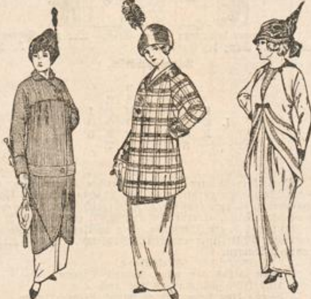
Modell Nr. 19 118. Modell Nr. 19 121. Modell Nr. 19 115.

Auschnittes die Vorderteile lose zusammenhält. Der unten enge Niederrock wird durch eine stark geschweifte kurze Tunika vervollständigt, die hinten von einer Quetschfalte überschritten, seitlich absteht und wie die Jacke mit dunkelgrauer Tresse garniert ist. Andere Jackchen mit Kimonoärmeln haben zwischen den Vorderteilen ein kurzes Westchen aus römisch schreiftter, gemusterter oder gestricelter farbiger Seide. Der regelrechten Boleroform ist dann der kurze Serpentinrock angelegt, der seine Ergänzung in der gleichfalls serpentinartigen Tunika des Rockes findet. Diese Bolerokostüme zählen zu den markantesten Typen der heutigen Frühjahrsmode. Ob die Baby- oder Kragenjackets