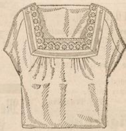
Damen-Taghemd aus pa. Qualitäts-Cretonne mit sehr schöner Stickerei, Stück M. 1.30