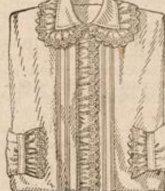
Damen-Jacke aus Finette, elegante Verarbeitung mit Stickerei Stück M. 2.35