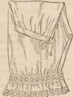
Damen-Beinkleid aus bestem Cretonne mit prachtvollem Durchsatz Stück M. 1.80