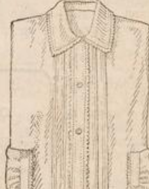
Damen-Jacke aus gutem Finette mit Feston Stück M. 1.50