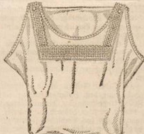
Damen-Taghemd elegantes Fantasiehemd Stück M. 1.50