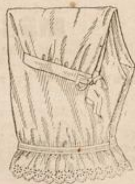
Damen-Beinkleid aus Cretonne mit schöner Stickerei Stück M. 1.35