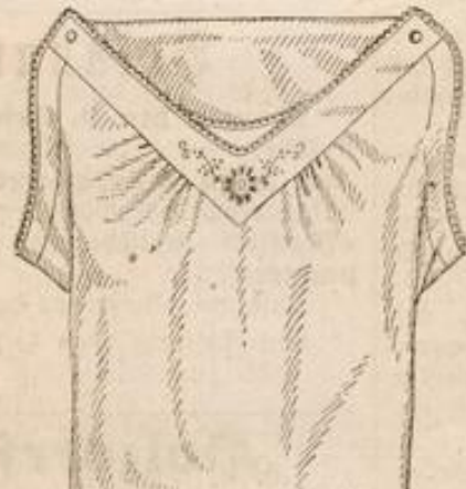
Damen-Taghemd aus Cretonne, kräft. Ware m. Madeira-Stickerei, Stück M. 1.50