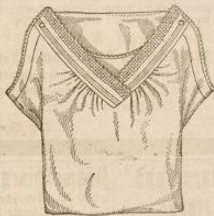
Damen-Taghemd aus Cretonne mit schräger Passe u. Stickerei . . . Stück M. 1.15

biete ich eine unerreichte Auswahl zu konkurrenzlos billigen Preisen .