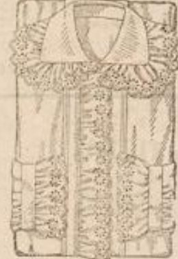
Damen-Nachthemd allerbeste Qualität Cretonne, sehr elegante Ausführung mit Sticker, Stück M. 4.50