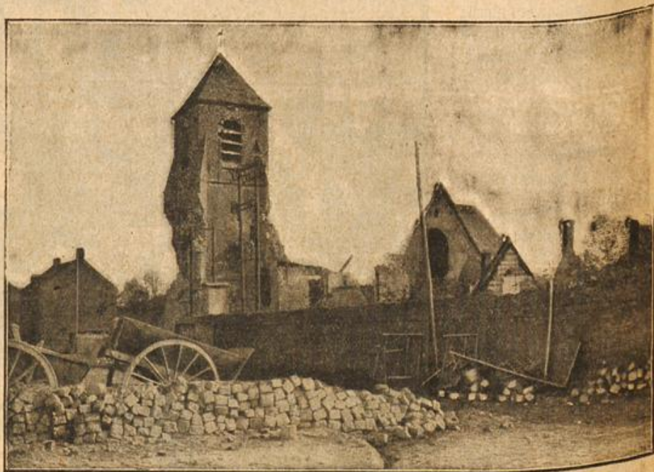
Die zerstörte Kirche von St. Laurent.

Eine weiße Mädchenhand glitt ohne Bedauern über den kurzgeschorenen Kopf . . . „Mein Haar? . . . Ich habe es soeben für 2 Taler verkauft . . . Die Not ist doch im Lande groß. Wir müssen alle unser Bestes geben.“