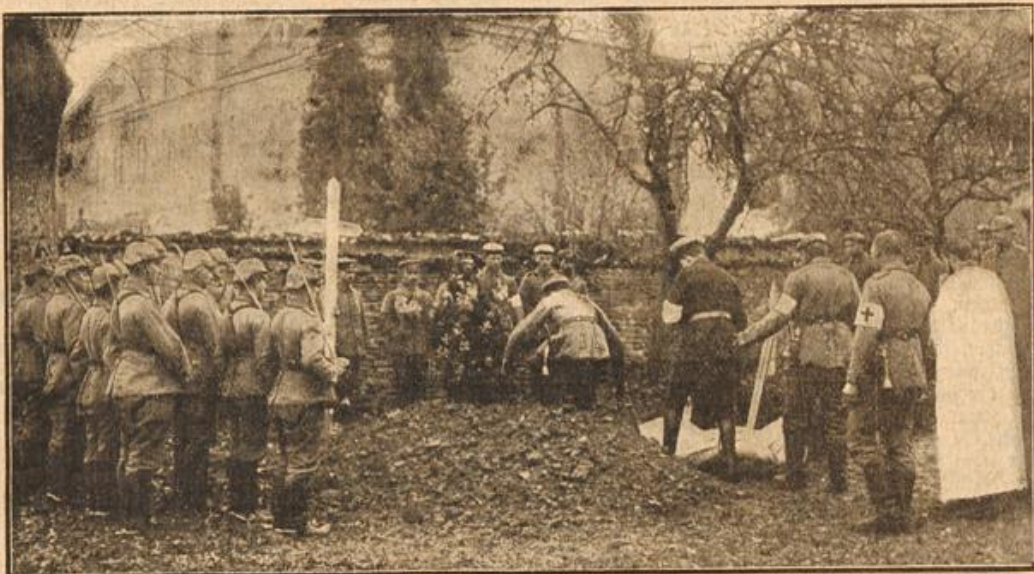
Soldatenbegräbnis in Feindesland.

. . . Ein Ehrengruß für die, welche in letzter Stunde nun auch dem Ruf ihres Königs gefolgt war!