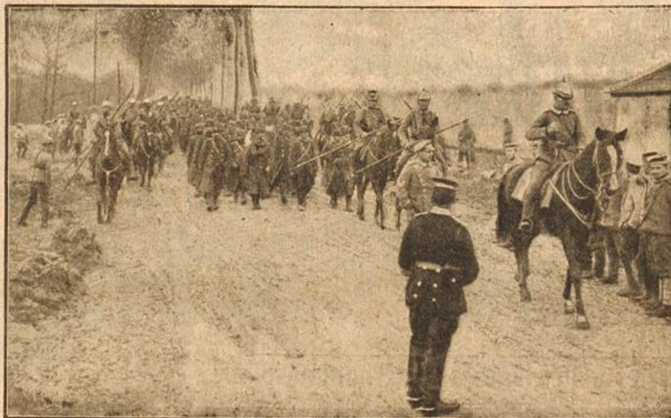
Gefangene Franzosen werden durch bayerische Reiter abgeführt.

„Wir verstehen uns nicht,“ sagte Fernando kalt. — „Gut . . . also . . . so warte mit dem Abschied, bis man dich dazu zwingt. Ich gehe jetzt.“ — „Und wohin gehst du?“ — „Ich muß meinem Verlobten entgegen. Die beiden Knechte gehen mit mir.“