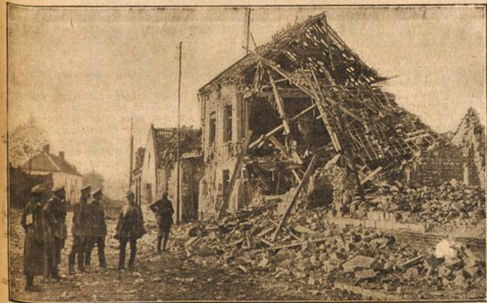
Die Wirkung eines Minenwurfes.

Unser Bild zeigt die feierliche Beerdigung eines deutschen Soldaten in Saint Benoit. Die Kameraden haben aus Kistenbedeln ein einfaches Holzkreuz geschnitten und Strauße und Kränze von Feldblumen ans Grab gebracht.