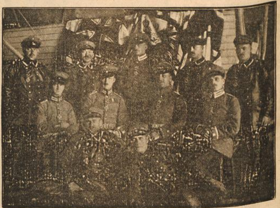
Die Besatzung eines Zeppelins mit dem Eisernen Kreuz geschmückt.

Die Besatzung eines unserer Zeppelin-Kreuzer, der im Osten erfolgreich tätig sein konnte, wurde vom Kaiser mit dem Eisernen Kreuz zweiter Klasse ausgezeichnet. Man sieht hier die mit diesem Ehrenzeichen geschmückte Mannschaft, Offiziere und Soldaten in dem Gruppenbild vereint.