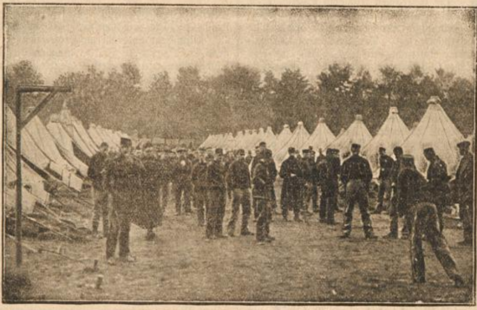
Die gefangenen Belgier in Holland. Großes Zeltlager in Holland, worin fast 20000 entwaffnete belgische Soldaten gefangen und untergebracht sind.