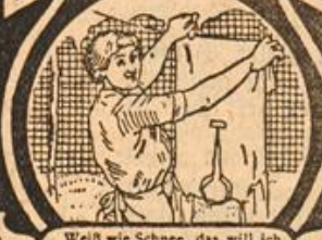
Weiß wie Schnee, das will ich meinen, bleiche 'Seifix' mir das Leinen.

für die Wäsche ist Dr. Thompsons Seifenpulver (Marke Schwan), da es frei ist von Chlor, Wasserglas und sonstigen scharfen Bestandteilen und nur aus den besten Rohstoffen hergestellt wird. In Verbindung mit dem modernen Wäschebleichmittel Seifix ersetzt es die Rasenbleiche vollkommen.