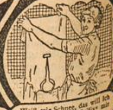
Weiß wie Schnee, das will ich meinen, bleiche 'Seifix' mir das Leinen.