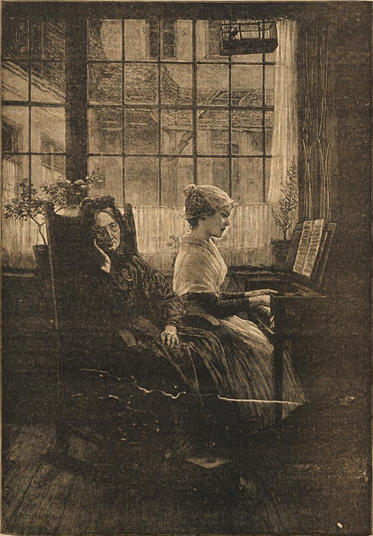
Die Musik als Trösterin. Nach dem Gemälde von W. J. G. J.