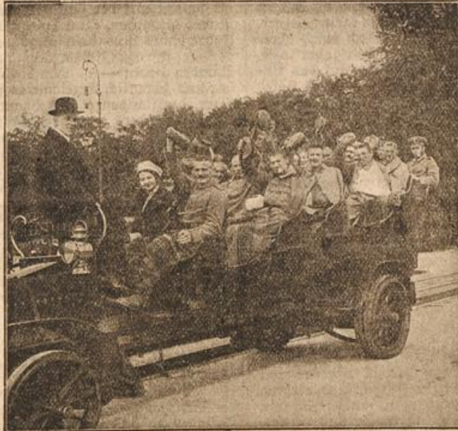
Spazierfahrt unserer Verwundeten durch Berlin.

Ist schon im Manöver der Marktender eine gern gesehene Persönlichkeit, wie viel mehr aber erst in Kriegszeiten. Tagelang von Kommissbrot und Konservensuppen gelebt, sehnt sich der Wagen nach etwas solidem, und da wird das Eintreffen des Marktenders von den Truppen mit Jubel begrüßt. Sind die Preise für Wurst, Speck und besonders Schmalz auch etwas sehr hoch, ist die Ware manchmal auch nicht erster Qualität, ein hungriger bayrischer Soldatenmagen fragt nicht danach und im Handumdrehen ist der Wagen geräumt. Nun kann es neugestärkt und mit frischem Mut wieder an den Feind gehen.