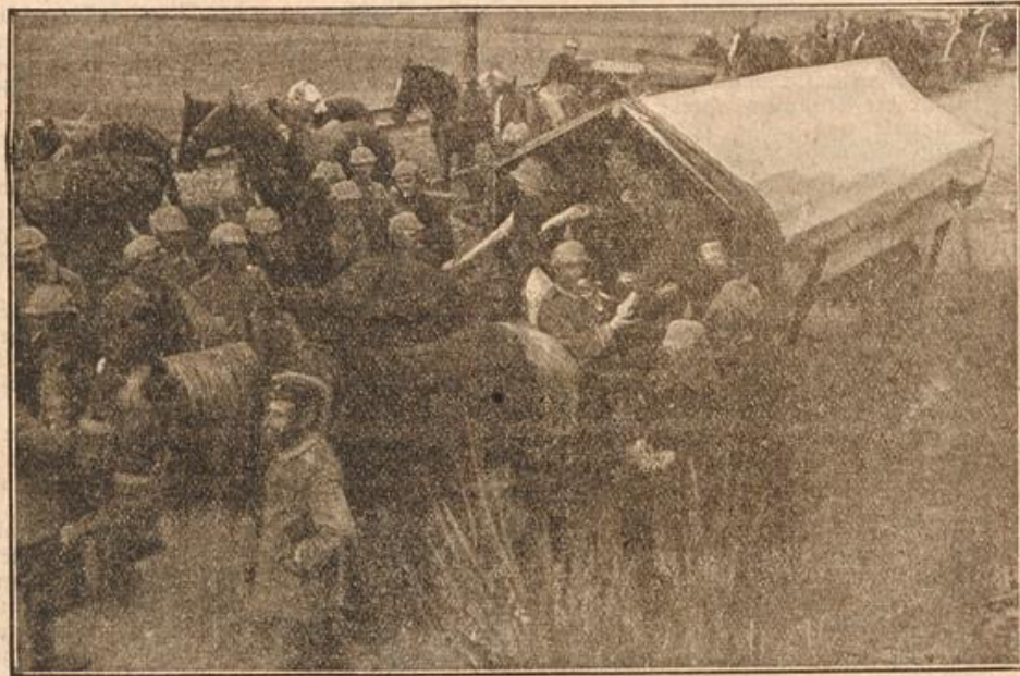
Der willkommenen Marktender bei unseren Bayern in den Vogesen.

Schaut | sammeln, um mit Erfolg den entscheidenden Schlag zu führen. Einen | Liebenswürdigen, wie es Kranken gegenüber stets seine Art war, aber