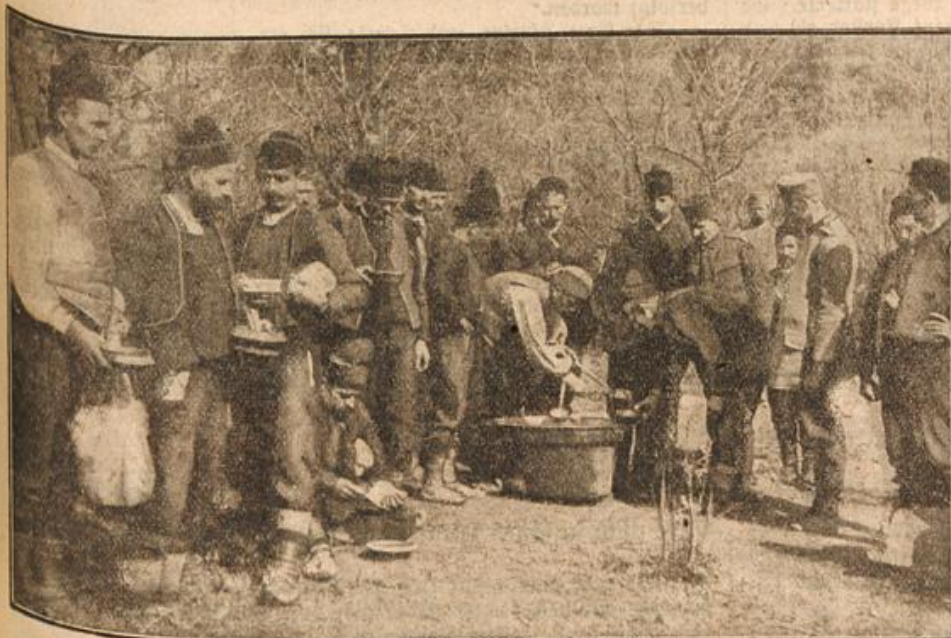
Eine Feldküche bei den bosnischen Regimentern.

Wir zeigen in unserem Bilde eine Aufnahme aus den Kämpfen gegen Serbien. Eine Abteilung der österreichisch-bosnischen Regimenten erhält eben warmes Essen aus der Feldküche.