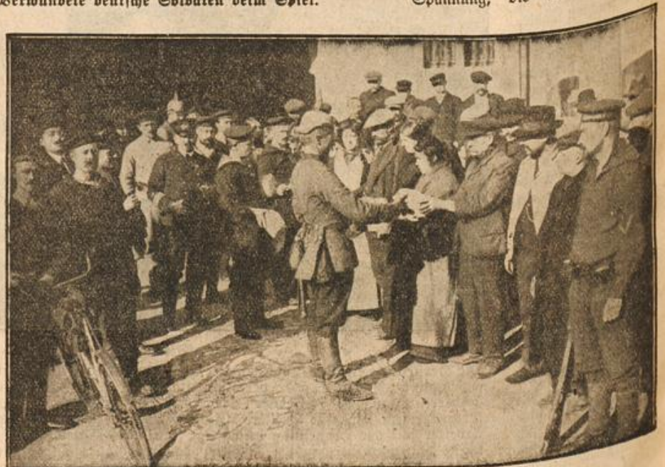
„Die deutschen Barbaren.“

Der Professor zuckt zusammen, schaut nach der Uhr. Wichtig, er hatte seine Bahn einfach davonfahren lassen, und muß nun noch eine weitere Viertelstunde warten, bis er hinaus-eilen kann nach seiner, in dem hübsch gelegenen Vorort „Waldwiese“ gelegenen traulich kleinen Villa. Sein „Nestchen“ nannte er es gern. Er hatte ja nie ein „Nestchen“ gekannt, in dem er sich nach des Tages Last und Arbeit ausruhen und behaglich fühlen konnte. Früh dem trüben und strengen Elternhause hoch oben am Memelstrande entwachsen,