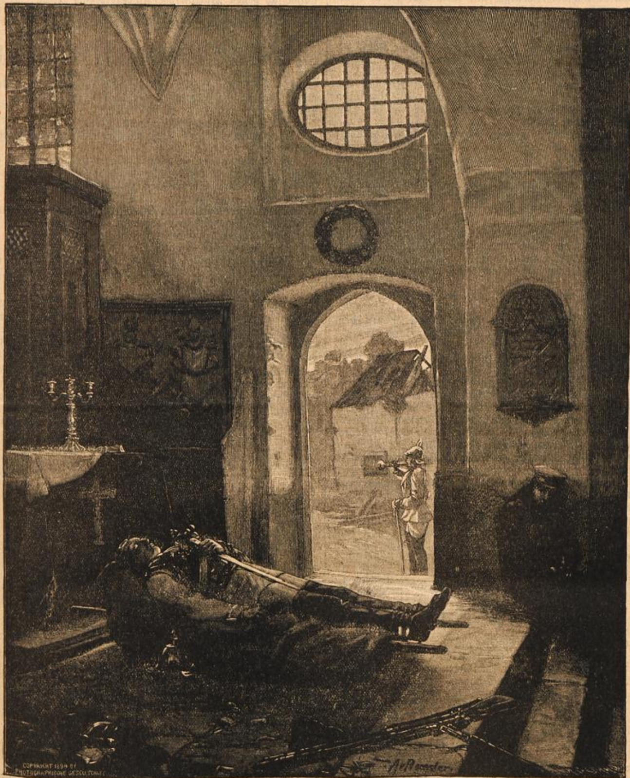
Reveille. Nach dem Gemälde von A. von Köppler.

Es war alles schneller gekommen, als er gedacht hatte. Er hatte gewiß nicht gelogen, als er Martha heute versichert hatte, daß er sie noch nicht hintergangen habe, durch die Lat hatte er