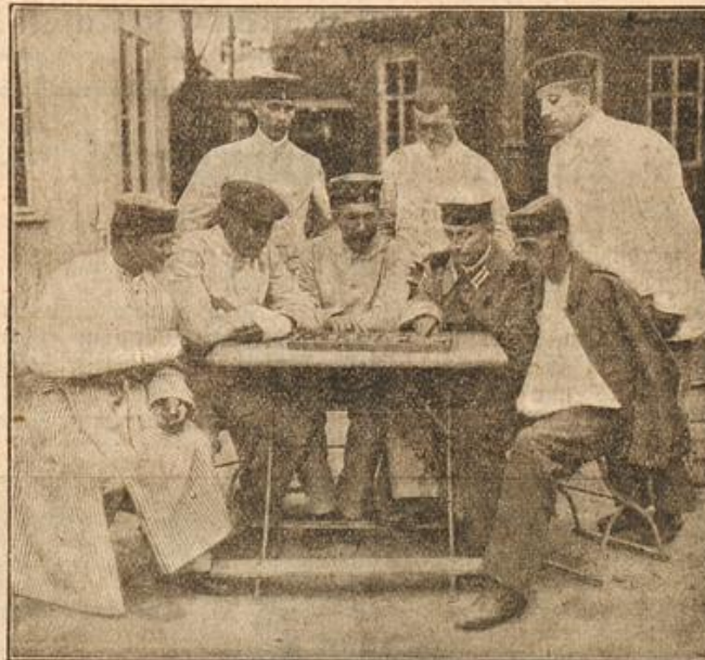
Verwundete deutsche Soldaten beim Spiel.

Deutsche Soldaten teilen mit der ärmeren Bevölkerung Mecheln's ihr Brot. Das sind die bei unseren Feinden als Barbaren verschrienen deutschen Soldaten, die Mitleid haben mit der hungernden Bevölkerung, der ihre eigenen Landsleute alle Lebensmittel fortgenommen haben.