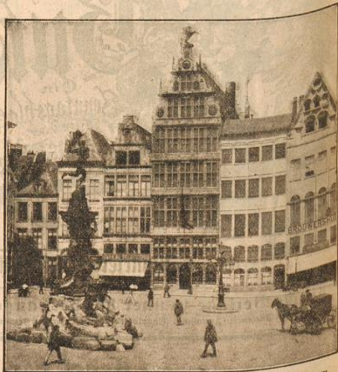
Aus dem eroberten Antwerpen: Der Rathausplatz mit dem berühmten Brabentmal.

„Na, Dir ist es wohl doch zu einsam in Deinem Stevengagen geworden, mein Junge?“ begrüßte ihn der alte Herr