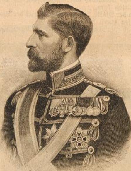
König Ferdinand I. von Rumänien.

König Karl von Rumänien, der Hohenzollernprinz auf dem Balkantrone, starb am 10. Oktober im Alter von 75 Jahren. König Ferdinand, der neue Herrscher von Rumänien, ist ein Neffe des Königs Karl und gilt wie dieser nicht für russenfreundlich. Er wurde am 25. August 1865 in Sigmaringen als Sohn des ältesten Bruders des Königs Karl von Rumänien geboren und vermählte sich im Jahre 1893 mit Maria, Prinzessin von Sachsen-Koburg-Gotha. Sie wurde am 29. Oktober 1875 geboren. Ihrer Ehe mit König Ferdinand sind zwei Söhne und drei Töchter entsprossen. Der Thronfolger ist Prinz Karl, geboren am 16. Oktober 1893.