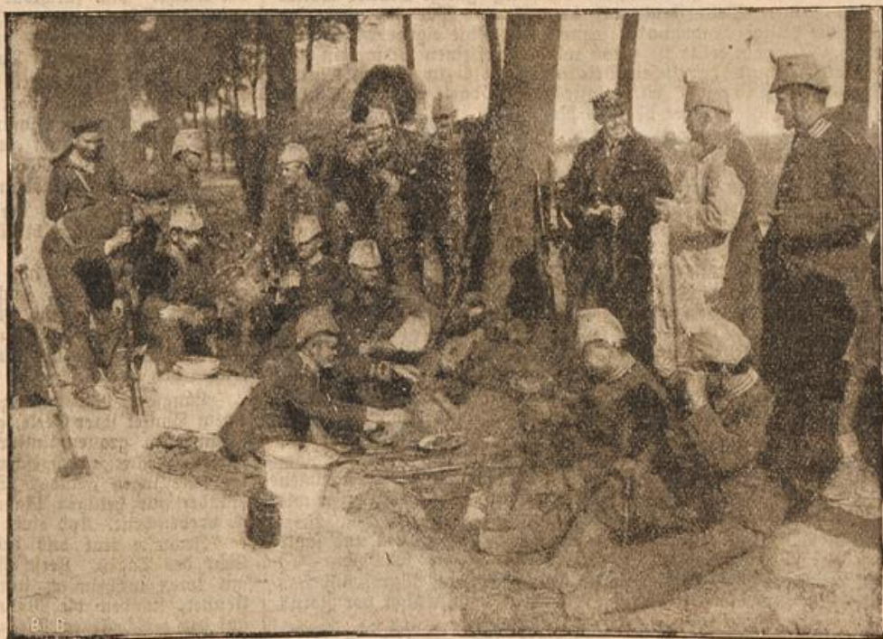
Eine Kiste am Wegesrand.

Deutsche Offiziere und Mannschaften des Seebataillons und der Marinedivision in der Bet- wacht vor Antwerpen.