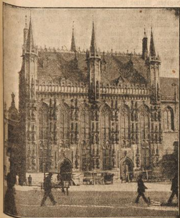
Das weltberühmte Rathaus von Brügge (1376/1387)

Ehe der Baron ihm recht antworten konnte, hatte er sich er- und war in die Halle gegangen. Was er da wollte, wußte eigentlich selbst nicht — nur einen Moment allein sein, um sammeln zu können. In diesem Augenblick öffnete sich eine gegenüberliegende und er stand Annemarie gegenüber. Malte wollte auf sie zutreten, aber da sah Annemarie, wie