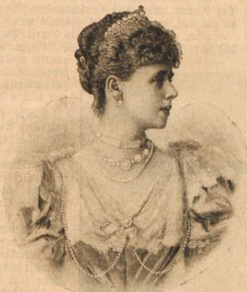
Königin Maria von Rumänien.