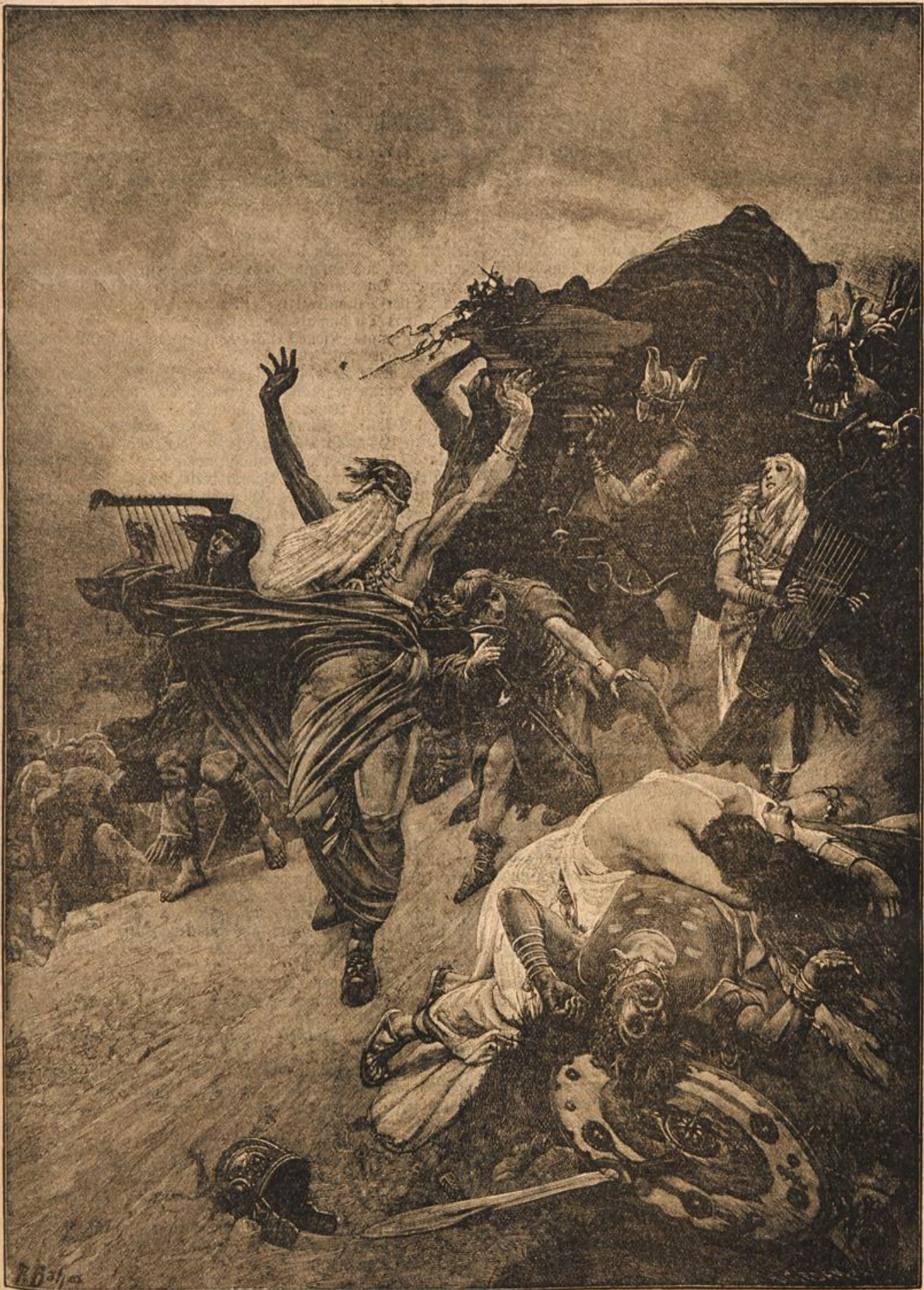
Abzug der Goten mit der Leiche des Königs Tejo nach der Schlacht am Defuro gegen die Römer unter Narfes im Jahre 553. Nach dem Gemälde von R. Böhm.