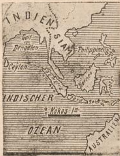
die Kokosinseln im Indischen Ozean, veranschaulicht unsere heutige Kartenskizze.