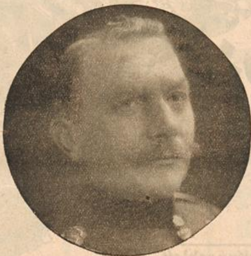
General der Infanterie v. Emmich Sieger von Vättich.

Mädchens rollten unaufhaltsam große, stille Tränen. Sie wagte den