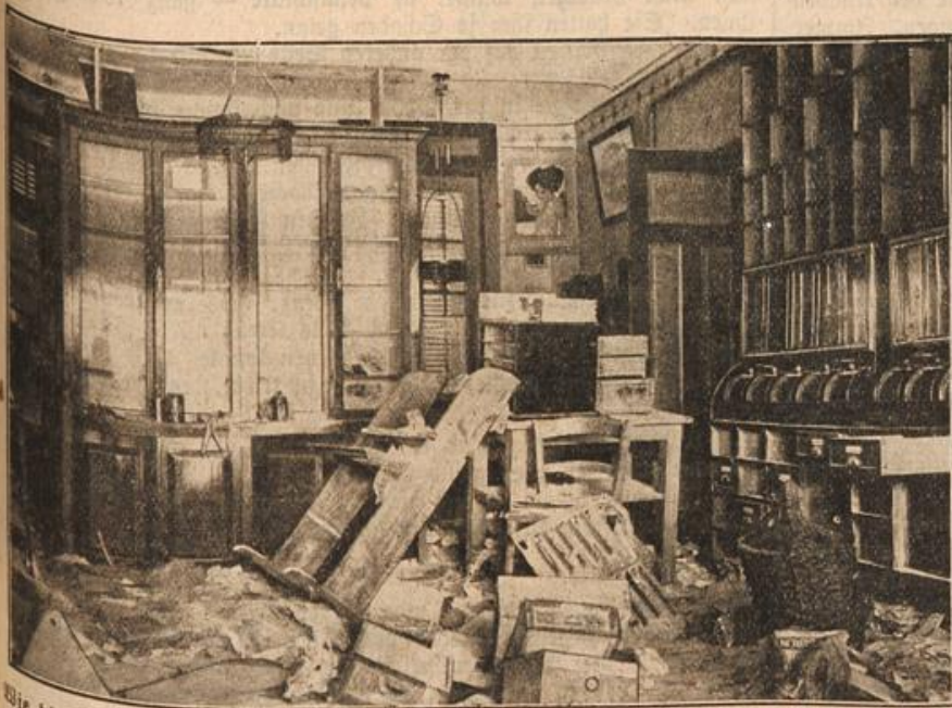
Wie die Franzosen an der Grenze gehaust haben: Das Innere eines Kolonialwarenladens in Deutsch-Aricourt. Die Franzosen kommen in der Zerstörungswut an den Grenzorten den Russen vollständig gleich, denn wir sehen an unserem Wilde, daß auch sie im Innern der Häuser ebenso hausten, wie es die Russen in Ostpreußen getan haben.