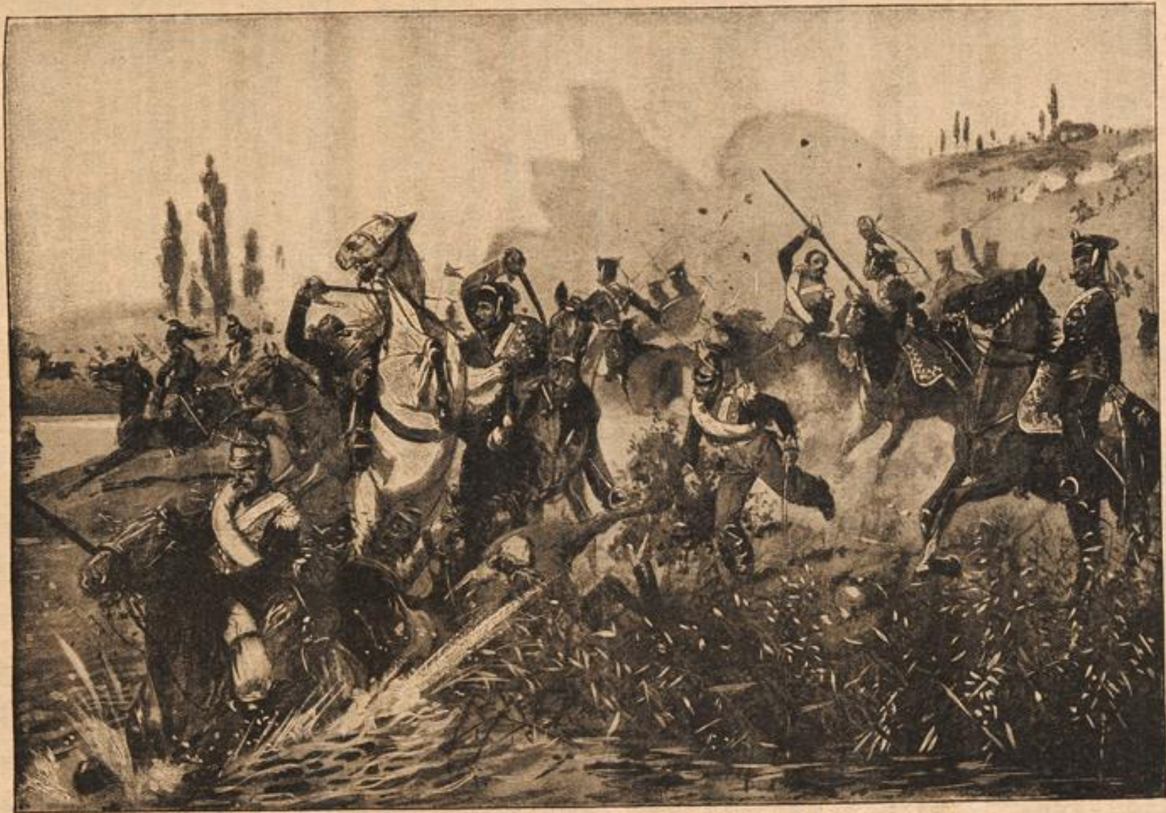
Deutsche Husaren jagen französische Kürassiere in die Maas.