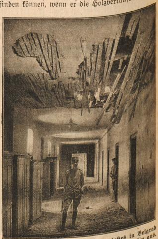
Ein Anbau des serbischen Königspalastes in Belgrad nach der Beschädigung der Hauptstadt von Semlin aus.

Das Charakterbild Koczjerowskis gewann nicht durch diese