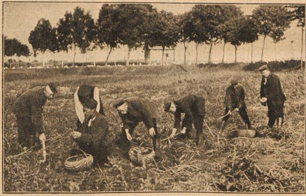
Unser Landsturm beim Kartoffelbuddeln.

Das Auge des Herrn. v. G. Osman. ... wachte reinigte Bild vorichtig Staub und dann zu einer enklute, um es Lageslicht zu Annemarie ihm wie eine wandlerin. fühlte einen Schmerz Kopfe; am lieb- hätte sie sich in unkelsten Win- des Bodens ver- wie ein wundes Tier. Annemarie! Sie hier, ein Wunder!" hielt ihr das entgegen - sraf selbst zu- es war ihr, als ob sie in einen Spiegel blicke. Nur daß Urahe, die als Mädchen von 18 Jahren gemalt sein mochte, ungleich glücklicheren Gesichtsausdruck trug, als Anne- im ersten Augenblick. und nun kommen Sie, Annemarie - ich will Großonkel