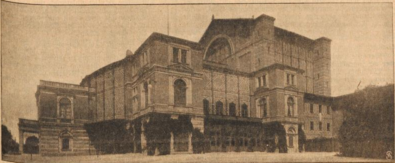
Das Festspielhaus in Bayreuth von der Ostseite.

Wenn die Dorfleute ihm vorgeworfen, daß er sich um die alte Besitzung seiner Väter zu wenig kümmere, so hatten sie ihm damit bitter unrecht getan. Jürgen Malchwig hing mit einer geradezu leidenschaftlichen Liebe an der verwahrlosten Scholle, und er riß sich jedesmal, wenn er seinen Urlaub im Hause seiner Väter verbracht hatte, schwer wieder los. Sah er doch, wie das Gut immer mehr verfiel, das Auge des Herrn fehlte überall. Aber er konnte vorläufig nichts dafür tun. Der alte Baron war in dieser Beziehung ein unerbittlicher Starrkopf. Vor langen Jahren, nach dem Tode seiner jungen Frau, war der damalige Rittmeister Jürgen an ihn mit dem Vorschlag herantreten, daß er seinen Abschied einreichen und die Bewirtschaftung von Malchentin übernehmen wolle. —