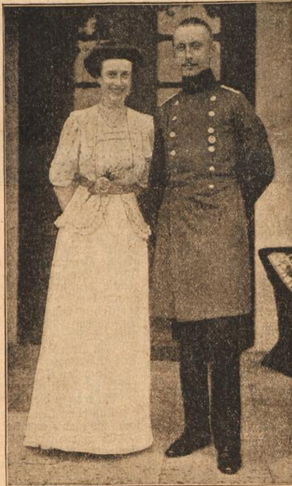
Zur Verlobung im deutschen Kaiserhause.

Als ob die Zeit das alte Haus vergessen hätte; es lag noch da wie vor hundertfünfzig Jahren. Rings um den alten Bau mit den vielschei- nen, auf dem Fenster standen düstere Tan- gen, auf dem Rasenrondel nach der Gasse ein kümmerliches Blumen- beet, auf dem der alte Gärtner müh- sam ein paar hochstämmige Rosen ihr Blüten fristen ließ. Zu Neuanstaf- fungen gab der Baron kein Geld her. Selbst wenn er's gewollt hätte, konnte er es kaum gekonnt. Geld: das kannte es gar nicht mehr anders als die Malchentin. Das Geld war immer da gewesen. Ja, früher, vor lan- gen Zeiten, da hatten's die Malch- tinen wohl noch gehabt, aber das hatte es längst gewesen. Der jetzige Ba- ron er war doch weit über die siebzig! Er war er Malchentin hatte, war's im- mer so ein Gängen und Würgen ge- wesen. Das Gut lag so weit abseits von der Welt. Bis zur Bahnstation zwei Stunden Wagenfahrt. . . . Selbst zur Chauffee mußte man eine halbe Stunde auf dem Knüppeldamm warten, den die Malchentiner Barone vor langen, langen Zeiten gebaut hatten. So war man von der Außen- welt eigentlich fast ganz abgeschlossen. Die beiden alten Leute, die in