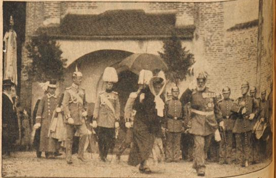
Das bayerische Königspaar (∞) nach der Besichtigung der alten Burgkirche.