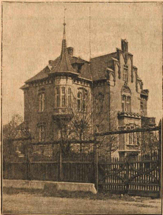
Das neue Offizier-Erholungsheim in Brösen bei Danzig. Für die Offiziere des 17. Armeekorps ist in Brösen bei Danzig ein Erholungsheim errichtet worden, das vor kurzem seiner Bestimmung übergeben wurde. Das neue Heim liegt ganz nahe der Ostsee inmitten eines schönen Gartens.

„Wahrscheinlich soll das der Lohn dafür sein, daß ich sie aus dem Wasser zog — sie glaubt, mich bezahlen zu dürfen, wie sie etwa ihren Kutscher bezahlt! Hätte ich sie doch nie gesehen! Gleich damals unten am Flußufer hegte ich den Wunsch, sie hassen zu können, wie ich's als echter Alton doch eigentlich