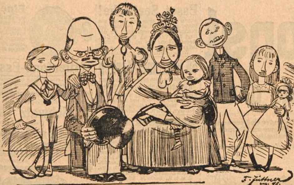
Der Vorstand des Verschönerungsvereins von Nießlingen hat sich mit seiner Familie zum Stiftungsfest photographieren lassen.