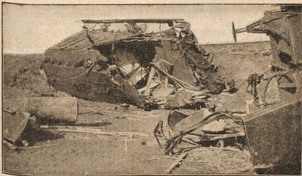
Das schwere Eisenbahnunglück in Hessen. Auf der Station Niedersaulheim bei Mainz ereignete sich anfang Mai ein folgenschweres Eisenbahnunglück durch den Zusammenstoß zweier Züge, deren Lokomotiven mit furchtbarer Gewalt aufeinander prallten. Die Personenzüge wurden den Abhang hinab geworfen und zum großen Teil vollständig zerstört. Unser Bild zeigt den völlig zertrümmerten Personenzug 4. Klasse.

wohl auch Miß Chesters erstes Wort, als sie vorhin auf einen Augenblick zur Besinnung kam: Erich Alton?“ bemerkte der Arzt gleichmütig. — „Unsinn,“ rief Erich errötend, „da müssen Sie sich verhört haben, Doktor.“ „Fragen Sie nur Ihre Schwester, Erich, wenn Sie mir's nicht glauben,“ versetzte Doktor Gordon gelassen, und fuhr dann ernstlich fort: „Seien Sie nicht töricht, Erich, und stoßen Sie die Hand des Schicksals nicht zurück, wenn's soweit kommen sollte! Der ehrliche Stolz hat gewiß seine Berechtigung, aber es gibt auch Fälle, in welchen es geboten erscheint, besagten Stolz in die Tasche zu stecken, das dürfen Sie mir glauben. Adieu für jetzt und nichts für ungut, Erich, wenn mein offenes Wort einen wunden Punkt berührt haben sollte!“ Der Doktor war längst wieder fortgefahren, aber Erich stand noch immer am Fenster und blickte seinem Wagen nach. „Ob er sich wirklich nicht verhört hat?“ murmelte er dabei vor sich hin; „ich würde mich hüten, Mabel zu fragen, denn — nein, ob ich Miß Chester aus dem Wasser gezogen habe oder nicht, der Prozeß muß seinen Fortgang nehmen.“