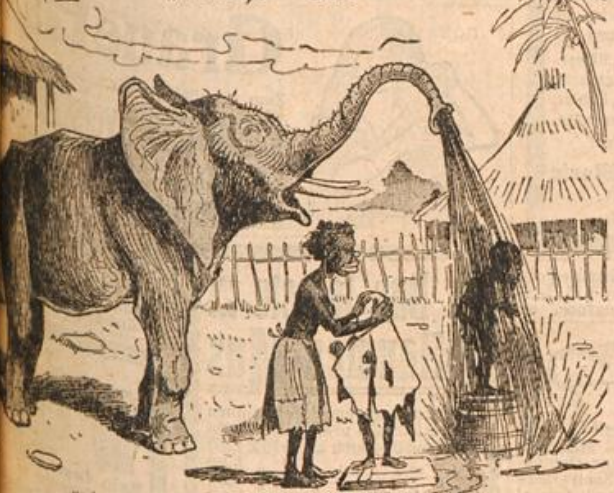
mit natürlicher Douche.