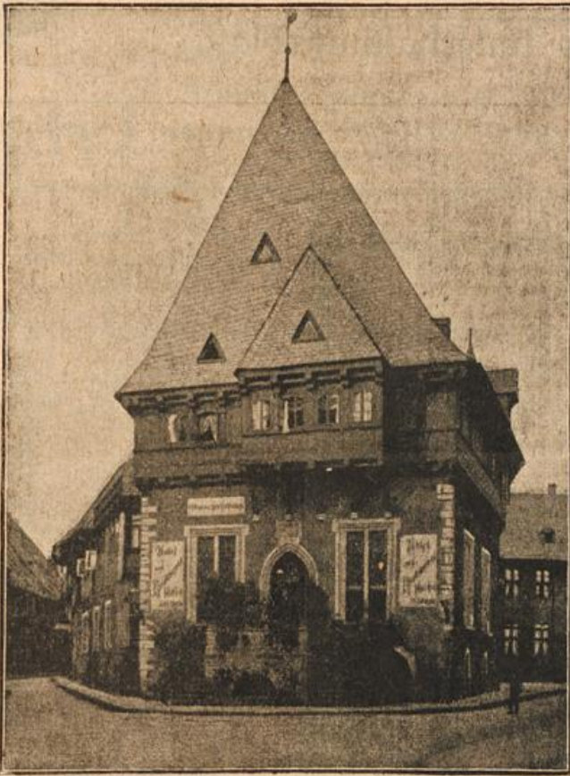
Das historische Gildehaus in Goslar unter dem Hammer. Das alte Gildehaus, eines der schönsten bürgerlichen Baubauwerke aus Goslars spätmittelalterlicher Zeit, soll demnächst öffentlich versteigert werden. Es wurde um 1503 erbaut und diente als Gildehaus der Väterzunft. Jetzt hat sich in ihm wie in den beiden anderen bekannten Häusern, dem Brusttuch und der Kaiserwirth, ein Restaurationsbetrieb im altdeutschen Stil niedergelassen. — Goslar besitzt ein Ortsstatut gegen die Verunstaltung des Städtebildes und ist daher nicht zu befürchten, daß das Gildehaus dem Untergang geweiht ist. Man dürfte aber gespannt sein, wie sich das weitere Schicksal des Gebäudes gestalten wird.