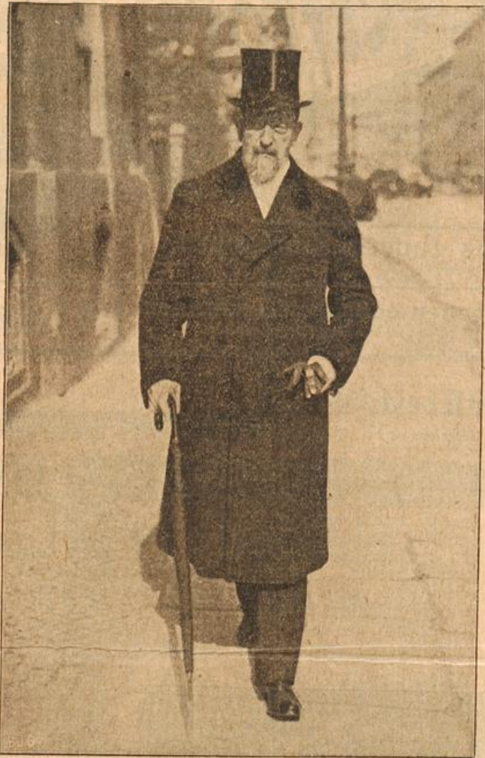
Graf v. Dallwitz, der neue Statthalter der Reichslande.

„Ach Gott — Du bist unverbesserlich,“ mußte Adele, nach