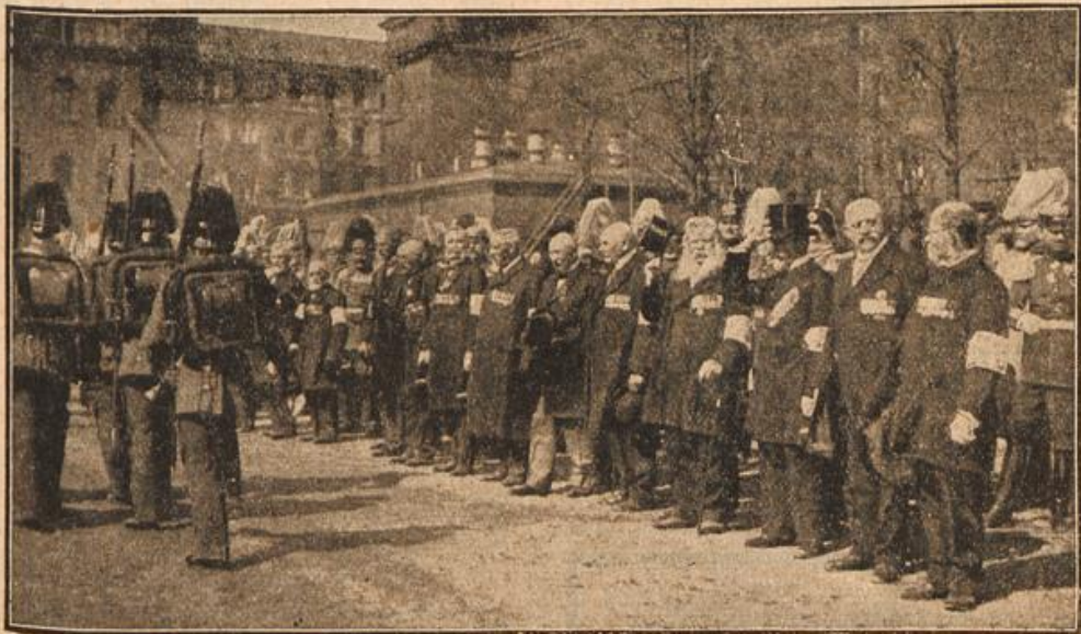
Die Düppel-Gedächtnisfeier in Berlin.

ich Dir nicht, er sei ich Dir nicht, er sei ich Dir nicht, er sei