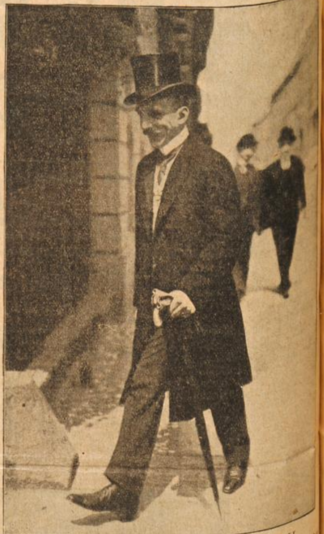
Der neue Minister des Innern v. Voebell.

Zu dem Statthalterwechsel in Elsaß-Lothringen. Nachdem das Abschiedsgesuch des Statthalters Grafen v. Wedel genehmigt ist, wurde der preußische Staatsminister v. Dallwitz zum Nachfolger ernannt, an dessen Stelle der Wirkliche Geheime Rat v. Voebell das Ministerium des Innern übernahm. Der neue Statthalter Dr. v. Dallwitz wurde 1855 in Breslau geboren und trat 1879 in den Staatsdienst. Er erhielt die Berufung ins Ministerium als Hilfsarbeiter. 1910 wurde er Minister, nachdem er vorher als Oberpräsident in Preußen gewirkt hatte. Minister v. Voebell steht im 60. Lebensjahre und ist durch seine Tätigkeit als Chef der Reichskanzlei und Oberpräsident der Provinz Brandenburg bekannt geworden.