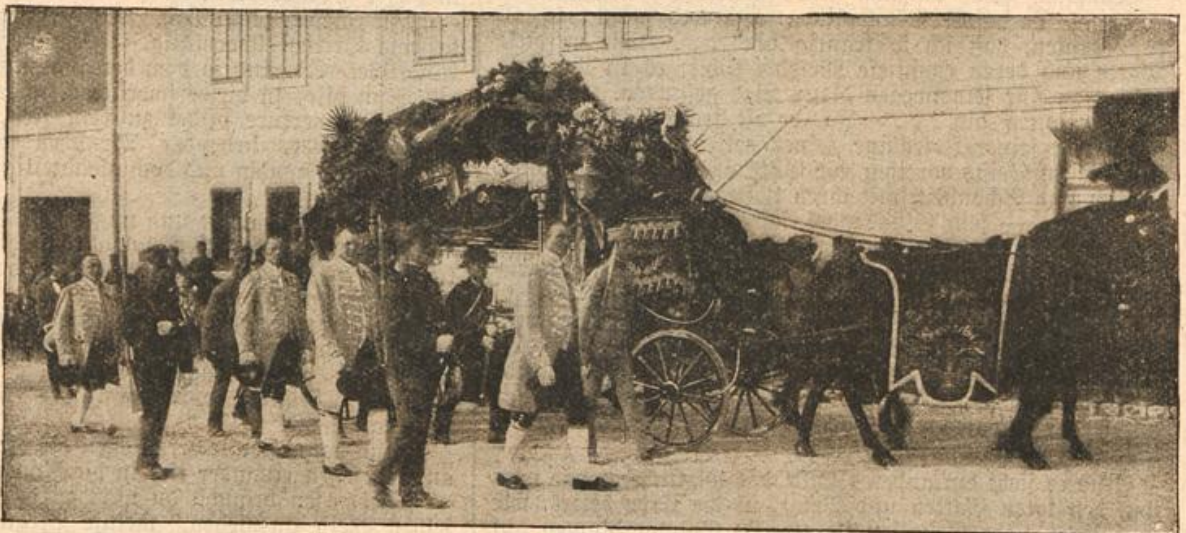
Zur Ermordung des österreichischen Thronfolgerpaares.