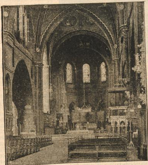
Das Innere des Domes in Münster.

damals, aber es ist doch ein etwas in ihrem Wesen, das dem feinen Beobachter sagt: Diese junge, schöne Frau ist nicht glücklich. Woran man es merkt? Es ist schwer zu definieren. Vielleicht an dem unruhigen, brennenden Blick der dunklen Augen, oder an den feinen Fältchen, die sich ganz leise, wie dunkle Schatten nur, um ihre Mundwinkel graben. Vielleicht ist's auch nur eine gewisse Gleichgültigkeit, die die sonst auf Fuß und Land nur allzu begehrlische Frau jetzt