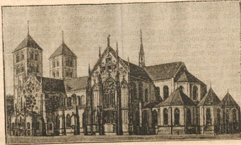
Der Dom in Münster.