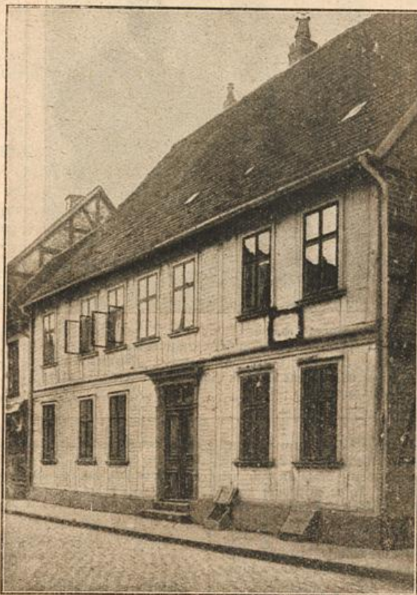
Das Geburtshaus des Feldmarschalls Graf Moltke.

fühlte ihre warme Wange an der seinen. — Nach einer kleinen Weile flüsterte Allan in Brittens Ohr: