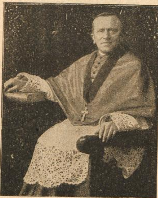
Bischof Job. Poggenburg von Münster.

Die bescheidene Teilnehmerzahl, welche im Jahre 1852 die 6. Versammlung zu verzeichnen hatte, war schon im Jahre 1885, als Münster zum zweiten Male seine Gäste empfing, in so überraschender Weise gestiegen, daß sie Windthorst als die glänzendste und bedeutungsvollste Versammlung bezeichnete, die er mitgemacht habe. Danach werden die Besucher der diesjährigen Versammlung mit vollem Rechte hohe Erwartungen auf Münster setzen. Aber wenn wir erwägen, welche Masse von Arbeiten das Lokalkomitee unermüdlich noch fortwährend leistet, werden sie nicht enttäuscht werden. Die Stadt, die ihre Gründung auf Karl den Großen zurückleitet und im Laufe der Jahrhunderte so viele interessante geschichtliche Begebenheiten verzeichnen kann, wird keinen ihrer Besucher, der sie mit aufnahmefähigem Sinn durchwandert, unbeeindruckt lassen, und wenn sie sich auch nicht einer besonders bevorzugten landschaftlichen Lage rühmen kann, findet man