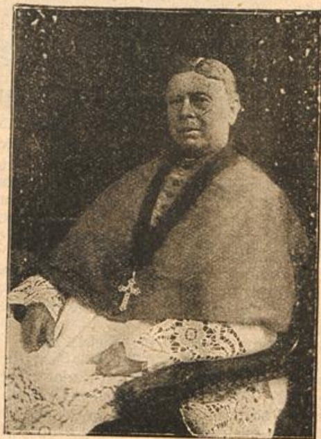
Wichbischof Kappenberg von Münster.

mit niedrigen Dächern bedeckt. In seinem Baustil zeigt der Dom nicht rein gotische Formen, sondern den Uebergang von der vorgotischen zur gotischen Kunst. Er wurde im Jahre 1261 eingeweiht, nachdem im Jahre 1170 an dem Bau begonnen worden war; der erste, vom heiligen Ludgerus im Jahre 792 errichtete Dom wurde nach Fertigstellung des jetzigen niedergeleat.