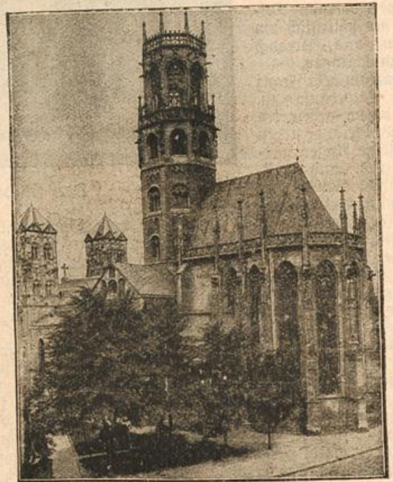
Die Ludgeri-Kirche in Münster.