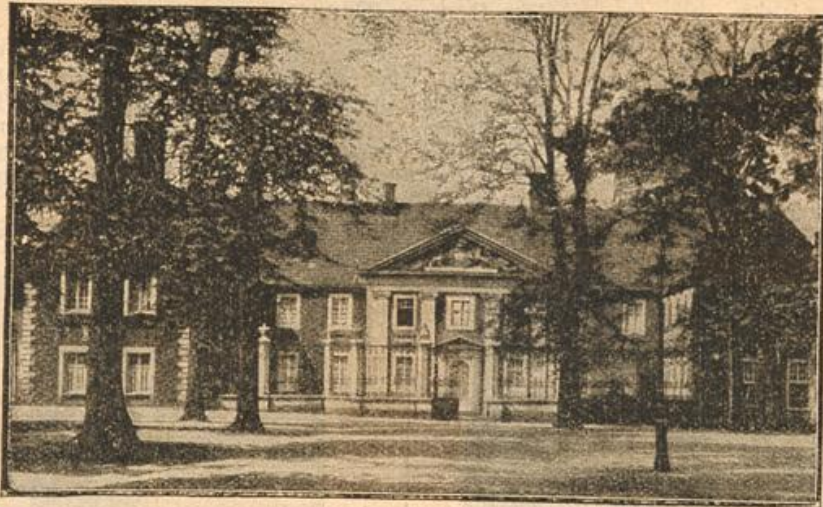
Das Bischofs-Palais in Münster.

Die Hochzeit wird nach althergebrachter Weise auf der mit Maibäumen und Kränzen geschmückten Diele gefeiert. Hulldigt die junge Generation auch sonst stets moder-