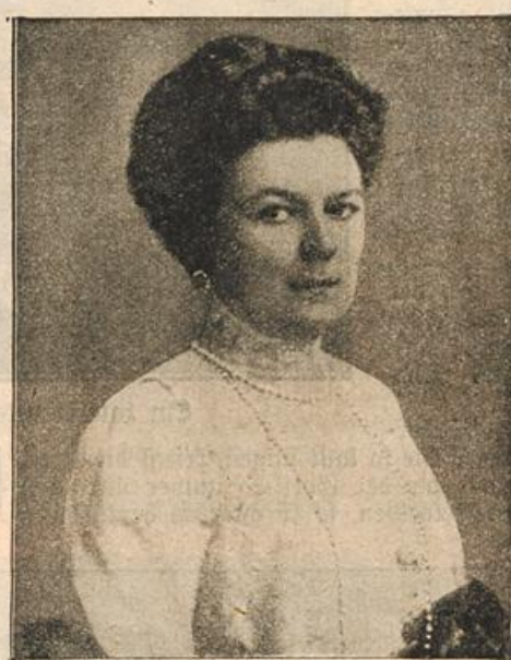
Sophie, Herzogin von Hohenzollern, seine Gemahlin †.

dahin, zusammengesunken wie ein Kartenhaus! Da wagt sie das Neufferste. „Sehen Sie denn nicht, daß er betrunken ist?“ zischt sie dem Chef des Vereins zu, der eben zu der Gruppe der Schießenden getreten ist, wo ein erwartungsvolles Schweigen entsteht. Mit einem Schläge übersieht der die Situation. Höflich, aber eindringlich erwidert er: „Madam, Madam, bitte, halten Sie das Schießen nicht auf.“ Wie Triumphgeschrei gleitet es über die Gesichter der Männer, höhnisch lächeln die Frauen, denn Madam Amalie hat sich durch ihr anspruchsvolles Wesen nicht viele Freunde gemacht. Sie ist einer Ohnmacht nahe. Diesen Augenblick benutzen die ehemaligen Kumpane des Gottlieb. Schon liegt des Stadtschreibers Büchse auf der Unterlage des Stammes. Gottlieb zielt, zielt genau. Wird er, der Kurzsichtige, treffen? Große Spannung ist eingetreten. Unter dem Vorwande zu helfen, korrigiert der Herrm an der Gewehrlage herum. Der Gottlieb zielt noch immer. Auch ihn hat der Schützenehregeiz erfaßt. Er sieht den zappelnden Vogel und ein heißes Verlangen zu siegen ergreift ihn. Hat er den Plan der Verschworenen erfaßt? Weiß er, daß dieser Schuß über seine häusliche Unabhängigkeit entscheidet? Locken ihn die gemüthlichen Sitzungen der Genossen? Goldene Freiheit ist der Siegespreis. Und so zielt er mit der Anspannung aller Kräfte. Noch einmal sieht der Herrm nach. Da drückt Gottlieb ab. Los kracht die Büchse. Des Schreibers schwächliche Gestalt taumelt zurück.