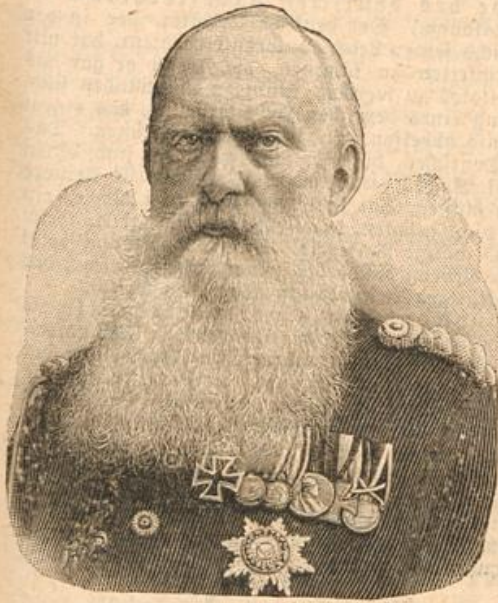
Herzog Georg II. von Sachsen-Meiningen †.

Mit dem am 25. Juni 1914 in Bad Wildungen verstorbenen Herzog Georg von Sachsen-Meiningen ist der älteste der deutschen Bundesfürsten aus dem Leben geschieden. Er war am 2. April 1826 zu Meiningen geboren und hatte sich in Bonn