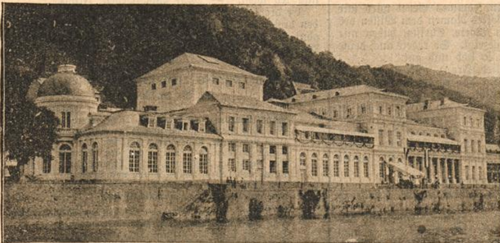
Das neue Kurtheater in Bad Ems.

Ja, die Festwiese! Das ist der Hauptanziehungspunkt der ganzen Kirmes. Alles ist da. Am Ende des Platzes, wo der Berg gemacht zu steigen beginnt, steht die Vogelstange. Der neue eichene Königsvogel, dessen Fall die heilumworbene Königswürde verleiht, thront schon stolz und trotzig, herausfordernd fast auf seiner Stange. Na, warte, du Grobian! denken die Männer, die schon den ganzen Nachmittag nach der Scheibe geschossen haben, um Hand und Auge für morgen zu üben. Eine mit Seife beschmierte Stange verheißt kletterlustigen Knaben lodende Preise, Würste, Taschenmesser und andere Lieblingsgegenstände. Schießbuden stehen schon fertig