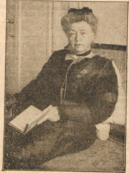
Freifrau Bertha von Suttner †.