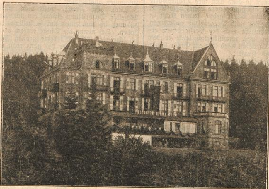
Das Friedrich Hilda-Erholungsheim im Bühlertal (Baden).

„Du hast kein Recht, über meine Lebenspläne zu be-