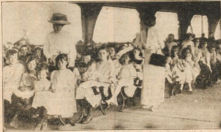
Eine Zahnputzstunde in einer amerikanischen Schule.

[Eine Zahnputzstunde in einer amerikanischen Schule.] (Mit Abbildung.) In dem Stundenplan der amerikanischen Schulen ist eine Stunde vorgesehen, in welcher der Unterricht von einer Ärztin erteilt wird, die den Kindern die zweckmäßigste Art, die Zähne zu putzen, beibringt. Bei uns in Deutschland ist man in dieser Beziehung weiter vorgeschritten. Nachdem festgestellt worden war, daß 90 Prozent der Schulkinder an kranken Zähnen leiden, wurden in fast allen größeren Städten Schulkliniken errichtet, in denen die Kinder behandelt werden. Immerhin könnte es nicht schaden, außerdem noch nach dem amerikanischen Muster zu verfahren und so durch reinliche Zahnpflege die Zahnfäulnis, unter der die meisten Kinder leiden, etwas einzudämmen.