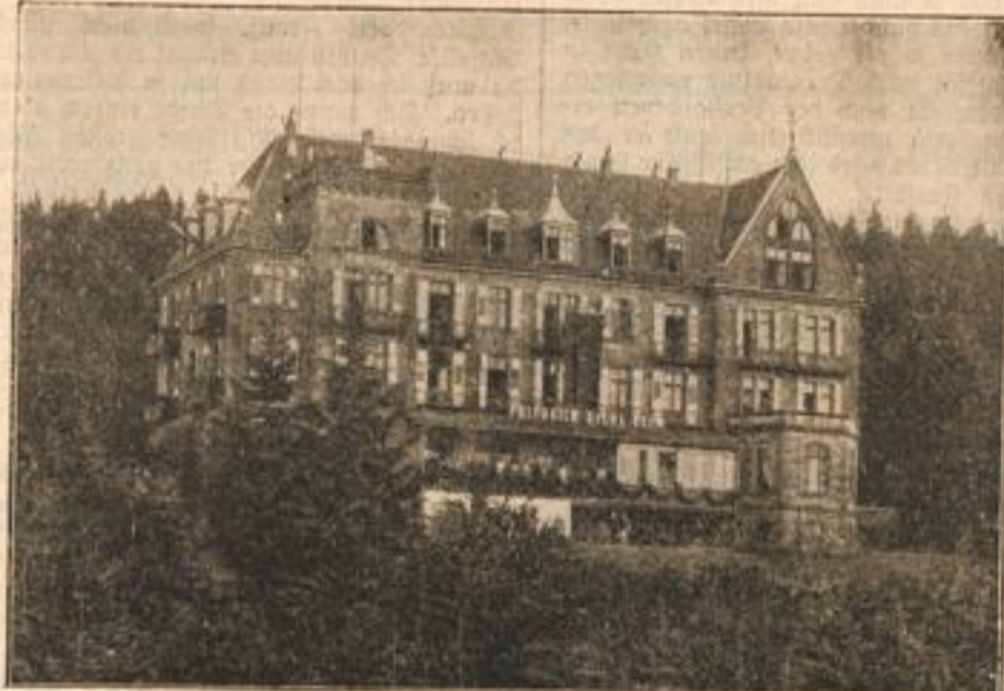
Das Friedrich Hilda-Erholungshelm im Bühlertal (Baden).

„Du hast kein Recht, über meine Lebenspläne zu be-“