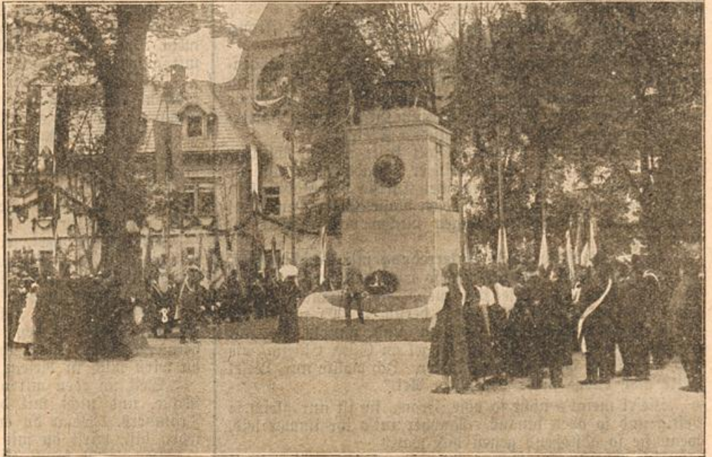
Denkmal-Enthüllung in St. Blasien (Schwarzwald).

Auch für die weltliche Festesfreude ist gesorgt. Der Bauer befördert auf schweren Karren mächtige Bierfässer in die Stadt, und blizblau leuchten die Wirtstische. Eine