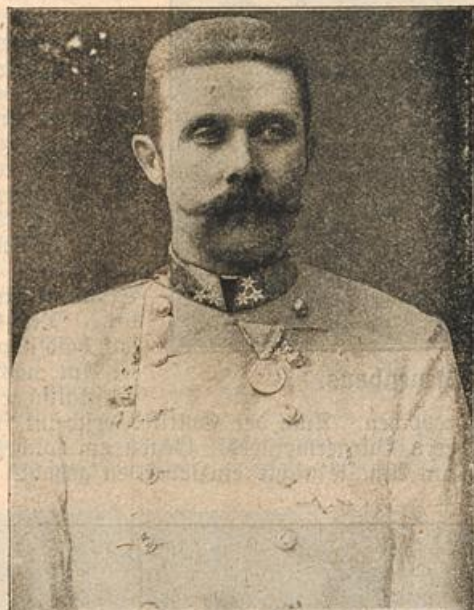
Erzherzog Franz Ferdinand von Oesterreich †.