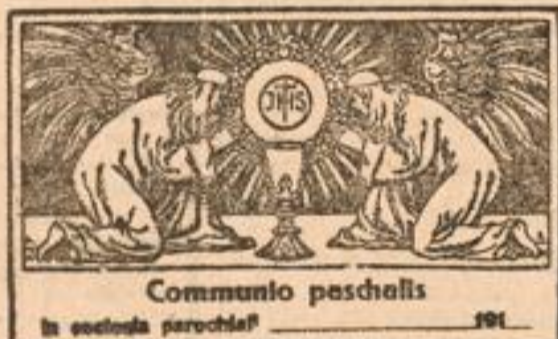
Communio paschalis in ecclesia parochiali 191

Die beiden Darstellungen Nr. 2 eignen sich als Kommunionzettel. Sie werden auf Chamols-Papier hergestellt.