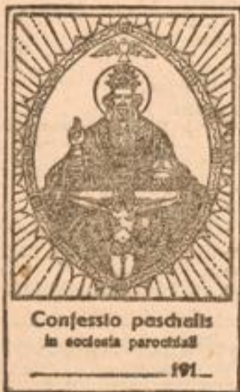
Confessio paschalis in ecclesia parochiali 191

Neu erschienen sind in unserem Verlage sechsen nachstehende fünf Abbildungen.