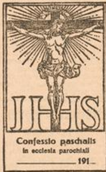
Confessio paschalis in ecclesia parochiali 191

Wir möchten auf diese fünf von einem Münchener Künstler gezeichneten Neuheiten den hochw. Klerus besonders aufmerksam machen und sie zur geneigten Abnahme bestens empfehlen.