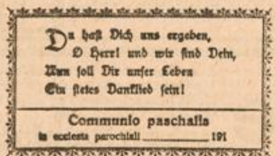
Communio paschalis in ecclesia parochiali 191