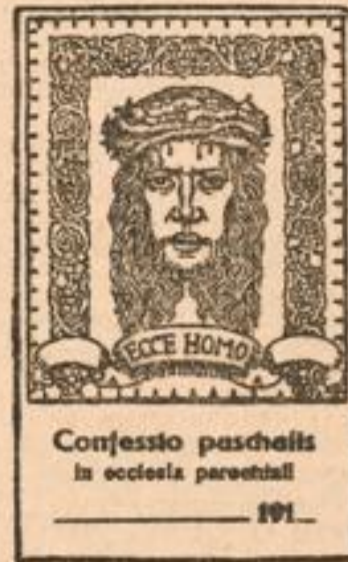
Confessio paschalis in ecclesia parochiali 191