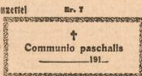
Communio paschalis 191

auf welchem oder farbigem Papier 1000 St. M. 2.50 500 St. M. 1.60 200 St. M. 1.20 bei Frankozusendung.