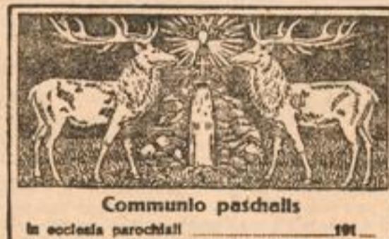
Communio paschalis in ecclesia parochiali 191