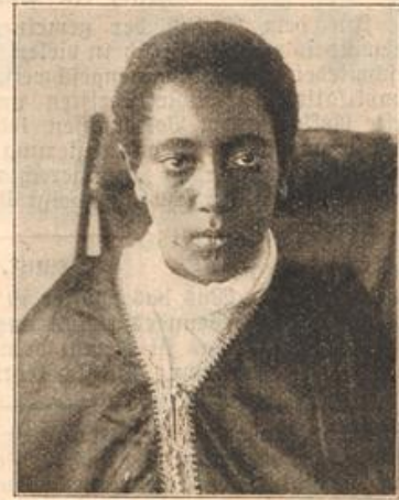
Lidj Jeassu, der neue Kaiser von Abessinien.

Unsere beiden Abbildungen zeigen den jugendlichen Herrscher und seine Residenz in der etwa 70 000 Einwohner zählenden Hauptstadt Addis-Ababa.