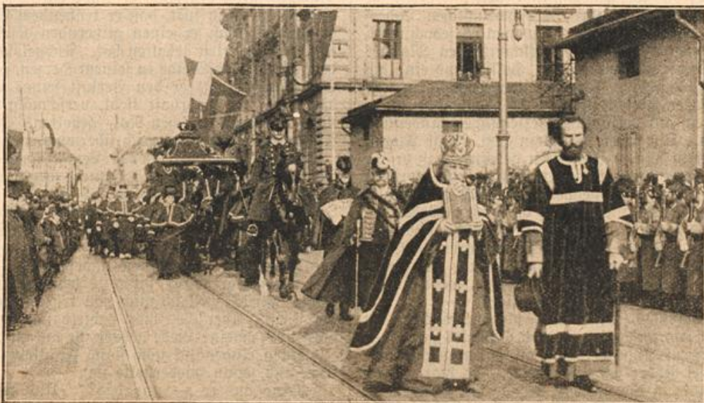
Das Leichenbegängnis der Prinzessin Wilhelm von Baden in Karlsruhe.