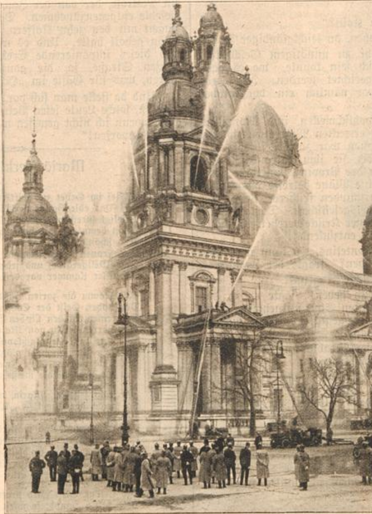
Die Bekämpfung des angenommenen Dombrandes in Berlin.

Doch als seine Frau ihm draußen kurz und bündig erklärte, daß solch Dummkopf wie er