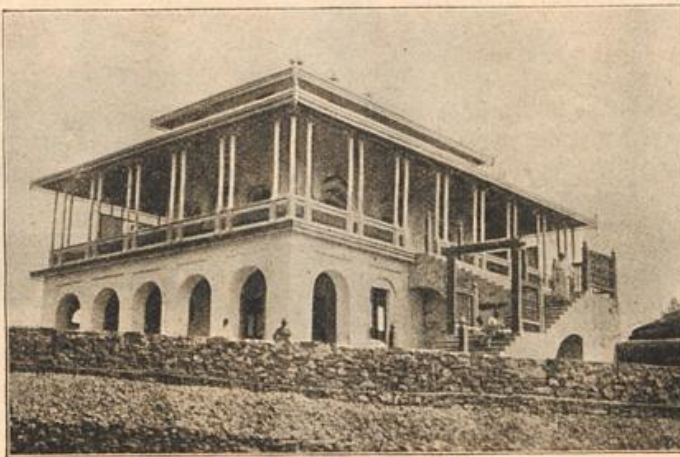
Residenzschloß des neuen Kaisers von Abessinien.

In der Mittagsstunde des 20. Februar erfolgte die feierliche Ueberführung der Leiche vom Sterbehause nach dem neuen Hauptbahnhofs. Unsere Abbildung zeigt den Trauerzug in den Straßen von Karlsruhe mit der hohen russischen Geistlichkeit im Vordergrund.