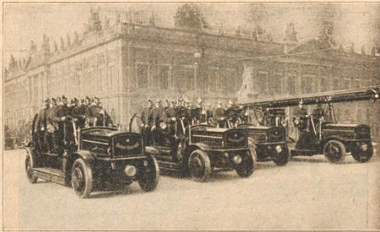
Auto-Parade der Berliner Feuerwehr vor dem deutschen Kaiser.

Oberst v. d. Trent besetzte nun die Höhen zwischen Zabern und Walzburg und verammelte den Paß durch Niederhauung der Wälder. Die genannten Panduren waren Freischaren, die v. d. Trent seit 1741 Maria Theresia zur Verfügung gestellt hatte