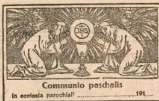
Communio paschalis in ecclesia parochiali

Die beiden Darstellungen Nr. 2 eignen sich als Kommunionzettel. Sie werden auf Chamoi-Papier hergestellt.