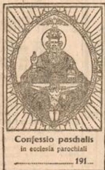
Confessio paschalis in ecclesia parochiali

Neu erschienen sind in unserem Verlage soeben nachstehende fünf Abbildungen.