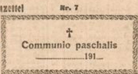
Communio paschalis 191

auf weißem oder farbigem Papier 1000 St. M. 2.50 500 St. M. 1.60 200 St. M. 1.20 bei Frankozusendung.