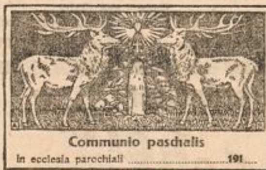
Communio paschalis in ecclesia parochiali