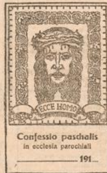
Confessio paschalis in ecclesia parochiali