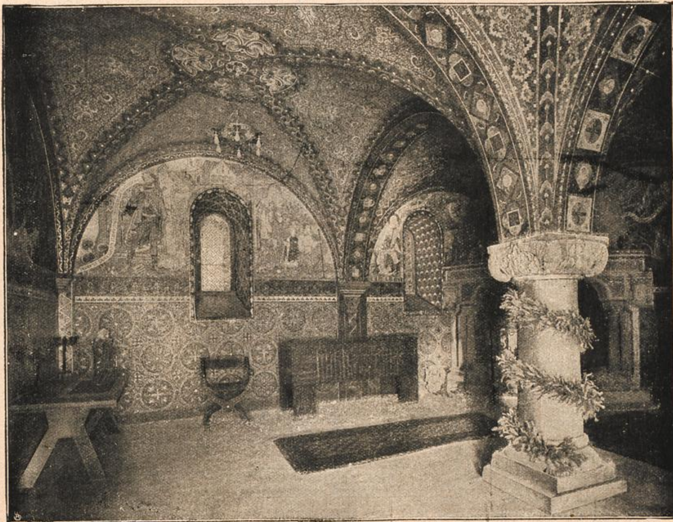
Neue Mosaiken der Kemenate der heiligen Elisabeth in der Wartburg.

Die Wartburg befand sich zu Anfang des 19. Jahrhunderts in einem Zustande öder Verwahrlosung, so daß nicht mehr viel fehlte, und man hätte auch von ihr singen können, wie von den Burgen, die der Saale Strand säumen: „Ihre Dächer sind zerfallen, und der Wind streicht durch die Hallen.“ Der Bergfried