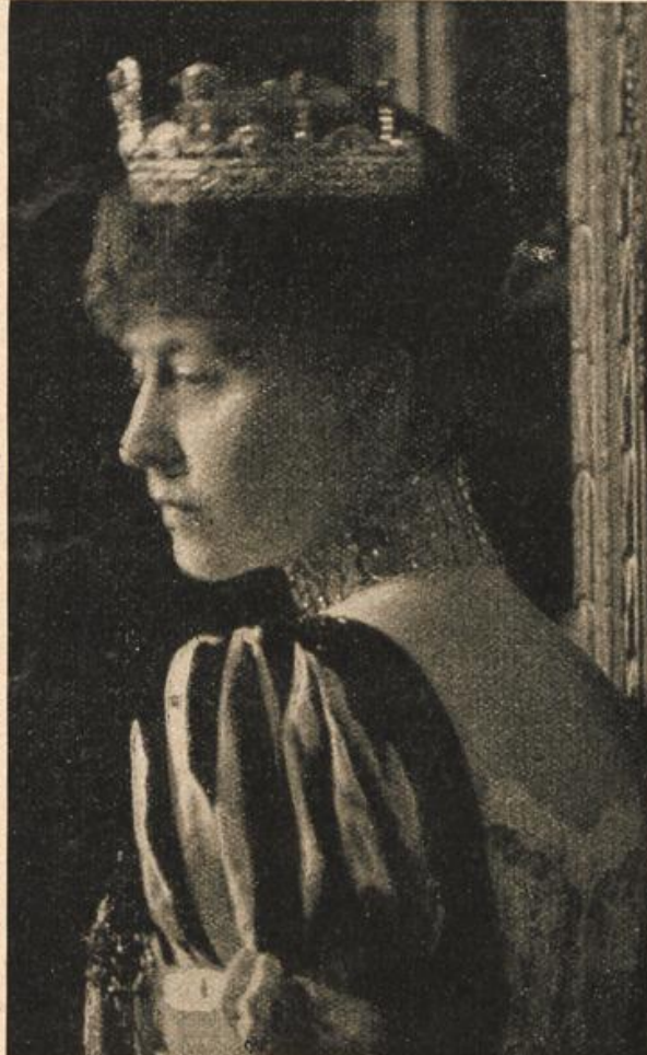
Herzog Bernhard von Sachsen-Meiningen und seine Gemahlin.

In den letzten Tunitagen ist Herzog Georg II. von Sachsen-Meiningen nach fast fünfzigjähriger, reichgeegneter Regierung gestorben, und sein ältester Sohn, der nunmehrige Herzog Bernhard, hat die Regierung angetreten. Zu unserm Kaiserhause steht der neue Landesherr im engsten Verwandtschaftsverhältnis, denn seine Gemahlin, die Herzogin Charlotte, mit der er sich am 18. Februar 1878 zu Berlin vermählte, ist die älteste Schwester Kaiser Wilhelms II., der sie denn auch zum Chef des Gren.-Regts. König Friedrich III. (2. schles.) Nr. 11 ernannt hat. Herzog Bernhard bekleidet in der preußischen Armee den Rang eines Generalobersten mit dem Rang eines Generalfeldmarschalls.