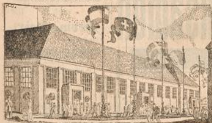
Allgemeiner Auslands pavillon.

Alle Paläste der fremden Staaten liegen an der prächtigen „Straße der Nationen“, die sich vom Eingange B der Ausstellung bis zur gegenüberliegenden „Halle der Kultur“ hinzieht. Die Straße der Nationen ist in diesem Jahre der Sammelpunkt der ganzen gebildeten Welt, und ein buntes