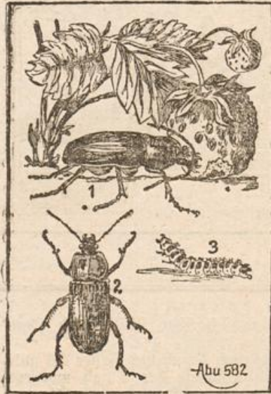
Der Getreidelaufläfer. 1 bei der Arbeit, 2 von oben gesehen, 3 Larve.

Der Getreidelaufläfer (s. Abb.). Die Laufläfer sind Raubläfer und im großen ganzen nützlich, denn sie fangen allerlei schädliches Ungeziefer. Der einzige Schädling unter ihnen ist der Getreidelaufläfer, der ebenso wie seine Larve ein arger Getreideverwüster ist. Aber auch die Erdbeeranlagen schädigt er ab und zu, indem er sie in großen Massen zur Nachtzeit überfällt und sowohl reife als unreife Früchte anfriszt und wohl auch ganz vertilgt. Die Larve lebt in Spatentiefe in selbstgebohrten Gängen in der Erde, von wo sie nur des Nachts hervor kommt. Sie verpuppt sich in eine weißliche Puppe, aus der gegen Ende Juli der Käfer entsteht. Die Vertilgung muß sich hauptsächlich auf den Käfer beschränken, indem man ihn des Nachts bei Laternenlicht jagt. Auch kann man