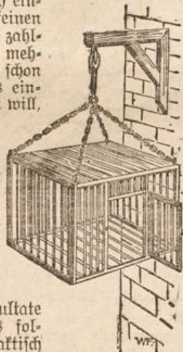
Käfig zur Vertreibung der Brutlust.