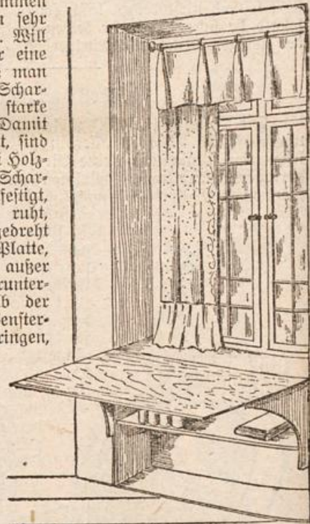
Das verbreiterte Fensterbrett.

das zur Aufnahme von Büchern, Spielzeug usw. benützt werden kann. In beschränkten Räumen dient dieses verbreiterte Fensterbrett als Arbeitspult, an dem die Kinder ihre Schulaufgaben machen. In diesem Fall kann man die Platte mit Wachstuch benageln; als Spielbrett genügt ein Olfarbenaustrich von gleicher Farbe, wie sie das Fensterbrett aufweist.