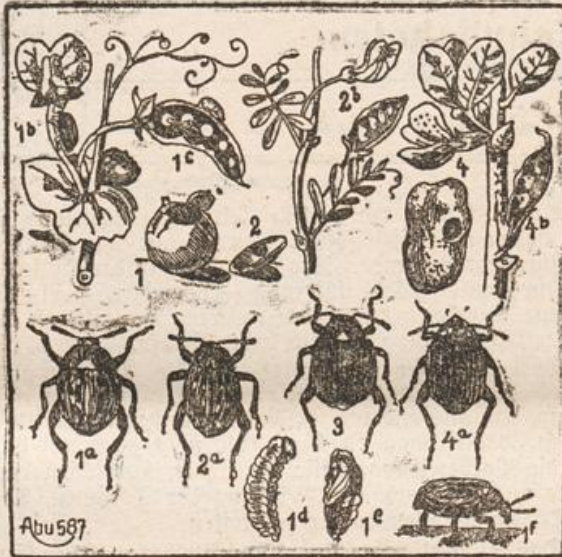
1a Erbsenkäfer, 1b nat. Größe, 1c Erbsenschote mit Larve, 1d Larve, 1e Puppe, 1f Käfer von der Seite. 2a Linsenkäfer, 2b Linsenschote mit Larve. 3 Gemeiner Samenkäfer. 4a Bohnenkäfer, 4b Bohnenschote mit Larve.

Die Samenkäfer (s. Abb.) befallen hauptsächlich unsere Hülsenfrüchte und richten da doppelten Schaden an, indem sie