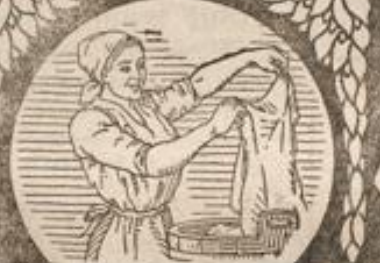
Trine spricht - mit Kennerblicken - „Seifix“ bleicht doch zum Entzücken.