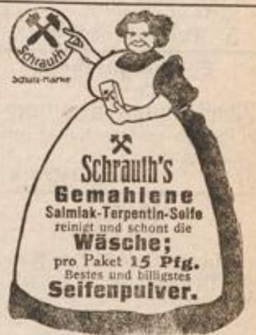
Schrauth's Gemahlene Salmiak-Terpentin-Soife reinigt und schont die Wäsche; pro Paket 15 Pfg. Bestes und billigstes Seifenpulver.

Vermietung von Safes in unserer feuer- u. einbruchssicheren Stahlkammer.