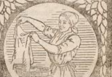
Trine spricht - mit Kennerblicken - „Seifix“ bleicht doch zum Entzücken.